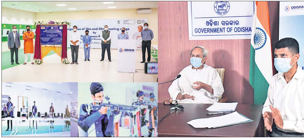
ଭିତ୍ତି ଉଦ୍ଘାଟନ କରିଥିଲେ ମୁଖ୍ୟମନ୍ତ୍ରୀ ନବୀନ ପଟ୍ଟନାୟକ କ୍ରୀଡ଼ା ଭିତ୍ତିଭୂମିର ଉଦ୍ଘାଟନ କରୁଛନ୍ତି।

ରାଜ୍ୟକୁ କ୍ରୀଡ଼ା ହବ୍ରେ ପରିଣତ କରିବାକୁ ସରକାର ଉଦ୍ୟମ କରି ରଖିଛନ୍ତି। ଏହିକ୍ରମରେ ମୁଖ୍ୟମନ୍ତ୍ରୀ ନବୀନ ପଟ୍ଟନାୟକ ସୋମବାର ଭିତ୍ତି ଉଦ୍ଘାଟନ କରିଥିଲେ। କ୍ରୀଡ଼ା ଭିତ୍ତିଭୂମିର ଉଦ୍ଘାଟନ କରିଛନ୍ତି। ଗଞ୍ଜାମ ଜିଲାର ହିଞ୍ଜିଳିକାଟୁରେ ଇନ୍ଡୋର ଷ୍ଟାଡ଼ିୟମ୍, ଛତ୍ରପୁରରେ ମଟି ବ୍ୟାଡମିଣ୍ଟନ କୋର୍ଟ ସହିତ ମଟି ଇନ୍ଡୋର ଷ୍ଟାଡ଼ିୟମ୍ ଏବଂ ଭୁବନେଶ୍ୱର କଲିଙ୍ଗ ଷ୍ଟାଡ଼ିୟମରେ ୧୦ ମିଟର ଏବଂ ୫୦ ମିଟର ଶୁଟିଂ ରେଞ୍ଜକୁ ଲୋକାର୍ପିତ କରିଛନ୍ତି। ସେହିପରି ହକ୍ କ୍ରୀଡ଼ାକୁ ପ୍ରୋତ୍ସାହନ ଦେବା ଲାଗି ଛତ୍ରପୁରଠାରେ ଏକ ସିଲଭର ଟ୍ରଫି ହକ୍ ଚାଲିମ କେନ୍ଦ୍ର ସ୍ଥାପନ କରାଯିବ ବୋଲି ମୁଖ୍ୟମନ୍ତ୍ରୀ ଘୋଷଣା କରିଛନ୍ତି। ଶୁଟିଂ ରେଞ୍ଜ ଆଦିତ୍ୟ ବିଲା ଗ୍ରୁପ ଦ୍ୱାରା ବିକଶିତ କରାଯାଇଛି। ଏହି ଅବସରରେ ମୁଖ୍ୟମନ୍ତ୍ରୀ କହିଛନ୍ତି ଯେ, ୫ଟି ଅଭିନବ ପ୍ରୟାସ ଭଳି ଆଗାମୀ ଦିନରେ କ୍ରୀଡ଼ାର ବିକାଶ ପାଇଁ ଏକ ବୈପ୍ଳବିକ ପରିବର୍ତ୍ତନ କରାଯିବ। ଉନ୍ନତମାନର ପ୍ରଶିକ୍ଷଣ ଏବଂ ଭିତ୍ତିଭୂମି ଆମ ରାଜ୍ୟର କ୍ରୀଡ଼ାବିତମାନଙ୍କୁ ରାଜ୍ୟ ତଥା ଦେଶର ଚୋରବ ବଢ଼ାଇବାରେ ସହାୟତା କରିବ। ଆସନ୍ତା ଦଶନ୍ଧିକୁରେ ରାଜ୍ୟରୁ ନୂଆ ପିଢ଼ିର ବିଶ୍ୱପ୍ରୟାସ କ୍ରୀଡ଼ାବିତ୍ ସୃଷ୍ଟି ହେବେ। ହିଞ୍ଜିଳିକାଟୁ ରାଜ୍ୟର ଏକ