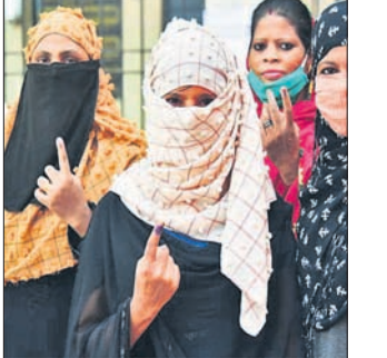
ବୁଧବିଳା, ୩୧୧ (ପି.ଟି.)

ବିହାର ବିଧାନସଭାର ୯୪ ଆସନ ଲାଗି ମଙ୍ଗଳବାର ଭୋଟଗ୍ରହଣ ଶେଷ ହୋଇଛି। ଏହି ପର୍ଯ୍ୟାୟରେ ମତଦାନ ହାର ୫୩.୫୧ ପ୍ରତିଶତ ରେକର୍ଡ ହୋଇଥିବା ନିର୍ବାଚନ କମିଶନର ପକ୍ଷରୁ ଜଣାଯାଇଛି। ୨୦୧୫ ନିର୍ବାଚନରେ ଏହିସବୁ ଆସନରେ ମତଦାନ ହାର ୫୫.୩୫ ପ୍ରତିଶତ ଥିଲା। ଦ୍ଵିତୀୟ ପର୍ଯ୍ୟାୟରେ ୧,୪୫୦ରୁ ଅଧିକ ପ୍ରାର୍ଥୀ ପ୍ରତିଦ୍ଵନ୍ଦ୍ଵିତା କରୁଥିବାବେଳେ ସେମାନଙ୍କ ମଧ୍ୟରେ ଆରକ୍ଷିତ ନେତା ତଥା ମହାମୋକ୍ଷର ମୁଖ୍ୟମନ୍ତ୍ରୀ ପ୍ରାର୍ଥୀ ତେଜସ୍ଵୀ ଯାଦବ ଅଛନ୍ତି।