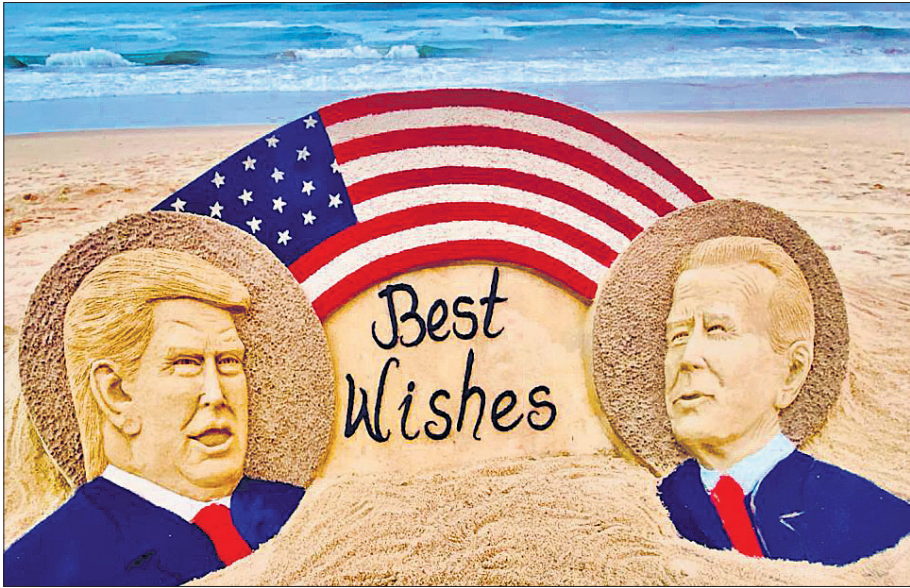
ଆମେରିକା ରାଷ୍ଟ୍ରପତି ନିର୍ବାଚନରେ ପ୍ରାର୍ଥୀ ହୋଇଥିବା ଡୋନାଲ୍ଡ ଟ୍ରମ୍ପ ଏବଂ ଜୋ ବାଇଡେନ୍‌ଙ୍କୁ ଶୁଭେଚ୍ଛା ଜଣାଇ ମଙ୍ଗଳାଂଚନା ପୂରା ବୋଲିଥିବା ବିଜେପିର ପ୍ରକାଶନ ଫୁଲ୍‌ବ୍ଲୋଗ୍ ସ୍ୱଦର୍ଶନ ପତ୍ତନାୟକଙ୍କ ବାଲୁକା କଳା।

ବିଭାଗକୁ ହସ୍ତାନ୍ତର କରିବା ପାଇଁ ସହକାରୀ ଉଦ୍ୟାନ ନିର୍ଦ୍ଦେଶକଙ୍କୁ ଠିକ୍ କରିଛନ୍ତି। ବର୍ତ୍ତମାନ ଏହି ସମଗ୍ର ଜମିକୁ ରାଜ୍ୟ ସରକାର ବ୍ୟବସାୟିକ ପ୍ରତିଷ୍ଠାନ ହାତରେ ଶାନ୍ତପୁର ମୁଲ୍ୟରେ ଚେକ ଦେବା ଲାଗି ଚଳାନ୍ତ କରିଛନ୍ତି।