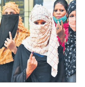
ବୁଆଦିଲ୍ଲା, ୩୧୧୧ (ପି.ଡି.)

ବିହାରରେ ଦ୍ଵିତୀୟ ପର୍ଯ୍ୟାୟ ଭୋଟ ଶେଷ ୫୩.୫୧% ମତଦାନ