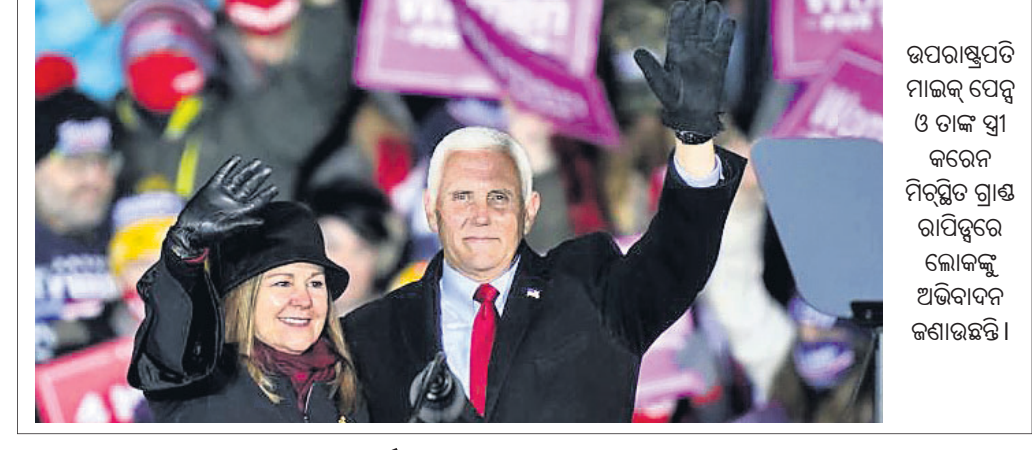
ଉପରାଷ୍ଟ୍ରପତି ମାଇକ୍ ପେନ୍ସ ଓ ତାଙ୍କ ସ୍ତ୍ରୀ କରେନ ମିଡ଼୍‌ଲିନ୍ ଗ୍ରାଣ୍ଡ ରାପିଡ୍‌ସ୍ରେ ଲୋକଙ୍କୁ ଅଭିବାଦନ ଜଣାଉଛନ୍ତି।

ଫ୍ଲୋରିଡ଼ା: ରାଷ୍ଟ୍ରପତି ନିର୍ବାଚନ ଫଳାଫଳ ଯାହା ହେଉନା କାହିଁକି ଭାରତ ସହ ଆମେରିକାର ସମ୍ପର୍କ ସୁଦୃଢ଼ ରହିବ ବୋଲି ଆଶା କରାଯାଉଛି। ଉଭୟ ପ୍ରାର୍ଥୀଙ୍କ ନୀତି ଲଗାହାର ଓ ପ୍ରଚାର ସମୟର ମତବ୍ୟରୁ ଏହା ସ୍ପଷ୍ଟ ହୋଇଛି। ତୋନାଲ୍ଡ ଟ୍ରମ୍ପ୍ଙ୍କ ପ୍ରଥମ ପର୍ଯ୍ୟାୟ ରାଷ୍ଟ୍ରପତିତ୍ଵ ସମୟରେ ହାଇଲ୍ ହାଇସ୍ ଭାରତ ଶେଷ୍ଟ ବନ୍ଧୁର ପରିଚୟ ପାଇଥିଲା। ପ୍ରଧାନମନ୍ତ୍ରୀ ନରେନ୍ଦ୍ର ମୋଦିଙ୍କ ସହ ତାଙ୍କର ବନ୍ଧୁତା ଓ ସମ୍ପର୍କ ଏକ ନୂତନ ସ୍ତରରେ ପହଞ୍ଚିଥିଲା। ଉଭୟ ନେତା ଆମେରିକା ଓ ଭାରତରେ ଦୁଇଟି ରାଲିରେ ଏକାଠି ଉଦ୍‌ଘାଟନା ଦେଇ ପରସ୍ପରକୁ ଉଚ୍ଚ ପ୍ରଶଂସା କରିଥିଲେ। ଆମେରିକାରେ ଡେମୋକ୍ରାଟିକ୍ ରାଷ୍ଟ୍ରପତି ପ୍ରାର୍ଥୀ କୋ ବାଲଭେନ୍ ମଧ୍ୟ ସିନେଟର ଥିବା ସମୟରୁ ଭାରତ ସହ ଆମେରିକାର ଦୃଢ଼ ସମ୍ପର୍କ ଦାବି କରିଆସିଛନ୍ତି। ଭାରତ-ଆମେରିକା ବ୍ୟବସାୟିକ ଅଣୁ ଚୁକ୍ତିଠାରୁ ଆରମ୍ଭ କରି ୫୦୦ ବିଲିୟନ ଡଲାର ଦ୍ଵିପକ୍ଷୀୟ ବାଣିଜ୍ୟ ଲକ୍ଷ ଧାର୍ଯ୍ୟ କରିବା ପର୍ଯ୍ୟନ୍ତ ବାଲଭେନ୍ଙ୍କର ପ୍ରମୁଖ ଭୂମିକା ଥିଲା। ବହୁସଂଖ୍ୟାରେ ଭାରତୀୟ-ଆମେରିକୀୟ ସହିତ ତାଙ୍କର ଘନିଷ୍ଟତା ରହିଛି। ଭାରତ ଓ ଆମେରିକା ସ୍ଵାଭାବିକ ସହଯୋଗୀ ବୋଲି ଲୁଲାଇରେ ପାଣି ସଂଗ୍ରହ ବେଳେ ବାଲଭେନ୍ କହିଥିଲେ।