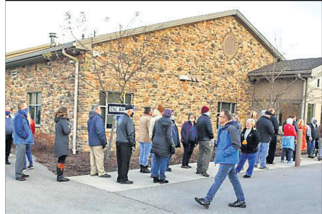
ଜ୍ୟାକ୍‌ସନ ଗାର୍ଡନିୟାନ୍ ପ୍ୟାନିସିପାଲ ବିଲ୍ଡିଂରେ ଭୋଟ ଦେବା ପାଇଁ ମତଦାତା ଧାଡ଼ି ବାନ୍ଧି ଛିଡ଼ା ହୋଇଛନ୍ତି।

ସମ୍ପିଧାନ ଅନୁଯାୟୀ ଆମେରିକାରେ କମ୍ପିଟ ନାଗରିକ ଯାହାଙ୍କୁ ୩୫ ବର୍ଷ ହୋଇଥିବ ଓ ଅନ୍ୟ ୧୪ ବର୍ଷ ଆମେରିକାରେ ରହିଥିବେ, ସେ ରାଷ୍ଟ୍ରପତି ପଦ ପାଇଁ ପ୍ରାର୍ଥୀ ହୋଇପାରିବେ। ଏଥର ପ୍ରାର୍ଥୀ ଦାୟିତ୍ଵରେ ୧୦୦୦ରୁ ଅଧିକ ସାମିଲ ହୋଇଥିଲେ ହେ ଶେଷରେ ରିପବ୍ଲିକାନ ପାର୍ଟିରୁ ତୋନାଲ୍ଡ ଟ୍ରମ୍ପ୍ ଏବଂ ଡେମୋକ୍ରାଟିକ୍ ପାର୍ଟିରୁ କୋ ବାଲଭେନ୍ଙ୍କ ନାମ ଚୁଡ଼ାନ୍ତ ହୋଇଥିଲା। ଫୁଲ୍ ବୃହତ୍ ଦଳ ପ୍ରତିନିଧିତ୍ଵ ପ୍ରକ୍ରିୟା ପ୍ରାକ୍‌ମେରି ମାଧ୍ୟମରେ ରାଷ୍ଟ୍ରପତି ପ୍ରାର୍ଥୀ ଚୁଡ଼ାନ୍ତ କରିଥାନ୍ତି। ପ୍ରାକ୍‌ମେରି ହେଉଛି ରାଜ୍ୟସ୍ତରୀୟ ପରୋକ୍ଷ ନିର୍ବାଚନ ଯେଉଁଠି ଆଖଣ୍ଡମାନେ ପ୍ରାର୍ଥୀ ହେବା ପାଇଁ ଲଢ଼ିଥାନ୍ତି। ପ୍ରାକ୍‌ମେରି ଶେଷ ହେବା ପରେ ଦଳର ଜାତୀୟ କନ୍ଵେନ୍ସନରେ ପ୍ରତିନିଧିମାନେ ଏକାଠି ହୋଇ ପ୍ରାର୍ଥୀ ଚୟନ କରିଥାନ୍ତି। ସେଠାରେ ୧୮ ବର୍ଷରୁ ଉର୍ଦ୍ଧ୍ୱ ବ୍ୟକ୍ତିଙ୍କୁ ଭୋଟଦାନ ଅଧିକାର ମିଳିଥାଏ। ତେବେ କେତେକ ରାଜ୍ୟରେ ବନ୍ଦୀମାନଙ୍କୁ ଭୋଟ ଅଧିକାର ମିଳି ନ ଥାଏ। ସେହିପରି ପୁରୁଣା ରିକୋ ଭଳି କେତେକ ଆମେରିକୀୟ ଅଞ୍ଚଳର ବାସିନ୍ଦା ଦେଶର ନାଗରିକ ହୋଇଥିଲେ ହେଁ ସେମାନେ ରାଷ୍ଟ୍ରପତି ନିର୍ବାଚନରେ ଅଂଶଗ୍ରହଣ କରିପାରନ୍ତି ନାହିଁ।