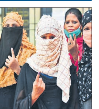
ବୁଧାବିଳା, ୩୧୧ (ପି.ଟି.)

ବିହାର ବିଧାନସଭାର ୯୪ ଆସନ ଲାଗି ମଙ୍ଗଳବାର ଭୋଟଗ୍ରହଣ ଶେଷ ହୋଇଛି। ଏହି ପର୍ଯ୍ୟାୟରେ ମତଦାନ ହାର ୫୩.୫୧ ପ୍ରତିଶତ ରେକର୍ଡ ହୋଇଥିବା ନିର୍ବାଚନ କମିଶନଙ୍କ ପକ୍ଷରୁ ଜଣାଯାଇଛି। ୨୦୧୫ ନିର୍ବାଚନରେ ଏହିସବୁ ଆସନରେ ମତଦାନ ହାର ୫୫.୩୫ ପ୍ରତିଶତ ଥିଲା। ଦ୍ୱିତୀୟ ପର୍ଯ୍ୟାୟରେ ୧,୪୫୦ରୁ ଅଧିକ ପ୍ରାର୍ଥୀ ପ୍ରତିଦ୍ୱନ୍ଦ୍ୱିତା କରୁଥିବାବେଳେ ସେମାନଙ୍କ ମଧ୍ୟରେ ଆରକ୍ଷିତ ନେତା ତଥା ମହାମୋକ୍ଷର ମୁଖ୍ୟମନ୍ତ୍ରୀ ପ୍ରାର୍ଥୀ ତେଜସ୍ୱୀ ଯାଦବ ଅଛନ୍ତି।