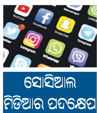
ସୋସିଆଲ ମିଡ଼ିଆର ପଦକ୍ଷେପ

ଆମେରିକା ରାଷ୍ଟ୍ରପତି ନିର୍ବାଚନରେ ସୋସିଆଲ ମିଡ଼ିଆ ପ୍ଲାଟଫର୍ମର ଗୁରୁତ୍ଵପୂର୍ଣ୍ଣ ଭୂମିକା ରହିଥାଏ। ଭୋଟଗ୍ରହଣଠାରୁ ଭୋଟଗଣତି ପର୍ଯ୍ୟନ୍ତ ସୋସିଆଲ ମିଡ଼ିଆରେ ବିଭିନ୍ନ ମିଛ ଖବର ମଧ୍ୟ ପ୍ରକାଶ ପାଇଥାଏ। ଫଳରେ ନିର୍ବାଚନ ବାତାବରଣ ନଷ୍ଟ ହେବା ସହ ହିଂସା ଉତ୍ପତ୍ତି ଆଶଙ୍କା ରହିଥାଏ। ଏଭଳି ମିଛ ଖବର ଉପରେ ଅଜ୍ଞାତ ଲୋକଙ୍କୁ ଲାଗି ମେସେଜ୍ ଆପ୍, ସର୍ଚ୍ଚ ଇଣ୍ଡିକ୍ସ, ଫେସ୍‌ବୁକ୍, ଇନ୍‌ଷ୍ଟାଗ୍ରାମ୍, ଟୁଇଟ୍ଟର ଆଦି ସୋସିଆଲ ମିଡ଼ିଆ ପ୍ଲାଟଫର୍ମଗୁଡ଼ିକ ଯୋଜନା ପ୍ରସ୍ତୁତ କରିଛନ୍ତି। ନିର୍ବାଚନ ସମ୍ପର୍କିତ କିଛି ମିଛ ଖବର ପଠାଗଲେ ଏନେଇ ଫେସ୍‌ବୁକ୍, ଇନ୍‌ଷ୍ଟାଗ୍ରାମ୍ ସୁଇଚ୍‌କୁ ସତର୍କ କରାଯାଇବାର ବ୍ୟବସ୍ଥା କରାଯାଇଛି। ଟୁଇଟ୍ଟର ମଧ୍ୟ ମିଛ ଖବର ସମ୍ପର୍କରେ ଅବଗତ କରାଯାଇ ସହ ସତର୍କ କରିବ। ଟୁଇଟ୍ଟର ଏବଂ ଟିକ୍‌ଟକ୍ ୨୦୧୯ ଅକ୍ଟୋବରରୁ ରାଜନୈତିକ ବିଜ୍ଞାପନକୁ ନିଷିଦ୍ଧ କରିସାରିଛନ୍ତି। ସ୍ଵାସ୍ଥ୍ୟପ୍ରତି