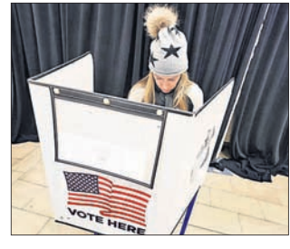
ହୋଇଥିବାରୁ ସେଠାରୁ ୩ ଜଣ ଇଲେକ୍ଟର ରହିଥାନ୍ତି। ହାରାହାରି ଭାବେ ଦେଖିଲେ ନିର୍ବାଚନ ଦିନରେ ଗୋଟିଏ ଇଲେକ୍ଟୋରାଲ ଭୋଟ ୬,୧୦,୦୦୦ ଭୋଟରଙ୍କ ପ୍ରତିନିଧିତ୍ଵ କରିଥାଏ। ତେଣୁ

ଆମେରିକା ରାଷ୍ଟ୍ରପତି ନିର୍ବାଚନରେ ଇଲେକ୍ଟୋରାଲ କଲେଜ ପରୋକ୍ଷରେ ବିଜେତାଙ୍କ ସମ୍ପର୍କରେ ନିଷ୍ପତ୍ତି ନେଇଥାଏ। ନିର୍ବାଚିତ ହେବାକୁ ହେଲେ ମୋଟ ୫୩୮ ଇଲେକ୍ଟୋରାଲ ଭୋଟ ବା ଇଲେକ୍ଟରାଲ ମଧ୍ୟରୁ ଜଣେ ପ୍ରାର୍ଥୀ ୨୭୦ ଭୋଟ ଆବଶ୍ୟକ କରିଥାନ୍ତି। ପ୍ରତି ରାଜ୍ୟରୁ ୨ ଜଣ ସିନେଟର ଏବଂ ଭିନ୍ନ ଭିନ୍ନ ସଂଖ୍ୟକ ପ୍ରତିନିଧି ଇଲେକ୍ଟର ଥାନ୍ତି। ଉଦାହରଣ ସ୍ଵରୂପ କାଲିଫର୍ନିଆ ସବୁଠୁ ଜନବହୁଳ ରାଜ୍ୟ ହୋଇଥିବାରୁ ସେଠାରୁ ୫୫ ଜଣ ଇଲେକ୍ଟର ଏବଂ ଯୋମିଙ୍ଗ ସର୍ବନିମ୍ନ ଜନସଂଖ୍ୟା ବିଶିଷ୍ଟ ହୋଇଥିବାରୁ ସେଠାରୁ ୩ ଜଣ ଇଲେକ୍ଟର ରହିଥାନ୍ତି। ହାରାହାରି ଭାବେ ଦେଖିଲେ ନିର୍ବାଚନ ଦିନରେ ଗୋଟିଏ ଇଲେକ୍ଟୋରାଲ ଭୋଟ ୬,୧୦,୦୦୦ ଭୋଟରଙ୍କ ପ୍ରତିନିଧିତ୍ଵ କରିଥାଏ। ତେଣୁ