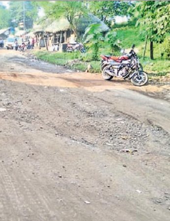
ଦୁଇଆଠାରେ ରାଜପଥକୁ ସଂଯୋଗ ରାସ୍ତା।

ଡେରାବିଶ, ୩୧୧(ସ୍ୱ.ପ୍ର.): ୫୩ ନଂ. ଜାତୀୟ ରାଜପଥର ଚଢ଼ିଶୋଳଠାରୁ ପାରାଦୀପ ଯାଇଥିବା ରାସ୍ତାର ଦୁଇଟି ଏକ ପ୍ରମୁଖ ବଜାର। ଏହା କେନ୍ଦ୍ରାପଡ଼ା ସହରର ପ୍ରବେଶପଥ। ରାଜପଥକୁ କଟକ-ଗାନ୍ଧିବାଲି ରାଜପଥକୁ ସଂଯୋଗ କରୁଥିବା ରାସ୍ତା ଦୀର୍ଘଦିନ ହେଲା ମରଣାନ୍ତ ପାଲଟିଥିଲା। ଏ ନେଇ ଅଭିଯୋଗ ପରେ ମଙ୍ଗଳବାର ଏନ୍‌ଏଚ୍ କର୍ତ୍ତୃପକ୍ଷ ଖାଲଖମା ହୋଇଥିବା ମାଟିକୁ ସମତୁଲ କରି ମରାମତି କାର୍ଯ୍ୟ ଶେଷ କରି ଦେଇଛନ୍ତି। ଏହି ରାସ୍ତାରେ ପାରାଦୀପ ଟେକ ବିଶୋଧନାଗାରରୁ ଶତାଧିକ ସଂଖ୍ୟାରେ ତେଲ ଟ୍ୟାଙ୍କର ସହ ବହୁ ସଂଖ୍ୟାରେ ଭାରୀଯାନ, ବସ୍ ଓ ଟ୍ରକ୍ ଚଳାଚଳ କରେ। କେନ୍ଦ୍ରାପଡ଼ା ସହରକୁ ବାହାରୁ ଆସୁଥିବା ବାଣି ଏହି ରାସ୍ତା ଉପରେ ନିର୍ଭରଶୀଳ।