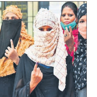
ବୁଆଦିଲ୍ଲା, ୩୧୧୧ (ପି.ଟି.)

ବିହାର ବିଧାନସଭାର ୯୪ ଆସନ ଲାଗି ମଙ୍ଗଳବାର ଭୋଟଗ୍ରହଣ ଶେଷ ହୋଇଛି। ଏହି ପର୍ଯ୍ୟାୟରେ ମତଦାନ ହାର ୫୩.୫୧ ପ୍ରତିଶତ ରେକର୍ଡ୍ ହୋଇଥିବା ନିର୍ବାଚନ କମିଶନଙ୍କ ପକ୍ଷରୁ କୁହାଯାଇଛି। ୨୦୧୫ ନିର୍ବାଚନରେ ଏହିସବୁ ଆସନରେ ମତଦାନ ହାର ୫୫.୩୫ ପ୍ରତିଶତ ଥିଲା। ଦ୍ୱିତୀୟ ପର୍ଯ୍ୟାୟରେ ୧,୪୫୦ରୁ ଅଧିକ ପ୍ରାର୍ଥୀ ପ୍ରତିଦ୍ୱନ୍ଦ୍ୱିତା କରୁଥିବାବେଳେ ସେମାନଙ୍କ ମଧ୍ୟରେ ଆରକ୍ଷିତ ନେତା ତଥା ମହାମେଖର ମୁଖ୍ୟମନ୍ତ୍ରୀ ପ୍ରାର୍ଥୀ ତେଜସ୍ୱୀ ଯାଦବ ଅଛନ୍ତି।