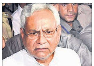
କରିଥିଲେ। ଏନେଇ ମୁଖ୍ୟମନ୍ତ୍ରୀ ବିରକ୍ତ ହୋଇ ଫିଙ୍ଗ, ଆହୁରି ଫିଙ୍ଗ, ଫିଙ୍ଗିବା ଜାରି ରଖି କିନ୍ତୁ କୌଣସି

ପାଟଣା, ୩୧୧୧: ବିହାର ବିଧାନସଭାର ଦ୍ୱିତୀୟ ପର୍ଯ୍ୟାୟ ନିର୍ବାଚନ ପାଇଁ ମଙ୍ଗଳବାର ମତଦାନ ଶେଷ ହୋଇଥିବା ବେଳେ ମୁଖ୍ୟମନ୍ତ୍ରୀ ନୀତୀଶ କୁମାରଙ୍କ ଉପରକୁ ପିଆଜ ମାଡ଼ କରାଯାଇଛି। ମଧୁବଣିର ହରଲାଖୁରେ ଏକ ନିର୍ବାଚନୀ ସଭାରେ ନୀତୀଶ ରାଜ୍ୟର ଯୁବକଙ୍କ ପାଇଁ ନିମୁକ୍ତି ସୃଷ୍ଟି ସମ୍ପର୍କରେ କହିଥିବାବେଳେ ଭିଡ଼ ମଧ୍ୟରେ କେହିକଣେ ପିଆଜମାଡ଼