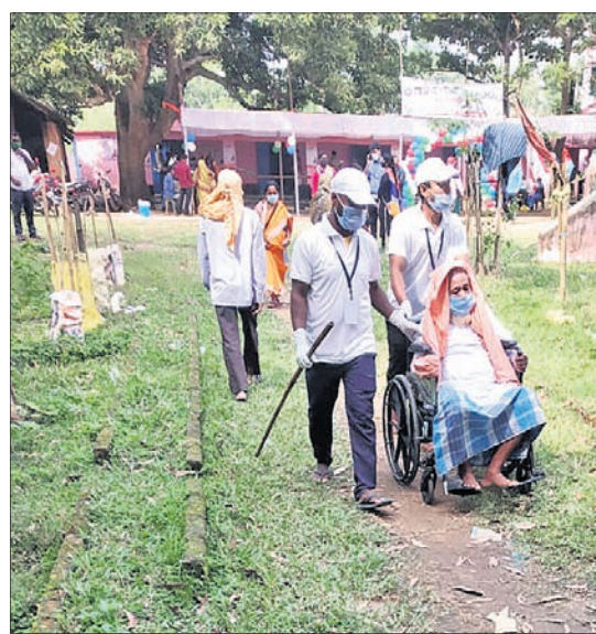
ଗ୍ରାମ ସାଇକେଲରେ ଜଣେ ବୁଢ଼ଙ୍କୁ ମତଦାନ କେନ୍ଦ୍ରକୁ ନିଆଯାଇଛି।