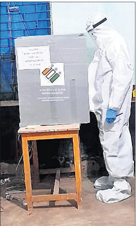
କରୋନା ଆକ୍ରାନ୍ତ ଭୋଟ ଦେଉଛନ୍ତି।

ଉପନିର୍ବାଚନରେ ମୋଟ ୬ ଜଣ କରୋନା ସଂକ୍ରମିତ ମତଦାନ ପାଇଁ ଆଗ୍ରହ ପ୍ରକାଶ କରିବାରୁ ସେମାନଙ୍କୁ ସୁବିଧା ଯୋଗାଇ ଦିଆଯାଇଥିଲା। ସେମାନଙ୍କ ମଧ୍ୟରୁ ରଘୁନାଥପୁର ବ୍ଲକରୁ ଜଣେ ଓ ବିରିଡ଼ିରୁ ୫ ଜଣ ରହିଛନ୍ତି। ଅପରାହ୍ଣ ୫ରୁ ୬ଟା ଭିତରେ ପୂର୍ଣ୍ଣ ସୁରକ୍ଷା ମଧ୍ୟରେ ସେମାନେ ଭୋଟଦାନ କେନ୍ଦ୍ରରେ ପହଞ୍ଚି ମତଦାନ କରିଛନ୍ତି। ପାରାଦୀପସ୍ଥିତ କୋଭିଡ୍ ସେକ୍ଟରରୁ ଜଣେ ପିପି କିଏ ପିଆମୁଲ୍ଲୀ ଯୋଗେ ମତଦାନ କେନ୍ଦ୍ରରେ ପହଞ୍ଚିଥିଲେ। ଅନ୍ୟ ୫ ଜଣ ହୋମ୍ ଆଇସୋଲେସନ୍ରେ ଥିବାରୁ ସେମାନଙ୍କୁ ମାସ୍କ, ଗ୍ଲୋବ୍ ଆଦି ପିନ୍ଧାଯାଇ ଗାଡ଼ିଯୋଗେ ମତଦାନ କେନ୍ଦ୍ରକୁ ନିଆଯାଇଥିଲା। ଏହା ପୂର୍ବରୁ ମତଦାନ କେନ୍ଦ୍ରରେ ପ୍ରକାଶିତ ଅଧିକାରୀଙ୍କ ସହ ପୋଲିଂ କର୍ମଚାରୀ, ଆଶାକର୍ମୀ ପିପି କିଏ ପ୍ରସ୍ତୁତ ରହିଥିଲେ।