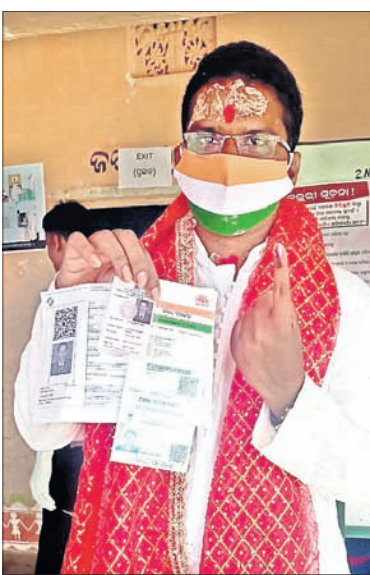
ଭୋଟ ଦେଇ ଫେରୁଛନ୍ତି ଏମ୍ପି ରାଜଶ୍ରୀ ମଲିକ ଏବଂ କଂଗ୍ରେସ ପ୍ରାର୍ଥୀ ହିମାଂଶୁ ମଲିକ।