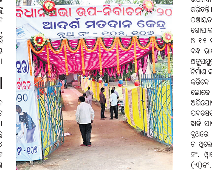
ଆଦର୍ଶ ଭୋଟ ଦାନ କେନ୍ଦ୍ର।

ନିର୍ବାଚନ କମିଶନଙ୍କ ନିର୍ଦ୍ଦେଶ ଅନୁସାରେ ତିର୍ତ୍ତୋଲ ବିଧାନସଭା ନିର୍ବାଚନ ମଣ୍ଡଳୀର ତିର୍ତ୍ତୋଲ, ବିରିଡ଼ି ଓ ରଘୁନାଥପୁର ବ୍ଲକରେ ୫ଟି ଲେଖାଏ ଆଦର୍ଶ ବୁଥ କରାଯାଇଥିଲା। ଏହି ବୁଥଗୁଡ଼ିକରେ ଭୋଟରଙ୍କ ପାଇଁ ସ୍ୱଚ୍ଛ ସୁବିଧା ସୁଯୋଗ କରାଯାଇଥିଲା।