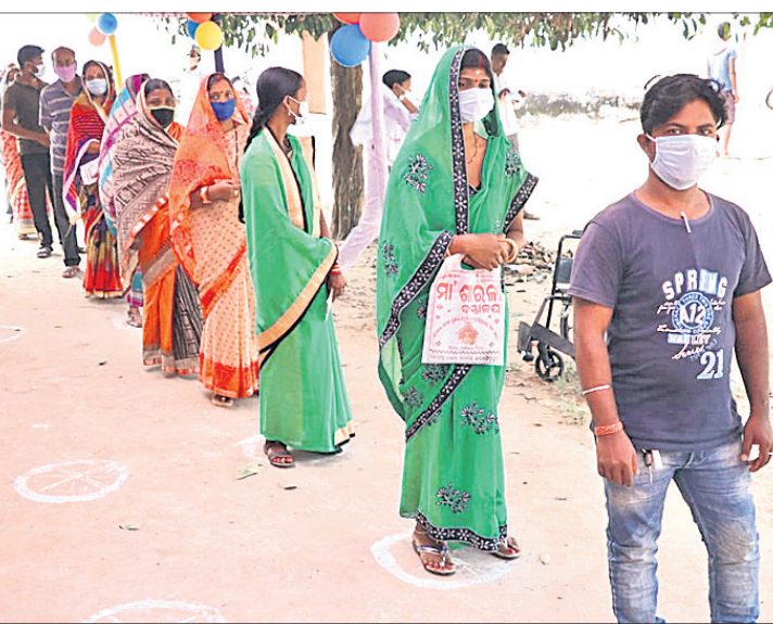
ମତଦାନ ପାଇଁ ଭୋଟର ଲାଇନରେ ଠିଆ ହୋଇଛନ୍ତି।