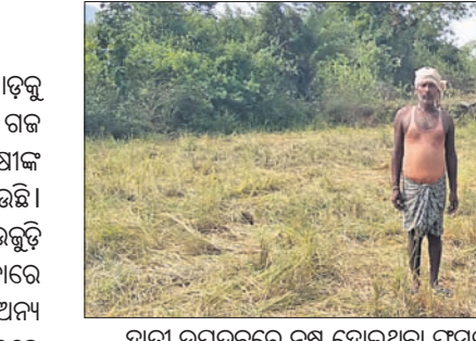
ହାତୀ ଉପଦ୍ରବରେ ନଷ୍ଟ ହୋଇଥିବା ଫସଲ।

ଜଙ୍ଗଲ ଛାଡ଼ି ଜନବସତି ଆଡ଼କୁ ମୁହାଁଇଛନ୍ତି ହାତୀ। ଗାଈ ଜମିରେ ଗଜ ଉପଦ୍ରବ ରାତିକ ଭିତରେ ଗାଈଙ୍କ ବର୍ଷକ ଆଶାକୁ ଧ୍ୱଂସିତ କରିଦେଇଛି। ଆଖି ଆଗରେ ସୁନାର ଫସଲ ଉଡ଼ୁଡ଼ି ଯାଉଥିବାବେଳେ ବିଲ୍ ହୁଡ଼ାରେ ନିରୁପାୟ ହୋଇ ଚାହିଁ ରହିବା ଛଡ଼ା ଅନ୍ୟ କିଛି ପଛ ନାହିଁ। କରୋନା ମାଡ଼ରେ ଶୋଚନୀୟ ହୋଇପଡ଼ିଥିବା ଆର୍ଥିକସ୍ଥିତି ସୁଧାରିବାକୁ ଗାଈକୁ ମାଧ୍ୟମ କରିଥିଲେ ଗାଈ। ଧାରକରଜ କରି ସବୁ ସମ୍ଭଳ ଲଗାଇଥିଲେ ଫସଲରେ। ହେଲେ ହାତୀଙ୍କ ଉପାଦ୍ରବ ସେମାନଙ୍କ ମୁଣ୍ଡରେ ଚଢ଼କ ପକାଇଛି। ତେଜାନାଳ ସଦର ବନଖଣ୍ଡ ଆଧୀନ ଭାପୁର ବନାଞ୍ଚଳ ବସୁଆ ହାତୀଙ୍କ ନୂଆ ଠିକଣା ପାଇଛି। ୧୦ବର୍ଷ ତଳେ ଏହି ଅଞ୍ଚଳ ହାତୀମୁକ୍ତ ଥିଲା। ଏବେ ଅଧିକ ଅଞ୍ଚଳକୁ ପଶି ଆସୁଥିବା ହାତୀପଲ ଦିନେ ବୁଲୁଥିବା ଭିତରେ ନିଜର ଆବାସସ୍ଥଳୀକୁ