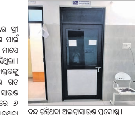
ବନ୍ଦ ରହିଥିବା ଅଲଗା-ଅଲଗା ପ୍ରକୋଷ୍ଠ।