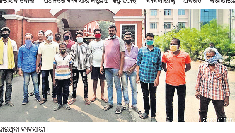
ଉପଜିଲ୍ଲାପାଳଙ୍କ ଦ୍ୱାରସ୍ଥ ହୋଇଥିବା ବ୍ୟବସାୟୀ।

ଅନୁଗୋଳ ସହରରୁ ପୁଣି ଜବରଦଖଲ ଉଦ୍ଧୃତ କାର୍ଯ୍ୟ ଶନିବାରଠାରୁ ଆରମ୍ଭ ହେବ। ଏ ନେଇ ପୌରପ୍ରଶାସନ ପକ୍ଷରୁ ଶୁକ୍ରବାର ସହରରେ ପ୍ରଚାର କରାଯାଇଛି। ଅନୁଗୋଳ ବ୍ୟସ୍ତାଭ୍ୟନ୍ତର ଶନିକିପଡ଼ା ପର୍ଯ୍ୟନ୍ତ କବରଦଖଲରେ ଥିବା ଦୋକାନକୁ ଉଦ୍ଧୃତ କରାଯିବ ବୋଲି