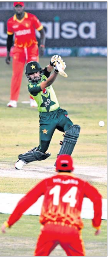
କରମ ଗର୍ଗର ଖର୍ଚ୍ଚ ଖେଳୁଛନ୍ତି ବାବର ଆକାମ।

ପାକିସ୍ତାନ ବିଜୟ ପ୍ରଥମ ଟି୨୦ରେ ପାକିସ୍ତାନ ବିଜୟ ହୋଇଛି।