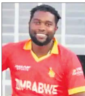
୨୫ ବର୍ଷୀୟ ଚିଗୁମୁରା ଟାକ ବିଦାୟକାଳୀନ ଭିତ୍ତିକ ପୂର୍ବରୁ ୧୪ ଟେଷ୍ଟ, ୧୧୩ ଅନ୍ତର୍ଜାତୀୟ ଦିନିକିଆ ଏବଂ ୫୪ ଅନ୍ତର୍ଜାତୀୟ ଟି୨୦ ଖେଳିଆସିଛନ୍ତି।

ଅବସର ନେବେ ଏଲଟନ୍ ଚିଗୁମୁରା ଏଲଟନ୍ ଚିଗୁମୁରା ଅବସର ନେବେ ବୋଲି ଘୋଷଣା କରିଛନ୍ତି।