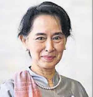
ଫ୍ଲାଗିଂଗନ, ୮ ୧୧୧

ଆମେରିକାବାସୀ ଅସତ୍ୟକୁ ପାଇକି କରି ସତ୍ୟକୁ ବିକଶା କରାଇଛନ୍ତି। ସେମାନେ ରାଷ୍ଟ୍ରପତି ତୋନାଲ୍ ଟ୍ରମ୍ପକୁ ହରାଇ ଆଣ୍ଡା, ଏକତା ଓ ଶିଷ୍ଟତାକୁ ବାଞ୍ଛିଛନ୍ତି। ଆମେରିକାକୁ ପ୍ରତ୍ୟେକ କ୍ଲିନ୍ ଔଆ ଏକ ସମାଜବାଦୀ ଦେଶ ଭାବେ ଦେଖିବା ବୋଲି ଉପରାଷ୍ଟ୍ରପତି ଭାବେ ନିର୍ବାଚିତ ହେବା ପରେ ତେମାନଙ୍କୁ କମଳା ହାରିବି କହିଛନ୍ତି। ପ୍ରଥମ ଥର ପାଇଁ ଜଣେ ଏସିଆ- ଆମେରିକୀୟ, କୃଷକ ଓ ତଥା ମହିଳା