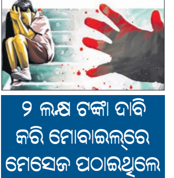
୨ ଲକ୍ଷ ଟଙ୍କା ଦାବି କରି ମୋବାଇଲରେ ଫୋନ୍ ପଠାଇଥିଲେ

ହାର୍ଦ୍ଦୋଇ, ୮ ୧୧୧ (ଆଇଏଏନଏ) ନିଜର ଦୁର୍ଭିକ୍ଷ ଭାଷା ଖାଦ୍ୟ ଯେ ଦିନେ ରାମପ୍ରତାପ ସିଂହୁ ହତ୍ୟା ମାମଲାରେ ଜେଲ୍ ପଠାଇଦେବ ଏକଥା ସେ କେବେ ଦି ଭାବି ନ ଥିଲେ। ଅଢ଼ୋଇ ୨୬ରେ ସେ ତାଙ୍କ ଜେଜେମାଆଙ୍କ ଘର ନିକଟରୁ ୮ ବର୍ଷର ଶିଶୁପୁତ୍ରଙ୍କୁ ଅପହରଣ କରିନେଇ ତାଙ୍କୁ ହତ୍ୟା କରିଥିଲେ। ସେହିଦିନ ସେ ପିଲାଟିର ବାପାଙ୍କ ପାଖକୁ ଏକ ଚୋରି ମୋବାଇଲ୍ ଫୋନ୍ ବାଣ୍ଟି ପଠାଇଥିଲେ। ପୁଅକୁ ଛାଡ଼ିବା ପାଇଁ ସେଥିରେ ସେ ୨ ଲକ୍ଷ