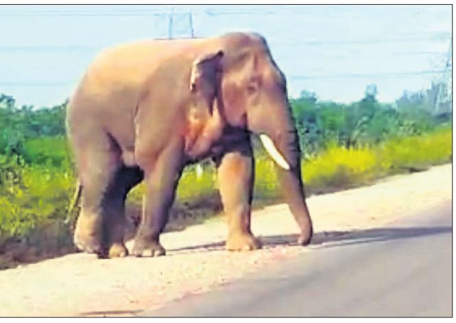
ଖୋର୍ଦ୍ଧା ସହରକୁ ପଶିଆସିଥିବା ହାତୀ

ପାସକ ପରେ ପୁଣି ଖୋର୍ଦ୍ଧା ସହରରେ ପଶିଛି ହାତୀ। ରବିବାର ସନ୍ଧ୍ୟାରେ ପୁରୁଣୁପ୍ରସାଦ ନିକଟରେ ଗୋଟିଏ ହାତୀକୁ ଦେଖି ଅଞ୍ଚଳବାସୀ ଭୟଭୀତ ହୋଇପଡ଼ିଛନ୍ତି। ଖବର ପାଇ ବନ ବିଭାଗ ଓ ପୋଲିସ୍ ପହଞ୍ଚି ଘଡ଼ଢ଼ାଉବାବୁ ହାତୀଟି ସାମନ୍ତରାପୁର ଆଡ଼କୁ ଚାଲିଯାଇଥିଲା। ସାମନ୍ତରାପୁର ଛକ ନିକଟରେ ହାତୀଟି ଛଡ଼ାହୋଇ ରହିବାକୁ ସେହି ରାସ୍ତା ଦେଇ ଯାତାୟାତ ବନ୍ଦ ହୋଇଯାଇଥିଲା। ସୂଚନା ଅନୁଯାୟୀ, ସକାଳେ କୁମାରପୁର କାଳୁ ଜଙ୍ଗଲରେ ହାତୀଟି ବୁଲୁଥିଲା। ସନ୍ଧ୍ୟାରେ ସେ ଖୋର୍ଦ୍ଧା ସହର ଆଡ଼କୁ ପୁହାଇଥିଲା। ରାତି ସାଙ୍ଗେ ୮ଟାରେ ସାମନ୍ତରାପୁର ଛକକୁ ଚାଲି ଆସି ଦୀର୍ଘ ସମୟ ଧରି ଅଟକି ରହିଥିଲା। ଫଳରେ ଲୋକେ ଭୟଭୀତ ହୋଇପଡ଼ିଥିଲେ।