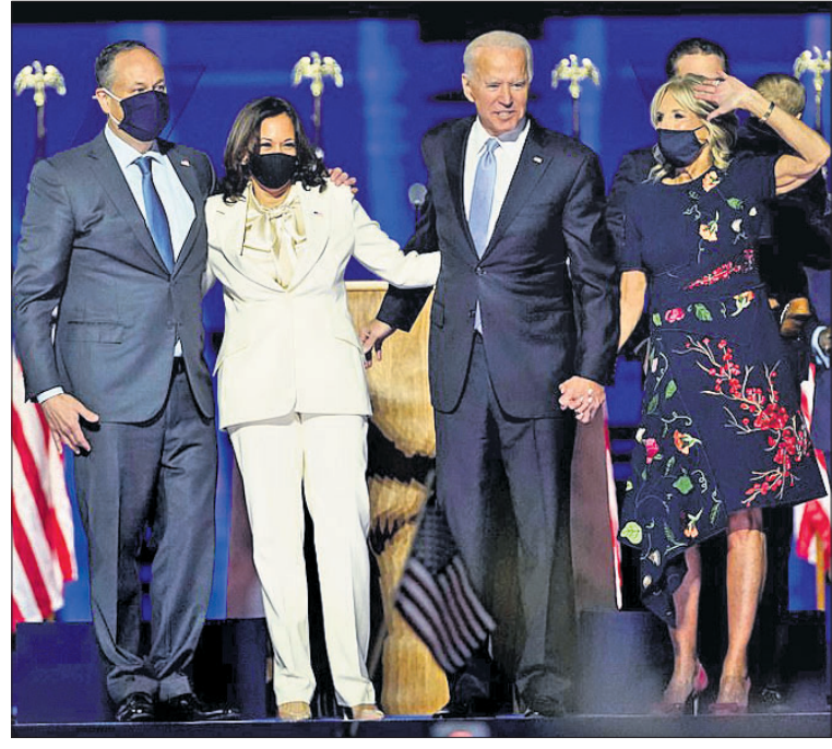
ଆମେରିକାର ଭାବୀ ଉପରାଷ୍ଟ୍ରପତି କମଳା ହାରିସ୍ ଓ ତାଙ୍କ ସ୍ୱାମୀ ଜୋ ବାଇଡେନ ଏମେରିକା ସହ ପ୍ରେସିଡେଣ୍ଟ ଇଲେକ୍ଟ ଜୋ ବାଇଡେନ ଏବଂ ତାଙ୍କ ସ୍ତ୍ରୀ ଜିଲ୍।