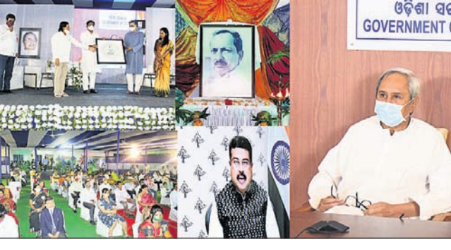
ଜୟନ୍ତୀ ସମାରୋହରେ ମୁଖ୍ୟମନ୍ତ୍ରୀ ନବୀନ ପଟ୍ଟନାୟକ ଓ ଅନ୍ୟମାନେ।