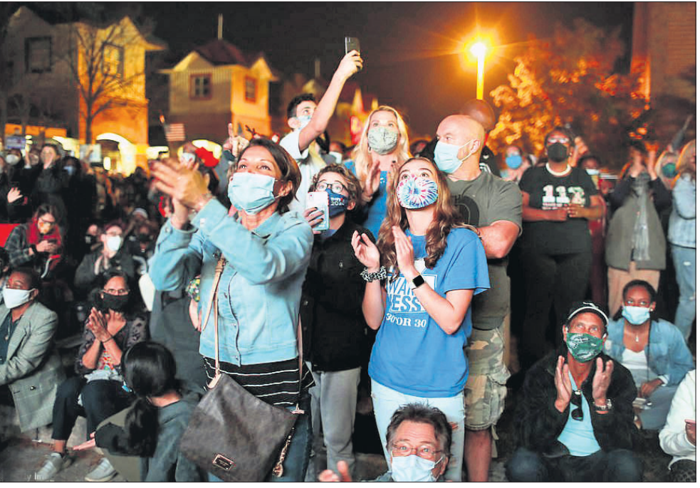
ଭାବୀ ରାଷ୍ଟ୍ରପତି ଜୋ ବାଇଡେନ ଜାତି ଉଦ୍ଦେଶ୍ୟରେ ସମୋଧନ କରିବା ପୂର୍ବରୁ ତାଙ୍କ ସମର୍ଥକମାନେ ତେମ୍ପେରେ ଅପେକ୍ଷା କରିଛନ୍ତି।

ଫ୍ଲାଗିଂଗନ, ୮ ୧୧୧ ଉପରାଷ୍ଟ୍ରପତି ଭାବେ ନିର୍ବାଚିତ ହେବା ପରେ ଶନିବାର ରାତିରେ ତେଲାଡ୍ରେନିଡ଼ିଟ ଫ୍ଲିମିଂଗନରେ ତେମ୍ପେରେ କମଳା ହାରିସ୍ ଜାତି ଉଦ୍ଦେଶ୍ୟରେ ସମୋଧନ କରିଛନ୍ତି। ସେ କହିଛନ୍ତି, ଆମେରିକାରେ ମହିଳାଙ୍କୁ ଭୋଟ ପାଇବା ପାଇଁ ୧୦୦ ବର୍ଷ ଧରି ସଂଗ୍ରାମ କରିବାକୁ ପଡ଼ିଛି। ସେମାନଙ୍କ ମଧ୍ୟରେ ଥିବା କୃଷକମାନଙ୍କ ଉପରାଷ୍ଟ୍ରପତି ଭାବେ ନିର୍ବାଚିତ ହେବା ପରେ ତେମାନଙ୍କୁ କମଳା ହାରିବି କହିଛନ୍ତି। ପ୍ରଥମ ଥର ପାଇଁ ଜଣେ ଏସିଆ- ଆମେରିକୀୟ, କୃଷକ ଓ ତଥା ମହିଳା