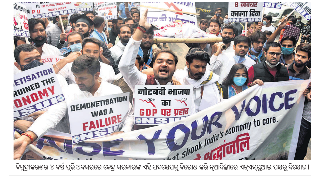
ବିପ୍ରମାଦନର ୪ ବର୍ଷ ପୂର୍ତ୍ତି ଅବସରରେ କେନ୍ଦ୍ର ସରକାରଙ୍କ ଏହି ପଦକ୍ଷେପକୁ ବିରୋଧ କରି ନୂଆଦିଲ୍ଲୀରେ ଏହି ସମ୍ବନ୍ଧରେ ପ୍ରତିନିଧିତା ଚଳାଉଛନ୍ତି।