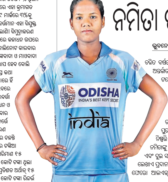
ଭୁବନେଶ୍ୱର, ୮୧୧ (କ୍ରୀଡ଼ା ପ୍ରତିନିଧି)