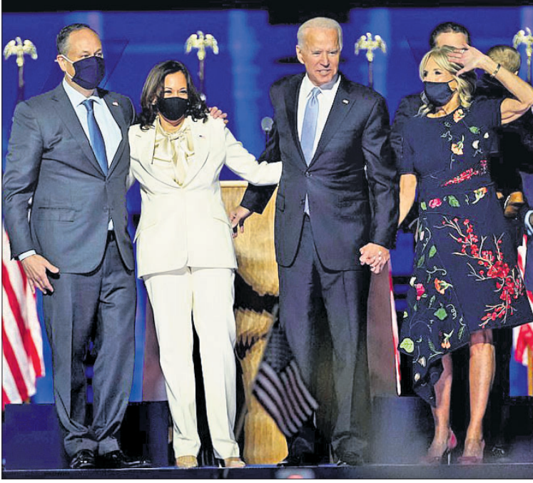
ଆମେରିକାର ଭାବୀ ଉପରାଷ୍ଟ୍ରପତି କମଳା ହାରିସ୍ ଓ ତାଙ୍କ ସାଥୀ ତୋଭର୍ ଏନହୋପ୍ସ୍କ ସହ ପ୍ରେସିଡେଣ୍ଟ ଇଲେକ୍ଟ ଜୋ ବାଇଡେନ୍ ଏବଂ ତାଙ୍କ ସ୍ତ୍ରୀ ଜିଲ୍।