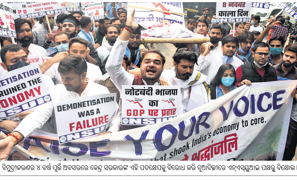
ବିପ୍ରତୀକରଣର ୪ ବର୍ଷ ପୂର୍ତ୍ତି ଅବସରରେ କେନ୍ଦ୍ର ସରକାରଙ୍କ ଏହି ପଦକ୍ଷେପକୁ ବିରୋଧ କରି ନୂଆଦିଲ୍ଲୀରେ ଏକ ସମ୍ବନ୍ଧୀୟ ପକ୍ଷରୁ ବିରୋଧ।

୨ ଲକ୍ଷ ଟଙ୍କା ଦାବି କରି ମୋବାଇଲ୍ରେ ଫେସେକ ପଠାଇଥିଲେ ଟଙ୍କା ଦାବି କରିଥିଲେ ବୋଲି ହାର୍ବର୍ଡ୍ ଏସ୍ପି କହିଛନ୍ତି। ପରେ ଫୋନ୍ ସୁଇଚ୍