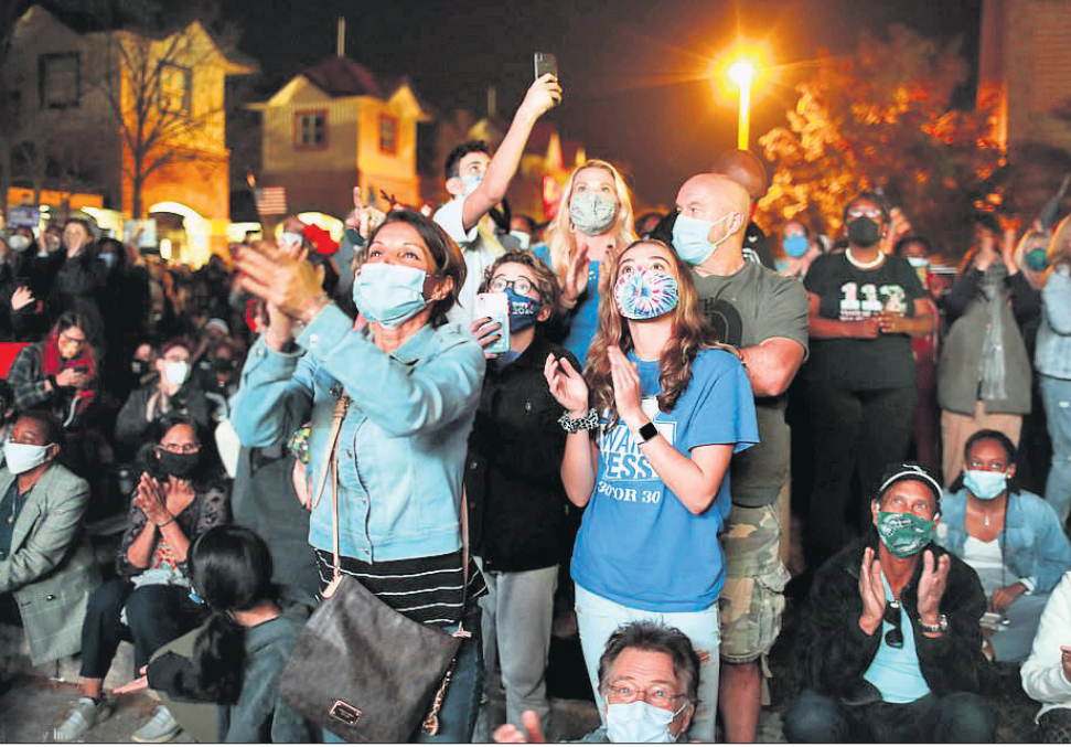
ଭାବୀ ରାଷ୍ଟ୍ରପତି ଜୋ ବାଇଡେନ୍ ଜାତି ଉଦ୍ଦେଶ୍ୟରେ ସମୋ୍ଥନ କରିବା ପୂର୍ବରୁ ତାଙ୍କ ସମର୍ଥକମାନେ ତେସ୍ ସେଣ୍ଟରରେ ଅପେକ୍ଷା କରିଛନ୍ତି।

ଫ୍ଲୋରିଡା, ୮୧୧୧ ଆମେରିକାବାସୀ ଅସତ୍ୟକୁ ପରାଜିତ କରି ସତ୍ୟକୁ ବିଜୟୀ କରାଇଛନ୍ତି। ସେମାନେ ରାଷ୍ଟ୍ରପତି ତୋନାଲ୍ଡ ଟ୍ରମ୍ପଙ୍କୁ ହରାଇ ଆଶା, ଏକତା ଓ ଶିଷ୍ଟତାକୁ ବାଛିଛନ୍ତି। ଆମେରିକାକୁ ପ୍ରତ୍ୟେକ କ୍ଲିନ୍ ଓଡ଼ିଆ ଏକ ସମାଜବାଦୀ ଦେଶ ଭାବେ ଦେଖିବା ବୋଲି ଉପରାଷ୍ଟ୍ରପତି ଭାବେ ନିର୍ବାଚିତ ହେବା ପରେ ତେମୋକ୍ରାସି କମଳା ହାରିସ୍ କହିଛନ୍ତି। ପ୍ରଥମ ଥର ପାଇଁ ଜଣେ ଏସୀୟ-ଆମେରିକୀୟ, କୃଷ୍ଣକାୟ ତଥା ମହିଳା