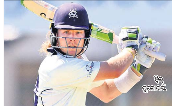
ମେଲବୋର୍ନ, ୯।୧୧