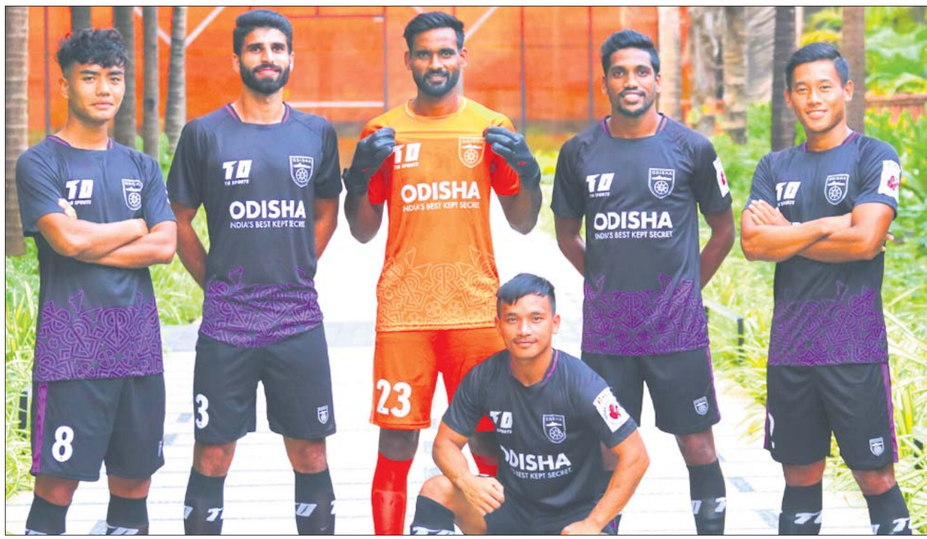
ନୂଆ ଜର୍ସି ସହ ଓଡ଼ିଶା ଏର୍ପିସିର ଖେଳାଳିମାନେ।

ଭୁବନେଶ୍ୱର, ୯।୧୧ (କ୍ରୀଡ଼ା ପ୍ରତିନିଧି) ଚଳିତ ମାସ ୨୦ରୁ ଗୋଆରେ ଆରମ୍ଭ ହେବାକୁ ଯାଉଥିବା ଇଣ୍ଡିଆନ୍ ସୁପରଲିଗ୍ (ଆଇଏସଏଲ୍)ର ସପ୍ତମ ସଂସ୍କରଣ ପାଇଁ ସୋମବାର ଭୁବନେଶ୍ୱର ଭିଜିଟି ପ୍ରାଣ୍ଟିଆଙ୍କ ଓଡ଼ିଶା ଏର୍ପିସି ଜର୍ସି ଉନ୍ମୋଚିତ ହୋଇଛି।