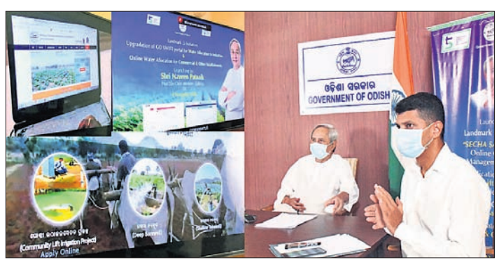
ଜଳ ସମ୍ପଦ ବିଭାଗର ୪ ଅନୁଲାଇନ ସେବାକୁ ସୋମବାର ମୁଖ୍ୟମନ୍ତ୍ରୀ ନବୀନ ପଟ୍ଟନାୟକ ଶୁଭାଚରଣ କରୁଛନ୍ତି।

ଚାଷକାମ ଛାଡ଼ି ଜଳସେଚନ ସମସ୍ୟା ପାଇଁ ଚାଷୀମାନଙ୍କୁ କାର୍ଯ୍ୟକ୍ରମକୁ ବାରମ୍ବାର ଦୌଡ଼ିବାକୁ ପଡ଼ିବ ନାହିଁ। ମୋବାଇଲ୍ ଫୋନ୍‌ରେ ଫଟୋ ଓ ଭିଡିଓ ଜରିଆରେ ଚାଷୀମାନେ ଜଳସେଚନ ସମସ୍ୟା ସମ୍ପର୍କରେ ସିଧା ଜଳସେଚନ ବିଭାଗକୁ ଜଣାଇପାରିବେ।