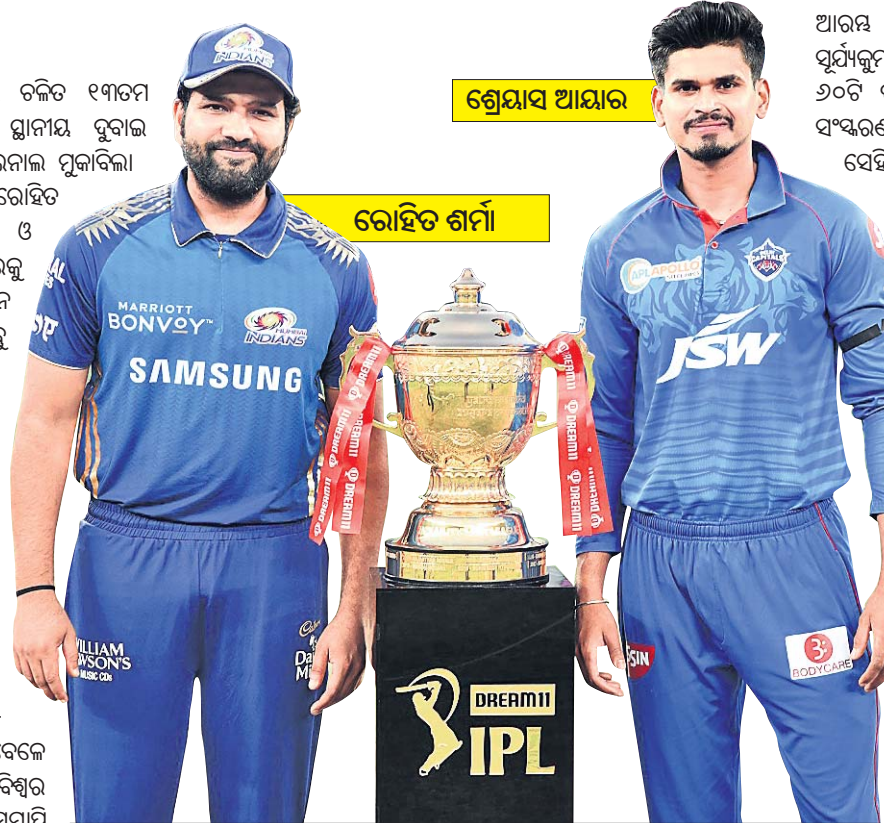
ଆଇପିଏଲ୍ (ମଙ୍ଗଳବାର ମ୍ୟାଚ) ଫାଇନାଲ

ମୁମ୍ବାଇ ଇଣ୍ଡିଆନ୍ସ ବନାମ ଦିଲ୍ଲୀ କ୍ୟାପିଟାଲ୍ସ ପ୍ରସାରଣ: ଦୁବାଇ, ସମୟ: ରାତି ୭ଟା ୩୦ ପ୍ରସାରଣ: ସ୍ଟାର୍ ସ୍ପୋର୍ଟ୍ସ