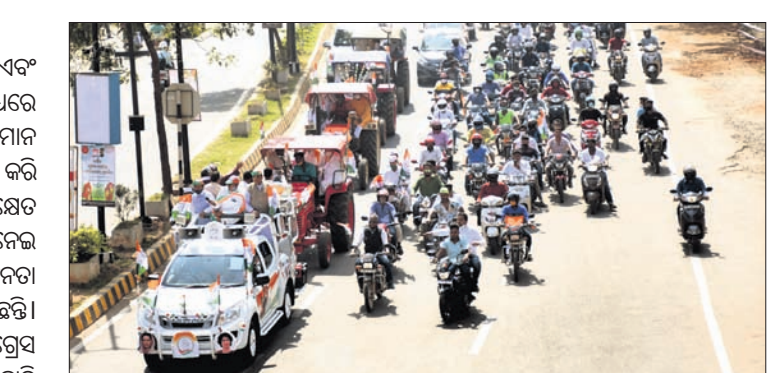
କଂଗ୍ରେସ ପକ୍ଷରୁ ବାହାରିଥିବା ଟ୍ରାଫ୍ଫିକ୍ ରାଲି।

କେନ୍ଦ୍ରର କୃଷି ଆଇନକୁ ପଞ୍ଜୀର ଏବଂ ହରିୟାଣାରେ କୋରଦାର ବିରୋଧରେ ପରେ ଓଡ଼ିଶାରେ ମଧ୍ୟ କଂଗ୍ରେସ ସମାନ ପଦ୍ଧତି ଆପଣାଇଛି। ଏହାକୁ ବିରୋଧ କରି ପ୍ରଦେଶ କଂଗ୍ରେସ କମିଟି ପକ୍ଷରୁ ଶେଷ ପଞ୍ଜୀର ଯାତ୍ରା କରାଯାଇଛି।