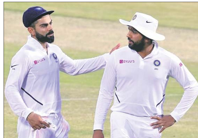
ବିରାଟ କୋହଲି ଓ ରୋହିତ ଶର୍ମା।

ଭାରତୀୟ କ୍ରିକେଟ କଣ୍ଡୋଲି ବୋର୍ଡ (ବିସିଆଇ) ସୋମବାର ଅଧିନାୟକ ବିରାଟ କୋହଲିଙ୍କୁ ପିଚ୍ ଷ୍ଟ୍ରିଟ୍ ମସ୍ତୁର କରିଛି। ଆସକ୍ତା ମାସରେ ଅଷ୍ଟ୍ରେଲିଆ ବିପକ୍ଷ ପ୍ରଥମ ଟେଷ୍ଟ ପରେ ସେ ଷ୍ଟ୍ରିଟ୍ରେ ଯିବେ।