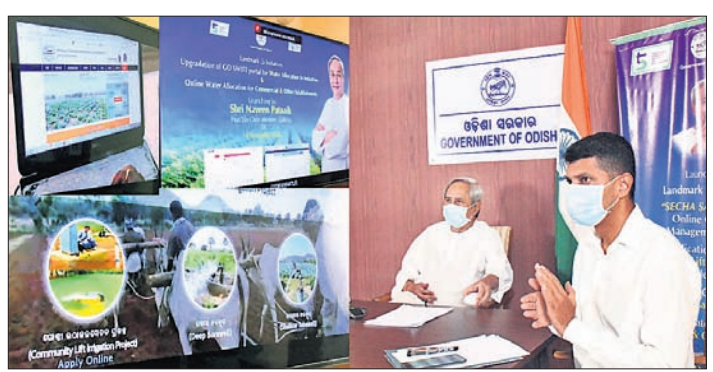
ଜଳ ସମ୍ପଦ ବିଭାଗର ୪ ଅନୁଲାଇନ ସେବାକୁ ସୋମବାର ମୁଖ୍ୟମନ୍ତ୍ରୀ ନବୀନ ପଟ୍ଟନାୟକ ଶୁଭାଭିଷେକ କରୁଛନ୍ତି।

ଚାଷକାମ ଛାଡ଼ି ଜଳସେଚନ ସମସ୍ୟା ପାଇଁ ଚାଷୀମାନଙ୍କୁ କାର୍ଯ୍ୟକ୍ରମକୁ ବାରମ୍ବାର ଦୌଡ଼ିବାକୁ ପଡ଼ିବ ନାହିଁ। ମୋବାଇଲ୍ ଫୋନ୍‌ରେ ଫଟୋ ଓ ଭିଡିଓ ଜରିଆରେ ଚାଷୀମାନେ ଜଳସେଚନ ସମସ୍ୟା ସମ୍ପର୍କରେ ସିଧା ଜଳସେଚନ ବିଭାଗକୁ ଜଣାଇପାରିବେ।