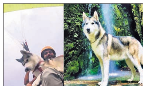
କରିଥିବାର ସମସ୍ତ ପ୍ରମାଣ ସ୍ୱରୂପ ଏକ ଭିଡିଓ ଶେୟାର କରାଯାଇଛି। ନବାବ୍ ୬୫୦୦ ଫୁଟ ଉଚ୍ଚରୁ ପାରାଗ୍ଲାଉଟିଂ