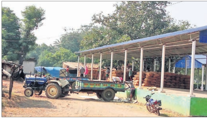
ବିକ୍ରି ପାଇଁ ଆସିଥିବା ଧାନକୁ ବରଗଡ଼ ଜିଲ୍ଲା ଲରସା ମଣ୍ଡିରେ ଅନୁଲୋଚନା କରାଯାଇଛି।

ବରଗଡ଼ ଜିଲ୍ଲାରେ ସୋମବାର ଖରୀଦ ଧାନ ସଂଗ୍ରହ ପ୍ରକ୍ରିୟା ଆରମ୍ଭ ହୋଇଛି। ପ୍ରଶାସନିକ ନିଷ୍ପତ୍ତି କ୍ରମେ ଏଥିପାଇଁ ଜିଲ୍ଲାରେ ୧୮୫ ମଣ୍ଡି ଖୋଲିଛି।