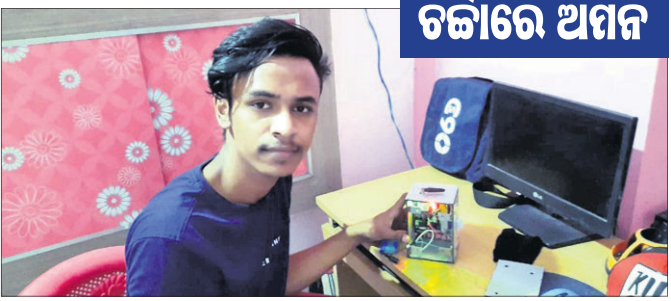
'ପ୍ରାଇଭେଟ୍ ପ୍ଲେସ୍ ସିଲ୍ୟୁରିଟି ଆଲାର୍ମ' ସହ ଅମନ।

ସିସିଡିଭି ପରେ ଲୋକଙ୍କର ସମ୍ପତ୍ତିକୁ ସୁରକ୍ଷା ଦେବା ପାଇଁ ଏକ ବିକଳ ହୋଇପାରେ 'ପ୍ରାଇଭେଟ୍ ପ୍ଲେସ୍ ସିଲ୍ୟୁରିଟି ଆଲାର୍ମ'।