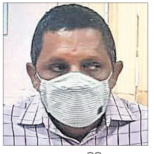
ସହକାରୀ ମନ୍ତ୍ରୀ ବିପିନ ଦାସ।

ବିଲ୍ ପାସ୍ କରାଇଦେବା ପାଇଁ ମଧ୍ୟସ୍ଥା କରାଯାଇଛି ୧୬ ହଜାର ଟଙ୍କା