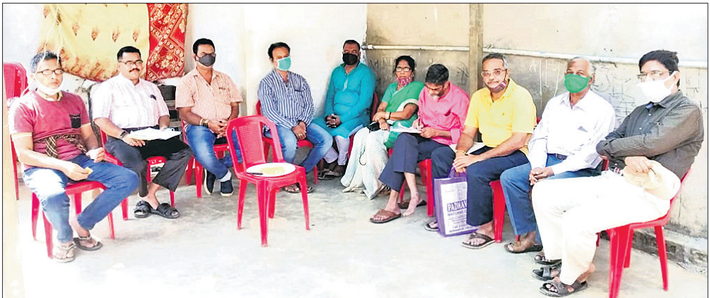
ବୈଠକରେ ଆଲୋଚନା ଚାଲିଛି।

ପାରଳାଖେମୁଣ୍ଡିର ଶ୍ରୀକୃଷ୍ଣଚନ୍ଦ୍ର ଗଜପତି ସ୍ୱୟଂଶାସିତ କଲେଜ ପୁରାତନ ଛାତ୍ର ସଂସଦର ଏକ ବୈଠକ ରବିବାର ଅନୁଷ୍ଠିତ ହୋଇଥିଲା।