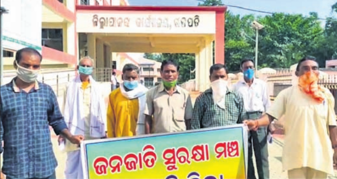
ସ୍ଥାନାନ୍ତରଣ ପ୍ରଦାନ କରିବାକୁ ଆସିଥିବା ମଞ୍ଚର ସଦସ୍ୟ।

ଆଦିବାସୀ ସମ୍ପ୍ରଦାୟର କେତେକ କେନ୍ଦ୍ରରେ ନିଜ ଧର୍ମ ପରିବର୍ତ୍ତନ ଲୋକେ ସ୍ୱଚ୍ଛତାରେ ନିଜ ଧର୍ମ ପରିବର୍ତ୍ତନ କରୁଛନ୍ତି।