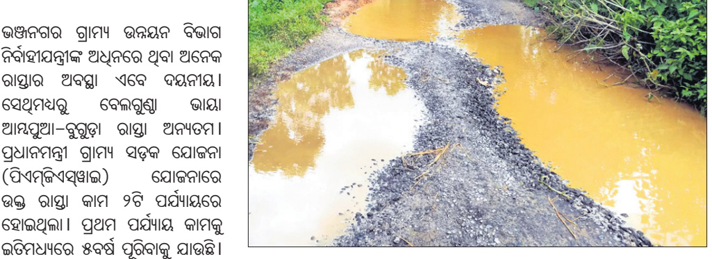
ଆୟତ୍ତୁଆ ଗ୍ରାମ୍ୟ ଭରଣନ ରାସ୍ତା।

ଭଞ୍ଜନଗର ଗ୍ରାମ୍ୟ ଭରଣନ ବିଭାଗ ନିର୍ବାହୀମନ୍ତ୍ରୀଙ୍କ ଅଧିନରେ ଥିବା ଅନେକ ରାସ୍ତାରେ ଅବସ୍ଥା ଏବେ ଦୟନୀୟ।