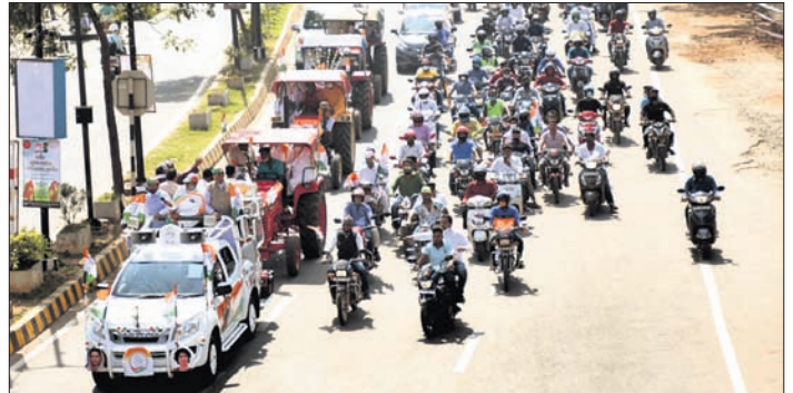
କଂଗ୍ରେସ ପକ୍ଷର ବାହାରିଥିବା ଟ୍ରାକ୍ଟର ରାଲି।

କେନ୍ଦ୍ରର କୃଷି ଆଇନକୁ ପଞ୍ଜୀର ଏବଂ ହରିୟାଣାରେ କୋରଦାର ବିରୋଧରେ ପରେ ଓଡ଼ିଶାରେ ମଧ୍ୟ କଂଗ୍ରେସ ସମାନ ପଦ୍ଧତି ଆରମ୍ଭ କରିଛି।