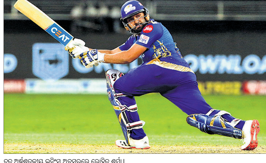
ଭୁଟ ଅର୍ଦ୍ଧଶତକୀୟ ଇନିଂସ ଅବସରରେ ରୋହିତ ଶର୍ମା।

୧୧ ରାଜ୍ୟର ୫୮ ଆସନ ଲାଭ ହୋଇଥିବା ଉପନିର୍ବାଚନରେ ଭାଜପାକୁ ବିପୁଳ ସଫଳତା ମିଳିଛି। ମଧ୍ୟପ୍ରଦେଶ (ଏନ୍‌ଡିଏ)ର ମୋଟ ୨୮ ଆସନରୁ ୧୯, ଗୁଜରାଟର ସମସ୍ତ ୮, ଉତ୍ତରପ୍ରଦେଶ(ୟୁପି)ର ୭ ଆସନରୁ ୬ ଆସନରେ ଭାଜପା ପ୍ରାର୍ଥୀମାନେ ବିଜୟ ହୋଇଛନ୍ତି। ମଧ୍ୟପ୍ରଦେଶରେ ଉପନିର୍ବାଚନ ଫଳାଫଳକୁ ନେଇ ଚଳିତ ଦେଖିବାକୁ ମିଳିଛି। ଏଠାରେ ମୋଟ ୨୮ ଆସନରୁ ଭାଜପାକୁ ୧୯ ଆସନ ମିଳିଛି। କଂଗ୍ରେସ ୯ ଆସନରେ ବିଜୟଲାଭ କରିଛି। ବିଧାନସଭାରେ ଭାଜପାର ୧୦୭ ବିଧାୟକ ଥିବାବେଳେ ଦଳକୁ ଆଉ ମାତ୍ର ୮ ବିଧାୟକଙ୍କ ଆବଶ୍ୟକତା ରହିଥିଲା। ୨୨୯ ଆସନବିଶିଷ୍ଟ ରାଜ୍ୟ ବିଧାନସଭାରେ ସରକାରଙ୍କୁ ୧୧୪ ଆସନ କରୁଛି। ଭାଜପା ଶିବରାଜ୍ ଆସି ପୂର୍ବତନ କଂଗ୍ରେସ ନେତା ଜ୍ୟୋତିରାଦିତ୍ୟ ସିଂହଆ ଗୋଟି ଚାଳନାରେ ସଫଳ ହୋଇଛନ୍ତି। ଫଳାଫଳ ପରେ ଏବେ ପୃଷ୍ଠାମୁଖୀ ଶିବରାଜ୍ ସିଂ ଚୌହାନ ସରକାର ପ୍ରତି ଆଉ କୌଣସି ବିପଦ ପୃଷ୍ଠା-୨