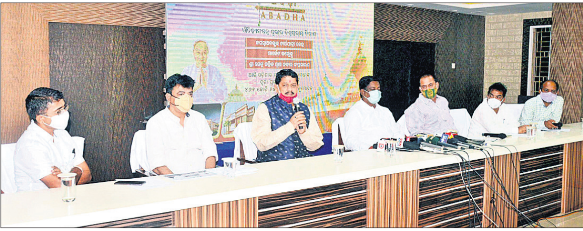
ବୈଠକରେ ମନ୍ତ୍ରୀ ସମୀପ ରଞ୍ଜନ ଦାଶ, ରାଜ୍ୟ ଯୋଜନା ବୋର୍ଡ ଉପାଧ୍ୟକ୍ଷ ସଞ୍ଜୟ ଦାସବର୍ମା ଏବଂ ଅନ୍ୟମାନେ ।