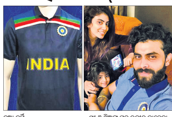
ନୂଆ ଜର୍ସି ସ୍ତ୍ରୀ ଓ ଡିଅକ୍ ସହ ରବୀନ୍ଦ୍ର କାଡେକା

ସିଦ୍ଧାନ୍ତ, ୧୨।୧୧ ଅଷ୍ଟ୍ରେଲିଆ ରୁରରେ ଯାଇଥିବା ଭାରତୀୟ କ୍ରିକେଟ ଦଳ ଗୁରୁବାର ସିଦ୍ଧାନ୍ତରେ ପହଞ୍ଚିଛି। ସିଡନି ଆରମ୍ଭ ପୂର୍ବରୁ ଦଳର ସମସ୍ତ ସଦସ୍ୟ ବାଧ୍ୟତାମୂଳକ ୧୪ ଦିନ କ୍ୱାରାଣ୍ଟାଇନ୍ରେ ରହିବେ। ଦୁଇ ମାସିଆ ରୁର ଅବସରରେ ୩ ମ୍ୟାଚ ବିଶିଷ୍ଟ ଅନ୍ତର୍ଜାତୀୟ ଦିନକିଆ ସିରିଜ ନଭେମ୍ବର ୨୭ରୁ ଆରମ୍ଭ ହେବ। ଏହାଛଡା ସମାନ ସଂଖ୍ୟକ ଅନ୍ତର୍ଜାତୀୟ ଟି୨୦ ଏବଂ ୪ ମ୍ୟାଚ ବିଶିଷ୍ଟ ଟେଷ୍ଟ ସିରିଜ ଖେଳାଯିବ। ଗୋଟିଏ ଟେଷ୍ଟ ମ୍ୟାଚ ଦିବାରାତ୍ର ବିଶିଷ୍ଟ ହେବ। ଏହା ଆଡିଲେଡ ଓଭାଲରେ ଖେଳାଯିବ। ଭାରତ ପ୍ରଥମ ଦିବାରାତ୍ର ଟେଷ୍ଟ ଅଭିଜ୍ଞତା ଲାଭ କରିବ। ସୀମିତ ଓଭର ସିରିଜରେ ଭାରତ ଏକ ନୂଆ ପ୍ରକାର ଜର୍ସି ବ୍ୟବହାର କରିବ। ୭୦ ଦଶକରେ ବ୍ୟବହାର ହେଉଥିବା ଜର୍ସିକୁ ଅନୁକରଣ କରାଯାଇ ଏହା ପ୍ରସ୍ତୁତ କରାଯାଇଛି। ଖେଳାଳିମାନେ କିଛିବର୍ଷ ହେଲା ବ୍ୟବହାର କରି ଆସୁଥିବା ବିବାଦୀୟ ଶ୍ୱାବ ରୁରଙ୍ଗ ପରିବର୍ତ୍ତେ ଏହା ନେଇ ବୁକୁରାଯାଇଛି। ଭାରତୀୟ ଦଳ କ୍ୱାରାଣ୍ଟାଇନ୍ ଅବସରରେ ଅଭ୍ୟାସ କରିବା ପାଇଁ ଅନୁମତି ପାଇଛି।