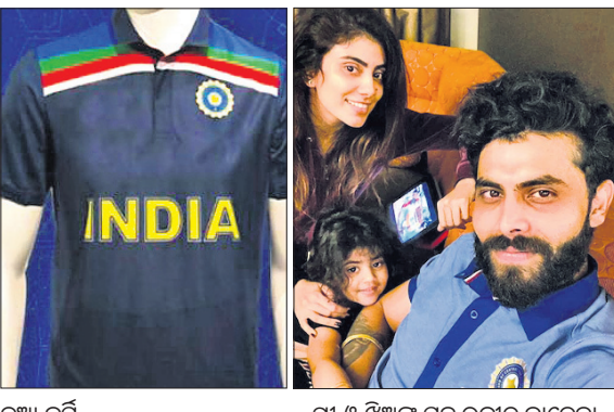
ନୂଆ ଜର୍ସି ସ୍ତ୍ରୀ ଓ ଝିଅଙ୍କ ସହ ରବୀନ୍ଦ୍ର ଜାଡେଜା

ଭିନ୍ନା, ୧୨।୧୧ ଅଷ୍ଟେଲିଆ ରୁରରେ ଯାଇଥିବା ଭାରତୀୟ କ୍ରିକେଟ ଦଳ ଗୁରୁବାର ଭିନ୍ନାଠାରେ ପହଞ୍ଚିଛି। ଭିନ୍ନି ଆରମ୍ଭ ପୂର୍ବରୁ ଦଳର ସମସ୍ତ ସଦସ୍ୟ ବାଧ୍ୟତାମୂଳକ ୧୪ ଦିନ କ୍ୱାରାଣ୍ଟାଇନ୍‌ରେ ରହିବେ। ଦୁଇ ମାସିଆ ରୁର ଅବସରରେ ୩ ମ୍ୟାଚ ବିଶିଷ୍ଟ ଅନ୍ତର୍ଜାତୀୟ ଦିନିକିଆ ଭିନ୍ନି ନଭେମ୍ବର ୨୬ରୁ ଆରମ୍ଭ ହେବ। ଏହାଛଡ଼ା ସମାନ ସଂଖ୍ୟକ ଅନ୍ତର୍ଜାତୀୟ ଟି୨୦ ଏବଂ ୪ ମ୍ୟାଚ ବିଶିଷ୍ଟ ଟେଷ୍ଟ ଭିନ୍ନି ଖେଳାଯିବ। ଗୋଟିଏ ଟେଷ୍ଟ ମ୍ୟାଚ ବିବାହରୁ ବିଶିଷ୍ଟ ହେବ। ଏହା ଆଡିଲେଡ ଓଭାଲରେ ଖେଳାଯିବ। ଭାରତ ପ୍ରଥମ ବିବାହରୁ ଟେଷ୍ଟ ଅଭିଜ୍ଞତା ଲାଭ କରିବ। ସୀନିତ ଓଭର ଭିନ୍ନିରେ ଭାରତ ଏକ ନୂଆ ପ୍ରକାର ଜର୍ସି ବ୍ୟବହାର କରିବ। ୭୦ ଦଶକରେ ବ୍ୟବହାର ହେଉଥିବା ଜର୍ସିକୁ ଅନୁକରଣ କରାଯାଇ ଏହା ପ୍ରସ୍ତୁତ କରାଯାଇଛି। ଖେଳାଳିମାନେ କିଛିବର୍ଷ ହେଲା ବ୍ୟବହାର କରି ଆସୁଥିବା ବିବାହୀୟ ଝାଏ ବୁରଜ ପରିବର୍ତ୍ତେ ଏହା ନେଲି ବୁଜି କରାଯାଇଛି। ଭାରତୀୟ ଦଳ କ୍ୱାରାଣ୍ଟାଇନ୍ ଅବସରରେ ଅଭ୍ୟାସ କରିବା ପାଇଁ ଅନୁମତି ପାଇଛି।