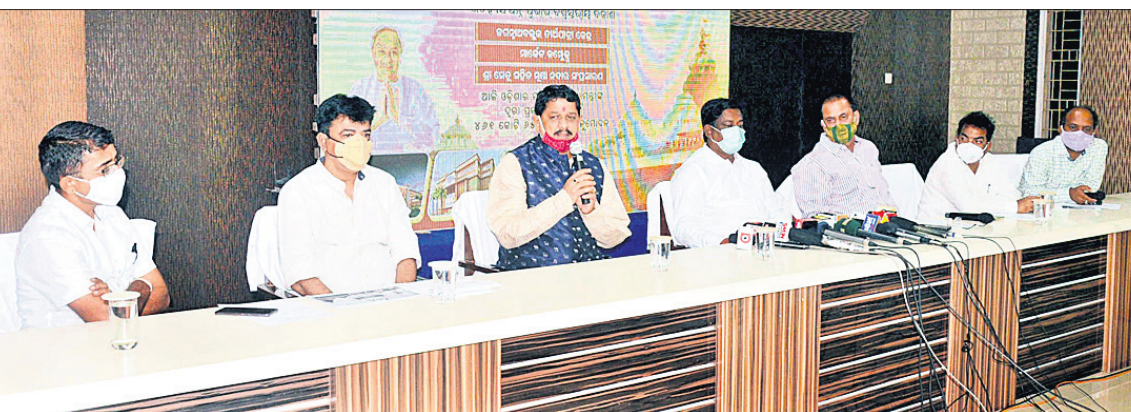
ବୈଠକରେ ମନ୍ତ୍ରୀ ସମୀପ ରଞ୍ଜନ ଦାଶ, ରାଜ୍ୟ ଯୋଜନା ବୋର୍ଡ ଉପାଧ୍ୟକ୍ଷ ସଞ୍ଜୟ ଦାସବର୍ମା ଏବଂ ଅନ୍ୟମାନେ ।

ପୁରୀ ଅଫିସ୍, ୧୨୧୧ ପୁରୀରୁ ବିଶ୍ୱସ୍ତରାୟ ଐତିହ୍ୟ ସହର ଭାବେ ଗଢ଼ାଯିବ ।