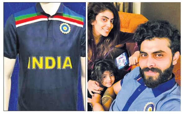
ନୂଆ ଜର୍ସି ସ୍ତ୍ରୀ ଓ ଡିଅକ୍ ସହ ରବୀନ୍ଦ୍ର କାଡେକା