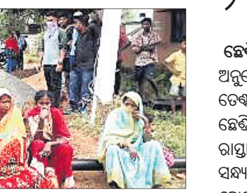
୧୩ନଂ. ଶାନ୍ତ ଅଧୀନ ରାଜମୋହନପୁର ଅଞ୍ଚଳବାସୀ ରାସ୍ତାରେକୋ କରିଛନ୍ତି ।

ହିରୋଲ, ୧୨।୧୧(ଡି.ଏନ.ଏ.) ସ୍ଥଳ ପାନୀୟ ଜଳ ଯୋଗାଣ ଏବଂ ପଞ୍ଚାୟତ ନିର୍ମାଣ ଦାବିରେ ହିରୋଲ ଏନ୍-ଏସ୍ ଅନ୍ତର୍ଗତ ୧୩ନଂ. ଶାନ୍ତ ଅଧୀନ ରାଜମୋହନପୁର ଅଞ୍ଚଳବାସୀ ଗୁରୁତ୍ୱର ରାସ୍ତାକୁ ଓହ୍ଲାଇଛନ୍ତି । ସ୍ଥାନୀୟ ପୋଲିସ୍ ଅଧିକାରୀ ହସ୍ତକ୍ଷେପ ପରେ ଅବରୋଧ ପ୍ରତ୍ୟାହତ ହୋଇଥିଲା । ଜନସାଧାରଣଙ୍କ ଦାବି ଅନୁଯାୟୀ, ଗ୍ରାମକୁ ପଞ୍ଚାୟତ ନାହିଁ । ପାନୀୟ ଜଳଯୋଗାଣ ସ୍ୱପ୍ନ ପାଲଟିଛି । ଏନ୍-ଏସ୍ ରାଜମୋହନପୁର ଅଞ୍ଚଳବାସୀ ଗୁରୁତ୍ୱର ରାସ୍ତାକୁ ଓହ୍ଲାଇଛନ୍ତି । ସ୍ଥାନୀୟ ପୋଲିସ୍ ଅଧିକାରୀ ହସ୍ତକ୍ଷେପ ପରେ ଅବରୋଧ ପ୍ରତ୍ୟାହତ ହୋଇଥିଲା । ଜନସାଧାରଣଙ୍କ ଦାବି ଅନୁଯାୟୀ, ଗ୍ରାମକୁ ପଞ୍ଚାୟତ ନାହିଁ । ପାନୀୟ ଜଳଯୋଗାଣ ସ୍ୱପ୍ନ ପାଲଟିଛି । ଏନ୍-ଏସ୍ ରାଜମୋହନପୁର ଅଞ୍ଚଳବାସୀ ଗୁରୁତ୍ୱର ରାସ୍ତାକୁ ଓହ୍ଲାଇଛନ୍ତି । ସ୍ଥାନୀୟ ପୋଲିସ୍ ଅଧିକାରୀ ହସ୍ତକ୍ଷେପ ପରେ ଅବରୋଧ ପ୍ରତ୍ୟାହତ ହୋଇଥିଲା । ଜନସାଧାରଣଙ୍କ ଦାବି ଅନୁଯାୟୀ, ଗ୍ରାମକୁ ପଞ୍ଚାୟତ ନାହିଁ ।