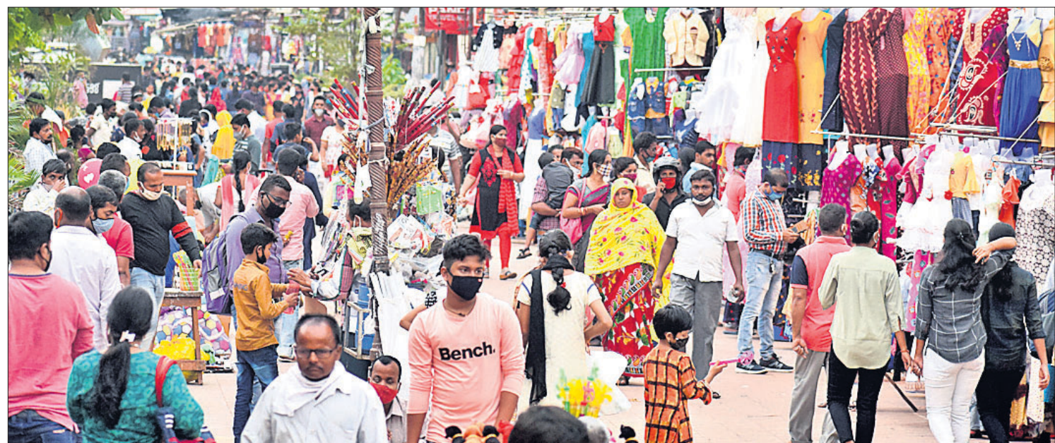
କୋଭିଡ୍ କଟକଣା ଭୁଲିଗଲେ: ଦୀପାବଳିର ଦିନକ ପୂର୍ବରୁ ଗୁରୁବାର ଭୁବନେଶ୍ୱର ଯୁନିଟ୍-୨ ମାର୍କେଟ ବଜାରରେ ଲୋକଙ୍କ ପ୍ରବଳ ଭିଡ଼।