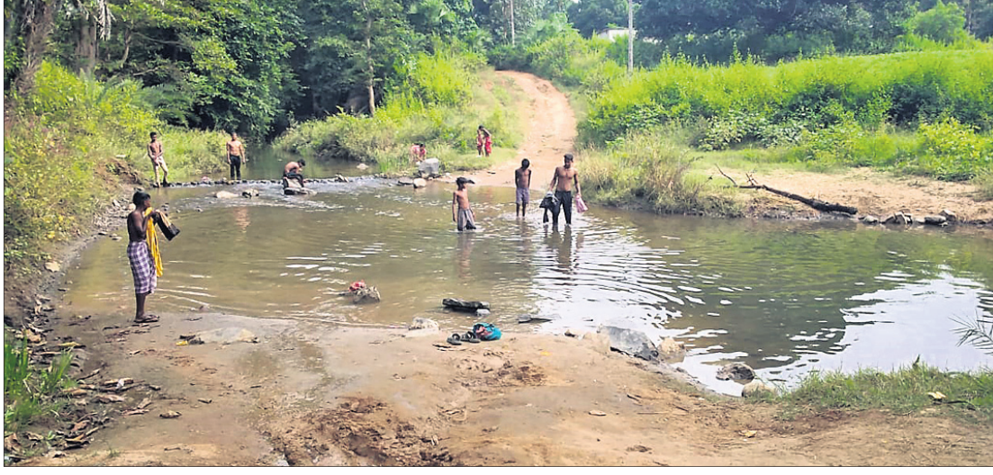
ସାନବୁଲ୍ଲା ପଞ୍ଚାୟତ ଗୁରୁତ୍ୱା-ଯୋଡ଼ାବାହୁଣୀ ରାସ୍ତାରେ ଥିବା ଖଇରାବସା ନାଳ ।

ବଳଶା, ୧୨।୧୧(ଡି.ଏନ.ଏ.) କିଛି ବର୍ଷ ହେଲା ଗାଁର ସହରାକରଣ ଉପରେ ଗୁରୁତ୍ୱ ଦେଉଛନ୍ତି ସରକାର । ସେଥିପାଇଁ ପ୍ରତି ପଞ୍ଚାୟତକୁ ପ୍ରଥମେ ପଞ୍ଚାୟତ ନିର୍ମାଣ କରାଯାଉଛି । ଏଥିସହ ପାଇଁ ପାଣି, ବିଦ୍ୟୁତ୍, ବଜାର ସୁବିଧା ସହ ଇଣ୍ଟରନେଟ୍ ସଂଯୋଗର ପ୍ରୟାସ କରାଯାଉଛି । କିନ୍ତୁ ଅନୁଗୋଳ ଜିଲ୍ଲା ଆଠମଲ୍ଲିକ ବ୍ଲକର ବହୁ ପଞ୍ଚାୟତ ଏ କ୍ଷେତ୍ରରେ ଅବହେଳିତ ଅବସ୍ଥାରେ ରହିଛି । ବିଶେଷକରି ସାନବୁଲ୍ଲା ଓ କୁରୁମଟା ପଞ୍ଚାୟତକୁ ଗମନାଗମନ ବ୍ୟବସ୍ଥା ଏତେ ଶୋଚନୀୟ ଯେ ରାତି ହେଲେ ରାସ୍ତାକୁ ଭୟ କରୁଛନ୍ତି ଲୋକେ ।