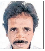
- ସଂସାର ପ୍ରଧାନ, କିଶାନସାହି

ପଞ୍ଚାୟତ ନିର୍ମାଣ ପାଇଁ ବହୁବାର ପଲ୍ଲିସଭାରେ ଦାବି କରାଯାଇଛି । କିନ୍ତୁ ପ୍ରଶାସନିକ ଅଧିକାରୀମାନେ ଦୃଷ୍ଟି ଦେଉନାହାନ୍ତି । ଦିନରେ ବହୁ କଷ୍ଟରେ ଦେଖି ଦାବି ଯିବାସିବା କରୁଛନ୍ତି । ସନ୍ଧ୍ୟା ପରେ ଯାତାୟାତ ଅତି କଷ୍ଟକର ହୋଇପଡ଼ୁଛି ।