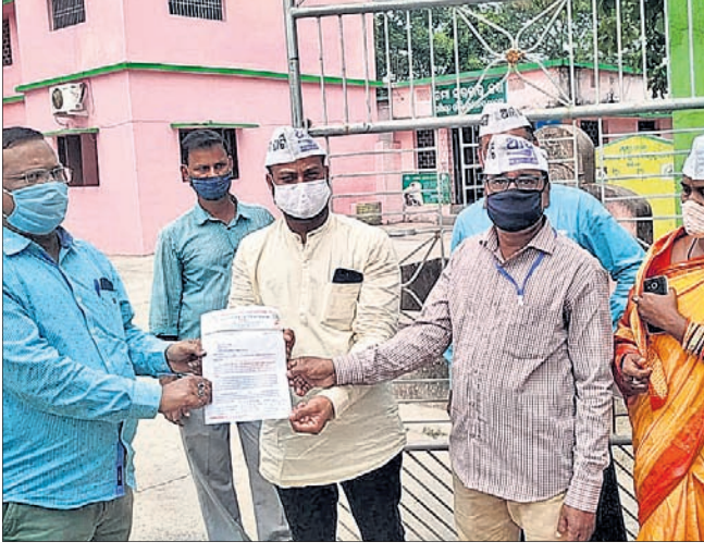
ବିଡିଓଙ୍କୁ ଦାବିପତ୍ର ପ୍ରଦାନ କରାଯାଇଛି ।

ପରଜଙ୍ଗ, ୧୨।୧୧(ଡି.ଏନ.ଏ.) ଅପାରଣ ବିଦ୍ୟୁତ୍ ବିତରଣ କମ୍ପାନୀ ଏବଂ କର୍ମଚାରୀଙ୍କ ବିରୋଧରେ କାର୍ଯ୍ୟାଳୟରୁ ଗ୍ରହଣ କରିବା ବଦଳରେ ସରକାର ଲୋକଙ୍କ ଉପରେ ବୋଧ ଲଦିବାକୁ ଉଦ୍ୟମ କରିଛନ୍ତି । ଏହାକୁ ବିରୋଧ କରି ରହିଛି । ଏହି ପରିସ୍ଥିତିରେ ପ୍ରତ୍ୟାହତ ନ କରାଗଲେ ଆଲୋକନକୁ ଗୁରୁତ୍ୱର ପରଜଙ୍ଗ ବୁକ୍ ଏବଂ ପକ୍ଷରୁ ପଞ୍ଚାୟତ ସମିତି କାର୍ଯ୍ୟାଳୟ ସମ୍ମୁଖରେ ବିରୋଧ ପ୍ରଦର୍ଶନ କରାଯିବ । ବିଭିନ୍ନ ଉଦ୍ଦେଶ୍ୟରେ ବିଡିଓଙ୍କୁ ଆବାହକ ପକ୍ଷ ନାହିଁ, ପୂର୍ଣ୍ଣରାମ ଦାବିପତ୍ର ପ୍ରଦାନ କରାଯାଇଛି । କରୋନା ସମୟରେ ବିଦ୍ୟୁତ୍ ଦର ମୁନିର୍ ବୃଦ୍ଧି ହେବାରୁ ପ୍ରମୁଖ ଦାବିପତ୍ର ପତ୍ରା ୨୦୦୯ରୁ ବୃଦ୍ଧି କରାଯାଇଛି ।