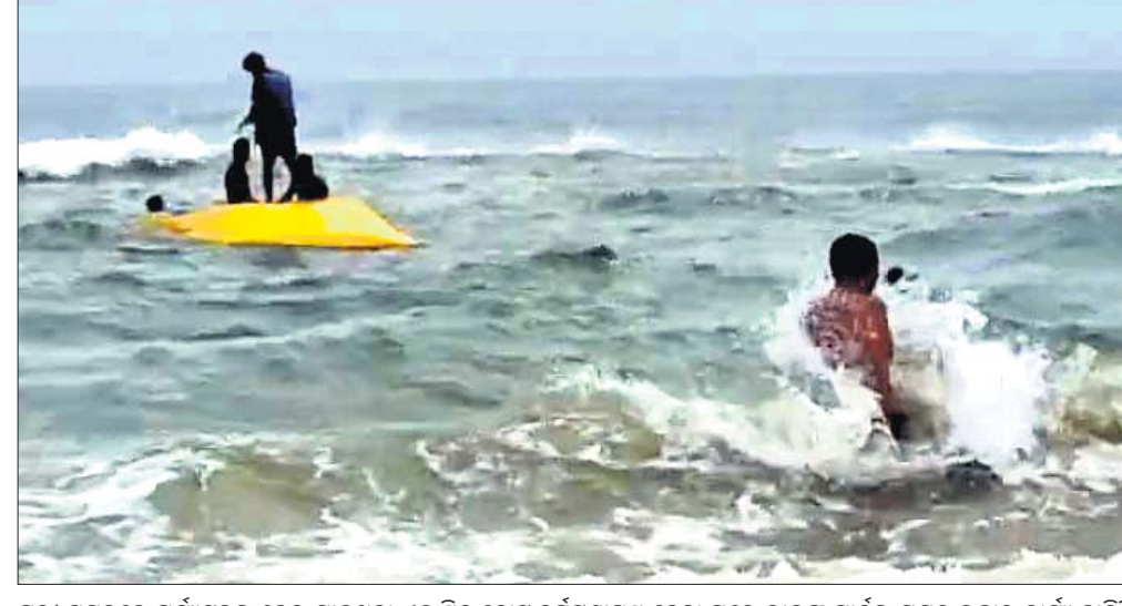
ପୁରୀ ସମୁଦ୍ରରେ ପର୍ଯ୍ୟଟକଙ୍କୁ ନେଇ ଯାଇଥିବା ଏକ ସ୍ନୋ ବୋଟ୍ ଉଲଟିଲା ଯାହାରେ କାର୍ଯ୍ୟକାରୀ ରହିଲା।