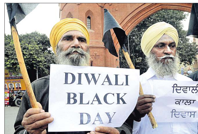
କେନ୍ଦ୍ର ସରକାରଙ୍କ ବିବାଦୀୟ କୃଷି ଆଇନ ବିରୋଧରେ ବିଶୋଳ କରୁଥିବା ଅନୁତସରର ଦାମ୍ପତ୍ୟମାନେ ଏଥର 'କଳା ଦୀପାବଳୀ' ପାଳନ କରିବାକୁ ନିଷ୍ପତ୍ତି ନେଇଛନ୍ତି।

ତେଜସ୍ୱୀ ଜଣେ ଭଲ ପିଲା। କିନ୍ତୁ ସେ ନିର୍ବାଚନ ଜିତି ମୁଖ୍ୟମନ୍ତ୍ରୀ ହୋଇଥିଲେ ବିହାରକୁ ଚଳାଇପାରି ନ ଥାନ୍ତେ ବୋଲି ବରଷା ଭାଜପା ନେତ୍ରୀ ଉମା ଭାରତୀ ତାଙ୍କୁ କହିଛନ୍ତି। ଗଣମାଧ୍ୟମକୁ ଉମା ଭାରତୀ କହିଛନ୍ତି, ଆରଜେଡି ଅଧ୍ୟକ୍ଷ ଲାଲୁ ପ୍ରସାଦ ଯାଦବଙ୍କ କମ୍ପାନୀ ଏପରି ଛୁଟି ଛୁଟି କରିଆଡ଼େ ଯେ ସରକାର ଉପରେ ତେଜସ୍ୱୀଙ୍କ ନିୟନ୍ତ୍ରଣ ରହି ନ ଥାନ୍ତା। ଲାଲୁଙ୍କ ହସ୍ତକ୍ଷେପ ଯୋଗୁ ବିହାରକୁ ପୁଣି କଳକାରାକ ଫେରିଆସିଲା। ମଧ୍ୟପ୍ରଦେଶରେ କମଳାନାଥ ସରକାରରେ କଂଗ୍ରେସ ନେତା ଦିଲ୍‌ବିଜୟ ସିଂଘ ଯୋଗୁ ଯାହା ହେଲା ବିହାରରେ ଠିକ୍ ସେମିତି ଅବସ୍ଥା ହୋଇଆଣ୍ଟା।