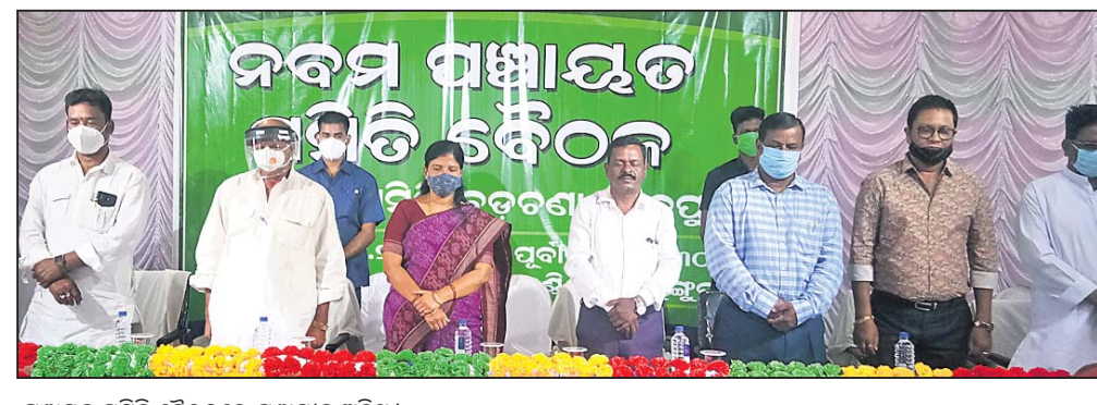
ପଞ୍ଚାୟତ ସମିତି ବୈଠକରେ ମଞ୍ଚାଧୀନ ଅତିଥି।