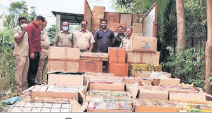
ପୁଣ୍ୟପାଳ ଗ୍ରାମ ନିକଟରେ ଜବତ ବାଣିଜ୍ୟ

ଗଞ୍ଜାମ ଜିଲ୍ଲା ଧରାକୋଟ ଓ ଚମାଖଣ୍ଡି ପୋଲିସ୍ ଥାନାରେ ପୃଥକ ପୃଥକ ଭାବରେ ଚଢ଼ାଇ କରାଯାଇ ବିପୁଳ ପରିମାଣର ବାଣିଜ୍ୟ ଜବତ କରାଯାଇଛି।