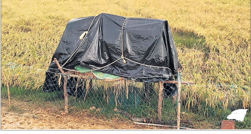
ଜମିରେ ମଞ୍ଚା ବାନ୍ଧି କରାଯାଇଛି।