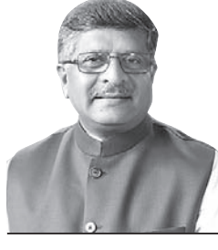
ରବି ଶଙ୍କର ପ୍ରସାଦ

ତିନିଦିନ ଧରି ଲଗାତର ଶେୟାର ବଜାର ଉର୍ଦ୍ଧ୍ୱଗାମୀ ହେବା ପରେ ବୁଧବାର ରେକର୍ଡ଼ ସ୍ତରରେ ପହଞ୍ଚିଥିଲା । ସରକାର ଓ ଶିଳ୍ପଜଗତ ଏଭଳି କିଛି ଗଠନମୂଳକ ପରିବର୍ତ୍ତନ କରିନାହାନ୍ତି ଯେଉଁଥିପାଇଁ ଏହି ବୃଦ୍ଧିକୁ ଆମେ ଯୁକ୍ତିଯୁକ୍ତ ବୋଲି କହିପାରିବା । ବଜାରରେ ଉତ୍ସାହ ଆଣିବା ଲାଗି ସରକାର ଆଶ୍ୱସ୍ତ୍ୟପୂର୍ଣ୍ଣ ପଦକ୍ଷେପ ଗ୍ରହଣ କରିନାହାନ୍ତି । ଭୋଗଭୂତନ ଆମେରିକାରେ ଚାଷପତି ନିର୍ବାଚିତ ହେବା ଘୋଷଣା କରାଯିବା ପରେ ବିଶ୍ୱ ବଜାର ଆଗକୁ ବଢ଼ିଛି । ତାତ୍ପ୍ରତିବନ୍ଧିତା ମଧ୍ୟରେ ଭୋଗଭୂତନ ବିକସା ହୋଇଛି, କିନ୍ତୁ ରାଷ୍ଟ୍ରପତି ତୋନାଲ୍ଡ ଟ୍ରମ୍ପ ଏଯାବତ୍ ଏହାକୁ ସ୍ୱୀକାର କରିନାହାନ୍ତି । ତେବେ ଗତ ସପ୍ତାହରେ ବାଇଡେନ୍‌ଙ୍କ ବିଜୟ ଯୋଗୁ ଭାରତର ଆର୍ଥିକ ନୀତି ଓ ଆମେରିକା ସହ ସମ୍ପର୍କରେ ଉନ୍ନତି ହେବ ବୋଲି ନିବେଶକମାନେ ଭାବିନେଇଛନ୍ତି । ଫଳରେ ବିଶ୍ୱରେ ଶେୟାର ବଜାର ବୃଦ୍ଧି ଘଟିବା ସହ ଭାରତରେ ବି ଏହା ଉର୍ଦ୍ଧ୍ୱଗାମୀ ହୋଇଛି । ଫାର୍ମାସୁଟିକାଲ କମ୍ପାନୀ ବାୟୋଏନ୍‌ଡେକ ଏବଂ ପିପିକର ସେମାନଙ୍କ ତିନି କରୋନା ଭୂତାଣୁ ବିରୋଧରେ ୯୦% କାମ କରୁଛି ବୋଲି ଘୋଷଣା କରିବା ପରେ ବିଶ୍ୱ ବଜାର ଉର୍ଦ୍ଧ୍ୱଗାମୀ ହୋଇଛି । ଏହି ଖବର ଜଣାପଡିବା ପରେ କିଛିଦିନ ହେବ ଭାରତୀୟ ଷ୍ଟକ୍‌ବଜାର ଅଧିକ ଲାଭଦାୟକ ହୋଇଛି । କୋଭିଡ-୧୯ ତିକାର ବୃତ୍ତୀୟ ଯର୍ଯ୍ୟାୟ ସଫଳ ପରୀକ୍ଷଣ ସମ୍ପର୍କରେ ଘୋଷଣା ହେବା ପରେ ନିବେଶକଙ୍କ ମଧ୍ୟରେ ଆତ୍ମ ବିଶ୍ୱାସ ଲାଗି ହୋଇଛି ଏବଂ ନିରନ୍ତର ଆର୍ଥିକ ସୁଧାରର ସମ୍ଭାବନା ଯୋଗୁ ନିବେଶକମାନେ ଶେୟାର କିଣିଛନ୍ତି । ବିହାର ବିଧାନସଭା ନିର୍ବାଚନରେ ଏନ୍‌ଡିଏର ବିଜୟର ବିକସା ମଧ୍ୟ ବଜାରରେ ଉନ୍ନତି ଆଣିବାରେ ସାହାଯ୍ୟ କରିଛି । ଆଇଟି, ଫାର୍ମା ଏବଂ ବ୍ୟାଙ୍କିଙ୍ଗରେ ନିବେଶକମାନେ ସବୁଠୁ ଅଧିକ ଶେୟାର କିଣିଛନ୍ତି । କିନ୍ତୁ ଶେୟାର ବଜାର କ'ଣ ଏହି ଏଭଳି ଉର୍ଦ୍ଧ୍ୱଗାମୀ ରହିବ ନା ପୁଣି ତଳକୁ ଖସିବ ? ରୁଦ୍ଧିବାରେ ଉର୍ଦ୍ଧ୍ୱଗାମୀ ସେନାସେନା ୨୩୫୫ ପଦକ୍ଷେପ ଗ୍ରହଣ କରିବାକୁ ତିନି ଦିନ ୫୮ ପଦକ୍ଷେପ କମିଥିଲା । ଏହା କ'ଣ ନିମ୍ନଗାମୀ ହୋବାର ଅଧ୍ୟୟନ । ମୂଳ ସିଦ୍ଧାନ୍ତରେ ଠୋପ କାରଣ ନଥିବାରୁ , ଏବେ ଦିଶୁଛି ।