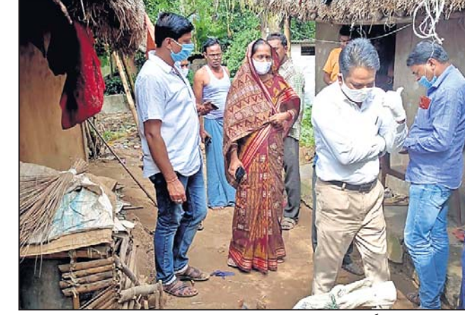
ବିଧାୟକ ଆବାସ ଗୃହ ଶୀଘ୍ର ଶେଷ କରିବାକୁ ହିତାଧିକାରୀଙ୍କୁ ପରାମର୍ଶ ଦେବାକୁ ଯାଉଛନ୍ତି।