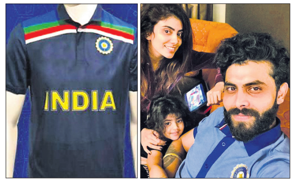
ନୂଆ ଜର୍ସି ଗ୍ରୀ ଓ ବିଅକ୍ ସହ ରବୀନ୍ଦ୍ର ଜାଡେଜା