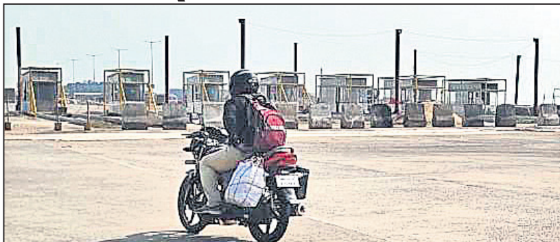
ପ୍ରସ୍ତାବିତ ବନ୍ଦାଳ ଟୋଲ୍‌ପୁଲ୍

ଯାଜପୁର ଅଫିସ୍, ୧୩/୧୧ କାତାୟ ରାଜପଥ ପ୍ରାୟକରଣ କର୍ତ୍ତୃପକ୍ଷ (ଏନ୍‌ଏସ୍‌ଆଇ) ପକ୍ଷରୁ ୨୦୧୭ ଜୁଲାଇରେ ହୋଇଥିବା ନିଷ୍ପତ୍ତି ଅନୁଯାୟୀ ୬ ନମ୍ବର କାତାୟ ରାଜପଥ(ଏନ୍‌ଏସ୍‌ଆଇ)ରେ ଥିବା କଟକ ମୁକ୍ତି ଟୋଲ୍‌ପୁଲ୍‌କୁ ବନ୍ଦାଳ ନିକଟରୁ ସ୍ଥାନାନ୍ତର କାର୍ଯ୍ୟ ପ୍ରାୟ ଶେଷ ହେବାକୁ ବସିଛି। ଅଧିକ ଭଦ୍ରକ ଜିଲ୍ଲା ଆଖୁଆପଦା ନିକଟରୁ ପାଣିକୋଇଲି ଟୋଲ୍‌ପୁଲ୍‌କୁ ସ୍ଥାନାନ୍ତର ନିଷ୍ପତ୍ତି ଏସାଏ କାର୍ଯ୍ୟକାରୀ ହୋଇପାରିନାହିଁ। ବନ୍ଦାଳ ଟୋଲ୍‌ପୁଲ୍‌ କାର୍ଯ୍ୟକାରୀ ହେଲେ ପାଣିକୋଇଲି ଟୋଲ୍‌ପୁଲ୍‌କୁ ଦୂରତା ଆହୁରି ୫ କି.ମି. ହ୍ରାସ ପାଇ ୫୨ କି.ମି.ରୁ ୪୭ କି.ମି. ହେବ, ଯାହାକି ଏନ୍‌ଏସ୍‌ଆଇର ଗାଈଭୋଲ୍‌କରକୁ ଉଲ୍ଲଙ୍ଘନ କରୁଛି। ନିୟମ ଅନୁଯାୟୀ ଗୋଟିଏ