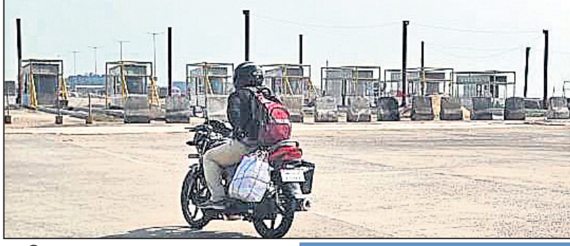
ପ୍ରସ୍ତାବିତ ବନ୍ଦାଳ ଟୋଲ୍‌ପୁଲ୍

ଯାଜପୁର ଅଫିସ୍, ୧୩.୧୧ କାତାୟ ରାଜପଥ ପ୍ରାୟକରଣ କର୍ତ୍ତୃପକ୍ଷ (ଏନ୍‌ଏସ୍‌ଆଇ) ପକ୍ଷରୁ ୨୦୧୭ ଜୁଲାଇରେ ହୋଇଥିବା ନିଷ୍ପତ୍ତି ଅନୁଯାୟୀ ୬ ନମ୍ବର କାତାୟ ରାଜପଥ(ଏନ୍‌ଏସ୍‌ଆଇ)ରେ ଥିବା କଟକ ମୁକ୍ତି ଟୋଲ୍‌ପୁଲ୍‌କୁ ବନ୍ଦାଳ ନିକଟକୁ ସ୍ଥାନାନ୍ତର କାର୍ଯ୍ୟ ପ୍ରାୟ ଶେଷ ହେବାକୁ ବସିଛି। ଅଧିକ ଭଦ୍ରକ ଜିଲ୍ଲା ଆଖୁଆପଦା ନିକଟକୁ ପାଣିକୋଇଲି ଟୋଲ୍‌ପୁଲ୍‌କୁ ସ୍ଥାନାନ୍ତର ନିଷ୍ପତ୍ତି ଏସାଏ କାର୍ଯ୍ୟକାରୀ ହୋଇପାରିନାହିଁ। ବନ୍ଦାଳ ଟୋଲ୍‌ପୁଲ୍‌ କାର୍ଯ୍ୟକାରୀ ହେଲେ ପାଣିକୋଇଲି ଟୋଲ୍‌ପୁଲ୍‌କୁ ଦୂରତା ଆହୁରି ୫ କି.ମି. ହ୍ରାସ ପାଇ ୫୨ କି.ମି.ରୁ ୪୭ କି.ମି. ହେବ, ଯାହାକି ଏନ୍‌ଏସ୍‌ଆଇର ଗାଈଭୋଲ୍‌କରକୁ ଉଲ୍ଲଙ୍ଘନ କରୁଛି। ନିୟମ ଅନୁଯାୟୀ ଗୋଟିଏ