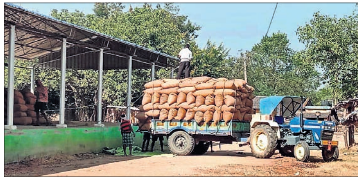
ବରଗଡ଼ ଜିଲ୍ଲା ଖୁଣ୍ଟୁଳିପାଲି ମଣ୍ଡଳ ବିକ୍ରି ପାଇ ଆଣିଥିବା ଧାନକୁ ଓହ୍ଲାଇଛନ୍ତି।

ବରଗଡ଼ ଜିଲ୍ଲାରେ ଗତ ୯ଟାରିଖରୁ ଧାନ କିଣାବିକା ପାଇଁ ମଣ୍ଡଳ ଖୋଲିଛି। ବର୍ତ୍ତମାନ ଖୋଲିଥିବା ମଣ୍ଡଳ ଖୋଲିଛି। ବର୍ତ୍ତମାନ ଖୋଲିଥିବା ମଣ୍ଡଳ ଖୋଲିଛି। ବର୍ତ୍ତମାନ ଖୋଲିଥିବା ମଣ୍ଡଳ ଖୋଲିଛି।