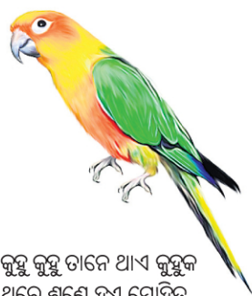
ଉତ୍ତର - ଶୁଆ

(୧)ନାଲି ଅଣ୍ଟା ଚା'ର ଦିଶେ ସୁନ୍ଦର ଦେହରେ ସବୁଜ ରଙ୍ଗ ଚାନ୍ଦର ପୋଷା ମାନିଗଲେ କଥା କୁହଇ ରାମ ରାମ ଦିନ ରାତି କପଇ ।