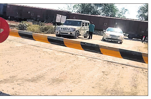
ରେଳ ଫାଟକ ଭିତରେ ଅଟକି ରହିଥିବା ବୋଲେରୋ ଓ କାର।

କିର୍ତ୍ତୀ, ୧୩।୧୧ (ଡି.ଏନ.ଏ.) ଦକ୍ଷିଣ ପୂର୍ବ ରେଳପଥ ପାନପାଳି ଓ ଧୂରତା ରେଳଷ୍ଟେସନ ମଧ୍ୟରେ ଥିବା ଅଲଗାରେ ସିମେଣ୍ଟ କାରଖାନା ସମ୍ପୂର୍ଣ୍ଣ ୨୫୪ ନମ୍ବର ରେଳ ଫାଟକ ନିକଟରେ ଏକ ମାଲବାହୀ ଟ୍ରେନ ଦୁର୍ଘଟଣାକୁ ଅଳ୍ପକେ ରକ୍ଷାପାଇଛି ଏକ ବୋଲେରୋ ଓ କାରା ବହୁ ପଦଯାତ୍ରା ବି ଅଳ୍ପକେ ବର୍ତ୍ତି ଯାଇଛନ୍ତି।