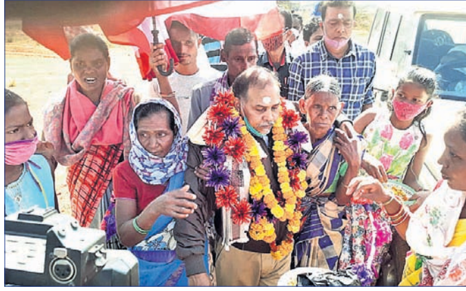
ବିରଜୁ ଗାଁରେ ପହଞ୍ଚିବା ପରେ ଗ୍ରାମବାସୀ ତାଙ୍କୁ ସ୍ୱାଗତ କରୁଛନ୍ତି ।

ଜୁନେଶ୍ୱର, ୧୩।୧୧ (ଭୁବନେଶ୍ୱର): ଦେଶର କେତେକ ରାଜ୍ୟରେ କେନ୍ଦୁପତ୍ରକୁ ସଂଗ୍ରହ କରାଯାଉଛି ଶତ ପ୍ରତିଶତ ତୋଳାଳି ଓ ଶ୍ରମିକଙ୍କ ମଧ୍ୟରେ ଶାନ୍ତି ଦିଆଯାଉଥିବା ବେଳେ ଓଡ଼ିଶା ସରକାର ଲାଭାଂଶର ମାତ୍ର ୨୫ ଭାଗ ବୋନସ ଆକାରରେ ଦେଉଛନ୍ତି । ଏହାପାଇଁ ରାଜ୍ୟର କେନ୍ଦୁପତ୍ର ତୋଳାଳି ଅନେକ କ୍ଷତି ସହ୍ୟ କରୁଛନ୍ତି । ତେଣୁ ରାଜ୍ୟରେ ଥିବା କେନ୍ଦୁପତ୍ର ତୋଳାଳି ଓ ଶ୍ରମିକଙ୍କୁ ଲାଭର ଶତପ୍ରତିଶତ ବୋନସ ଦେବା ଦାବିରେ ଲାଭାଂଶର ପୂର୍ବରୁ ବିଧାନ ସଭା ପ୍ରସ୍ତାବ ପ୍ରସ୍ତାବରେ ନେତୃତ୍ୱରେ ଏକ ପ୍ରତିନିଧି ଦଳ ରାଜ୍ୟ ଜଙ୍ଗଲ ଓ ପରିବେଶ ମନ୍ତ୍ରୀ ଏବଂ ଜଙ୍ଗଲ ବିଭାଗର ପ୍ରମୁଖ ସାଥୀ ସଚିବଙ୍କୁ ଭେଟି ଆଲୋଚନା କରିବା ସହ ଏକ ୯ ଦିନୀ ଦାବିପତ୍ର ପ୍ରଦାନ କରିଛନ୍ତି । ୧୯୭୩ ଗ୍ରାନ୍ତ୍ୟକ୍ରି ଆଇନ ଅନୁଯାୟୀ କେନ୍ଦୁପତ୍ର ସଂଗ୍ରହ କାର୍ଯ୍ୟରେ ସିନିଆଲ କର୍ମଚାରୀଙ୍କ ପ୍ରାଥମ୍ୟ ଦେବା, ୨୦୦୦ ଖିଚରକ୍ତ କରମା ବୃଦ୍ଧି କରିବା ଆଦି ଗୁରୁତ୍ୱପୂର୍ଣ୍ଣ ପ୍ରସଙ୍ଗ ଉପରେ ଆଲୋଚନା କରାଯାଇଥିବା ସୂଚନା ମିଳିଛି ।