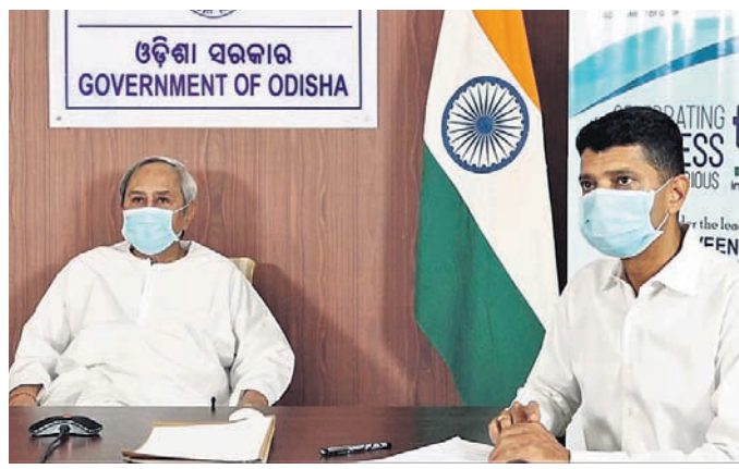
ଭିଡ଼ିଓ କନଫରେନ୍ସରେ ମୁଖ୍ୟମନ୍ତ୍ରୀ ନବୀନ ପଟ୍ଟନାୟକ ଅନୁଲାଇନ ସେବାର ଶୁଭାରମ୍ଭ କରୁଛନ୍ତି। ପାଖରେ ଅଧିକ ମୁଖ୍ୟମନ୍ତ୍ରୀଙ୍କ ସଚିବ (୫-ଟି) ଭି.କେ. ପାଣିଗ୍ରାହୀ।

ସାମଗ୍ରୀ ବିକ୍ରୋଧକ ପାଇଁ ଲାଇସେନ୍ସ ପ୍ରଦାନ କରିବା ସହ ୬ଟି ଅନୁଲାଇନ ସେବା ଏବଂ ଓୟୁଏଟି ଛାତ୍ରାଛାତ୍ରୀଙ୍କ ପାଇଁ ସାର୍ଟିଫିକେଟ୍ ଓ ମାର୍କିଟିଂ ଆଦି ଯୋଗାଇ ଦିଆଯାଇଛି। ସେପ୍ଟେମ୍ବରରେ ୨୨ ଏବଂ ଅକ୍ଟୋବରରେ ୩୮ କର୍ମଚାରୀଙ୍କୁ ସ୍ୱୀକୃତି ପ୍ରଦାନ କରାଯାଇଛି। ୨୦୧୮ରେ ଆରମ୍ଭ ହୋଇଥିବା ଆମ କୃଷି କାର୍ଯ୍ୟକ୍ରମରେ ଚାଷୀଙ୍କୁ ମୋବାଇଲ୍ ଫୋନ୍‌ରେ କୃଷି ପରାମର୍ଶ ସେବା ଦିଆଯାଇଛି। ୨୦୧୮ରେ ୫୦ ହଜାର ଚାଷୀଙ୍କୁ ଧାନ ସହାୟା ସୂଚନା ଦିଆଯାଇଥିଲା।