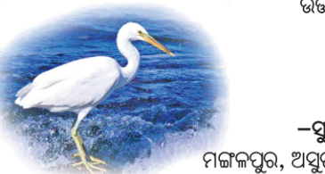
ଉତ୍ତର - ବଗ

(୩)ମୁହଁଠାରୁ ଚା'ର ଅଣ୍ଟି ବଡ଼ ଧୋବ ଫରଫର ସାରା ଶରୀର ଧରିବା ପାଇଁ ସେ ଜଳରେ ମାନ ରଖି ପୁନା ପରି ଏକାଗ୍ର ଚିତ୍ତ ।