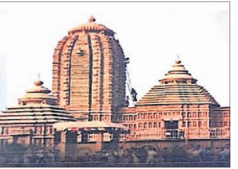
ଆଇଆର୍ସିଟିସି ଓ ଏକ ଫ୍ରେନ୍ଦ୍ ଫୁଣ୍ଡ୍ ସଂସ୍ଥା ପକ୍ଷରୁ ଶ୍ରୀମନ୍ଦିର ଭାବେ ଦର୍ଶାଯାଇଥିବା ଅନ୍ୟ ମନ୍ଦିର।