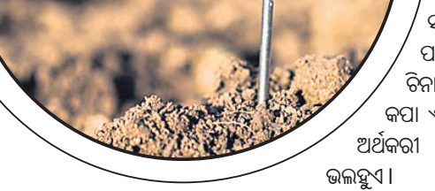
ସବୁ ପ୍ରକାର ଫସଲ ଚାଷ ପାଇଁ ଉପଯୁକ୍ତ। ଆଳୁ, ଚିନାବାଦାମ, ସୋରିଷ, କପା ଏବଂ ଆଖୁ ପରି ଅନେକ ଅର୍ଥକରା ଫସଲ ଏହି ମାଟିରେ ଭଲହୁଏ।

ଚିନିଗୋଟି ମୁଖ୍ୟ ଉପାଦାନ ଯଥା-ବାଲି, ପତ୍ତୁ ଓ କର୍ମମୂଳକେଳ ମାଟି ସୂକ୍ଷ୍ମ। ସବୁ ମାଟିରେ ଏହିପରି ଉପାଦାନ ସମାନ ପରିମାଣରେ ନ ଥାଏ। ପୃଥକ୍ ପୃଥକ୍ ପରିମାଣର ବାଲି, ପତ୍ତୁ ଓ କର୍ମମୂଳ ମିଶ୍ରଣକୁ ନେଇ ଗଠିତ ମାଟିର ବିଭିନ୍ନ ଶ୍ରେଣୀ ବିଭାଜନ କରାଯାଇଛି। ଉକ୍ତ ଶ୍ରେଣୀ ବିଭାଜନ ମାଟିର ବୟାନାମ୍ବକ ବର୍ଗ କୁହାଯାଏ। ବୟାନାମ୍ବକ ବର୍ଗ ମାଟିର ଜଳଧାରଣ ଶକ୍ତି, ଜଳସେଚନର ସମୟ, ଫସଲର କିମ୍ପ, ଜମିର ଚାଷ ପ୍ରଣାଳୀ ଏବଂ ଆନୁମାନିକ ଉର୍ଦ୍ଧରତାର ସୂଚନା ଦେଇଥାଏ। ମୂଳିକା ବିଜ୍ଞାନିକମାନେ ମାଟିର ୮ଟି ବୟାନାମ୍ବକ ବର୍ଗ ନିରୂପଣ କରିଛନ୍ତି। ଚାଷୀ ବିନା ଖର୍ଚ୍ଚରେ ନିଜ ଜମିର ମାଟି କେଉଁ ବୟାନାମ୍ବକ ବର୍ଗର ନିଜ ଅନୁକୂଳିତ କିମ୍ପ ଜାଣିପାରିବେ ତାହାର ପ୍ରଣାଳୀ ନିମ୍ନରେ ସୂଚନା କରାଗଲା। ଚାଷୀ କ୍ଷେତ୍ରକୁ ଯାଇ ଏକ ଧାଳିଆରେ ୪୦ ରୁ ୫୦ ଗ୍ରାମ ପର୍ଯ୍ୟନ୍ତ ଶୁଖିଲା ମାଟି ନେଇ ଏଥିରେ ଅଳ୍ପ ଅଳ୍ପ କରି ପାଣି ମିଶାଇ ପ୍ରଥମେ ଅଳ୍ପକ୍ଷେତ୍ରରେ ପରୀକ୍ଷା ଏହାପରେ ଗୋଟିଏ ଛୋଟ ବାଟି ବା ପେଣ୍ଠ ତିଆରି କରନ୍ତୁ। ମାଟି ଅଳ୍ପକ୍ଷେତ୍ରରେ ଲାଖୁରହୁଛି କି ନାହିଁ ଅନୁଭବ କରନ୍ତୁ ଏବଂ ଶେଷରେ ଏକ ବଳିତା ବା ଚିବନ୍ଦ ତିଆରି କରନ୍ତୁ। ଉକ୍ତ ଚାରିଗୋଟି ଛିଡ଼ିକୁ ନେଇ ମାଟିର ନିମ୍ନ ୮ଗୋଟି ବୟାନାମ୍ବକ ବର୍ଗ ଜାଣିପାରିବେ।