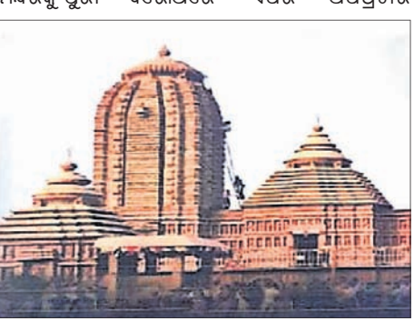
ଆଇଆରସିଟିସି ଏବଂ ୨ ଫ୍ରେବ୍ ଟ୍ୟୁଇ ସଂସ୍ଥା ପକ୍ଷରୁ ଶ୍ରୀମନ୍ଦିର ଭାବେ ଦର୍ଶାଯାଇଥିବା ଅନ୍ୟ ମନ୍ଦିର।