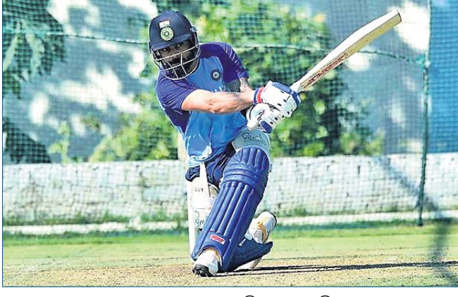
ଅଭ୍ୟାସ ଅବସରରେ ବିରାଟ କୋହଲି

ଅଷ୍ଟ୍ରେଲିଆ ଗସ୍ତରେ ଯାଇଥିବାର ଭାରତୀୟ କ୍ରିକେଟ ଦଳ ପ୍ରଥମେ ସାନିତ ଓଭର କ୍ରିକେଟ ଖେଳିବାର କାର୍ଯ୍ୟକ୍ରମ ରହିଛି। ତେବେ ବିରାଟ କୋହଲିଙ୍କ ନେତୃତ୍ୱରେ ଭାରତୀୟ ଦଳ ଆସନ୍ତା ମାସରେ ଖେଳାଯିବାକୁ ଥିବା ଅଷ୍ଟ୍ରେଲିଆ ବିପକ୍ଷ ଚେଷ୍ଟା ସିରିଜ୍