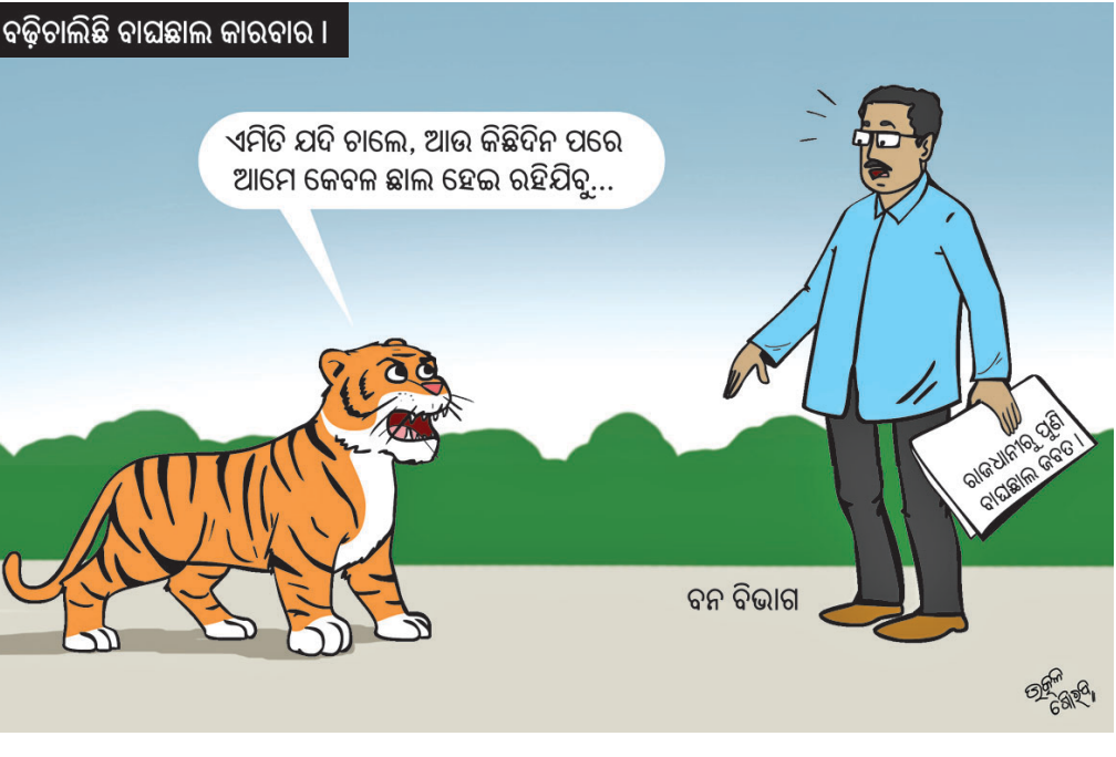
ବଢ଼ିଚାଲିଛି ବାୟୋଲୋଜି କାରବାର।

ଦର୍ଶନ ଆଶା ବଢ଼ିଛି। କିନ୍ତୁ ଏଥିପାଇଁ ଆହୁରି ଏକମାସ ଅପେକ୍ଷା କରିବାକୁ ପଡ଼ିବ। ଅର୍ଥାତ୍ ଡିସେମ୍ବର ତୃତୀୟ, ପୁଷ୍ଟା-୪