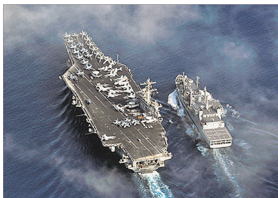
ଭାରତ, ଆମେରିକା, ଜାପାନ ଓ ଅଷ୍ଟ୍ରେଲିଆ ପକ୍ଷରୁ ଆରବ ସାଗରରେ ମଙ୍ଗଳବାର ଆରମ୍ଭ ହୋଇଛି ବୃତ୍ତୀୟ ପର୍ଯ୍ୟାୟ ମାଲାବାର ନୌସମୁଦ୍ରାଭ୍ୟାସ। ତାଙ୍କୁ ବିରୋଧରେ ସାମରିକ ଶକ୍ତି ବୃଦ୍ଧି କରିବା ଲକ୍ଷ୍ୟରେ ହେଉଥିବା ଏହି ଅଭିଯାନ ଗୁରୁତ୍ୱହୀନ ହୋଇପଡ଼ିଥିବା ଗତ ୧୫ ତାରିଖ ରିଲିଓନାଲ୍ କମ୍ପିନ୍‌ସନ୍‌ସ୍ ଇକୋନୋମିକ୍ ପାର୍ଟନରସିପ୍ (ଆରପିଇପି) ରୁଦ୍ଧି ଶ୍ରେଣୀ କରୁଛି। କାରଣ ତାଙ୍କୁ ନେତୃତ୍ୱାଧୀନ ଆରବିକ୍ ରୁଦ୍ଧିରେ ସାମିଲ ହୋଇଛନ୍ତି ମାଲାବାର ନୌସମୁଦ୍ରାଭ୍ୟାସର ଅଂଶୀଦାର ଜାପାନ ଓ ଅଷ୍ଟ୍ରେଲିଆ।

ନାଗରିକଙ୍କୁ ବିଧି ପ୍ରଦତ୍ତ ଅନେକ ଅଧିକାର ପ୍ରାପ୍ତ ହୋଇଥିବା ଏହି କ୍ରମରେ ଭାରତୀୟ ସମ୍ବିଧାନର ଅନୁଛେଦ ୩୨ ନାଗରିକ ଅଧିକାରଗୁଡ଼ିକର ପ୍ରବର୍ତ୍ତନ ପାଇଁ ଏକ ବଳିଷ୍ଠ ଉପଚାର। ଉକ୍ତ ଧାରାର ଉପଧାରା ୨ ସୁପ୍ରିମକୋର୍ଟଙ୍କ ନାଗରିକ ଅଧିକାରଗୁଡ଼ିକର ପ୍ରବର୍ତ୍ତନ ପାଇଁ ବନ୍ଦୀ ପ୍ରତ୍ୟକ୍ଷାକରଣ(ରିଟ୍ ଅଫ୍ ହେବିଟ୍ ଅଫ୍ କର୍ପସ୍), ପରମାଦେଶ(ମାଣ୍ଡାମସ୍), ନିଷେଧାଦେଶ(ପ୍ରେହିବିଟ୍ସନ), ଅଧିକାର ପ୍ରଶ୍ନ (କ୍ୱୋ ୱାରେଣ୍ଟୋ) ଓ ଉଦ୍‌ପ୍ରେସ୍‌ସ (ସାର୍ଟିଓରାରି)ର କ୍ଷମତା ପ୍ରଦାନ କରିଥାଏ। ଏହି ଉପଚାରର ଉଦ୍ଦେଶ୍ୟ ହେଉଛି ନାଗରିକଙ୍କୁ ପୃଷ୍ଠା-୪