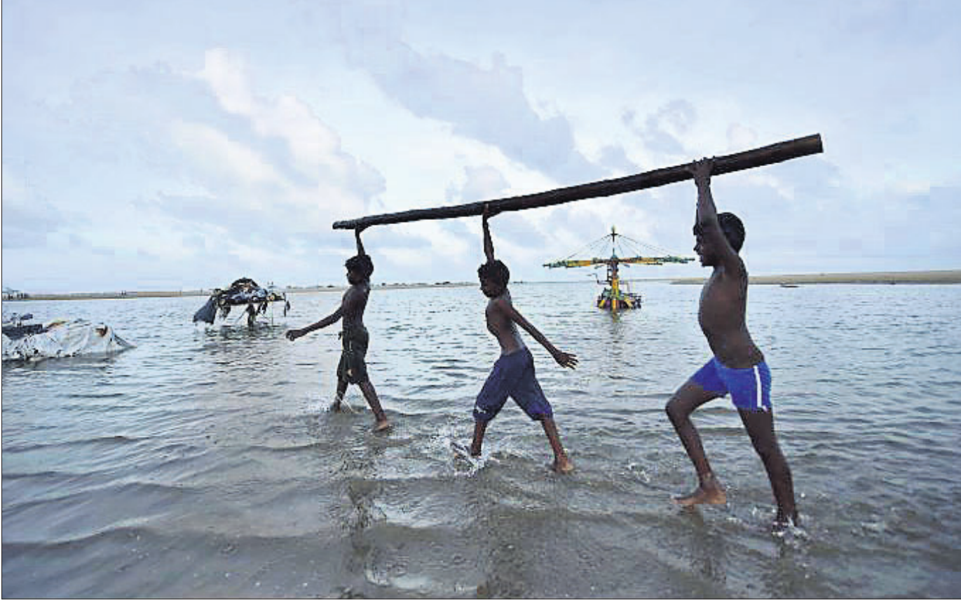
ତେନ୍ତାଇର ମାରିନା ବିକ୍ରେ ବର୍ଷା ପାଣିରେ ପିଲାମାନେ ଖେଳୁଛନ୍ତି।

ଘଟେହୁସୁର, ୧୭୧୧: ଉତ୍ତରପ୍ରଦେଶର ଫଟେହୁସୁରରେ ଦୁଇ ଦଳିତ ଭଉଣୀଙ୍କୁ ମାରି ଏକ ପୋଖରୀରେ ଫିଙ୍ଗିଦିଆଯାଇଛି। ସେମାନଙ୍କ ବୟସ ୮ ଓ ୧୨ ବର୍ଷ ହେବ ବୋଲି ଜଣାପଡ଼ିଛି। ପୋଖରୀରୁ ମୃତଦେହ ଉଦ୍ଧାର କରାଯିବା ପରେ ଆଖି ଓ ଶରୀରର ବିଭିନ୍ନ ସ୍ଥାନରେ ଆଘାତ ଚିହ୍ନ ରହିଥିବା ଦେଖାଯାଇଛି। ସେମାନଙ୍କୁ ବଳାକାର ଉଦ୍ୟମ ପରେ ହତ୍ୟା କରାଯାଇଥିବା ପରିବାର ପକ୍ଷରୁ ଅଭିଯୋଗ ହୋଇଛି। ପରିବା ଆଖିବା