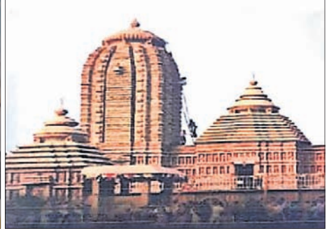
ଆଇଆରସିଟିସି ଓ ଏକ ଫ୍ରେବ୍ ଟ୍ୟୁଇ ସଂସ୍ଥା ପକ୍ଷରୁ ଶ୍ରୀମନ୍ଦିର ଭାବେ ଦର୍ଶାଯାଇଥିବା ଅନ୍ୟ ମନ୍ଦିର।