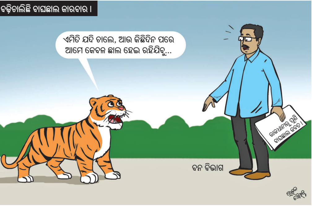
ବଢ଼ିଚାଲିଛି ବାୟୋଲୋଜି କାରବାର।

ଦର୍ଶନ ଆଶା ବଢ଼ିଛି। କିନ୍ତୁ ଏଥିପାଇଁ ଆହୁରି ଏକମାସ ଅପେକ୍ଷା କରିବାକୁ ପଡ଼ିବ। ଅର୍ଥାତ୍ ତିସେୟର ତୃତୀୟ, ପୃଷ୍ଠା-୪