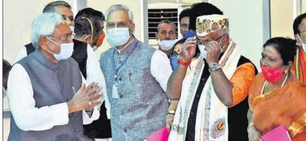
ବିହାର ମୁଖ୍ୟମନ୍ତ୍ରୀ ନୀତୀଶ କୁମାର ଓ ମନ୍ତ୍ରିମଣ୍ଡଳରେ ସ୍ଥାନ ପାଇଥିବା ରାଜନେତାଙ୍କ ମଧ୍ୟରେ କଥାବାର୍ତ୍ତା ଚାଲିଛି।