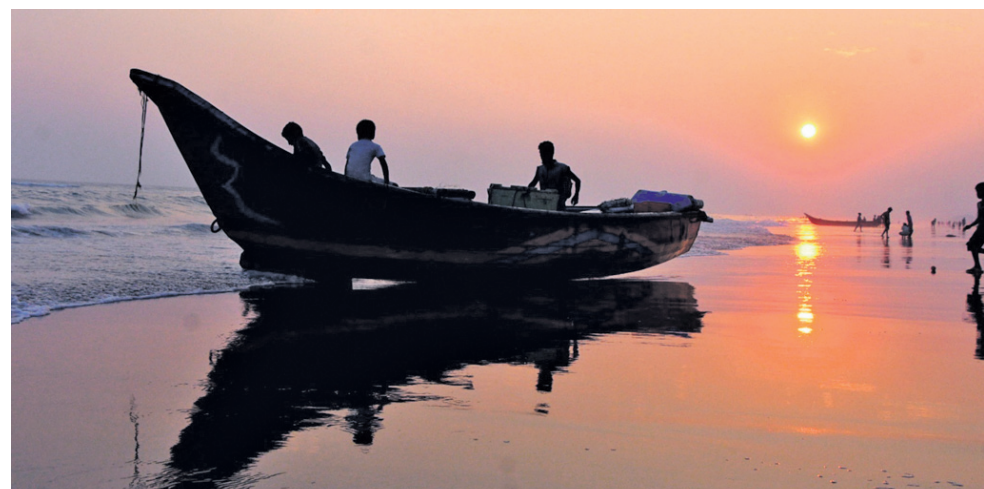
ସମୁଦ୍ରକୁ ମାଛ ମାରି ବୁଧବାର ସୂର୍ଯ୍ୟାସ୍ତ ସମୟରେ ପୁରୀ ବେଳାଭୂମିରେ ପହଞ୍ଚିଥିବା ମତ୍ସ୍ୟଜୀବୀମାନେ।