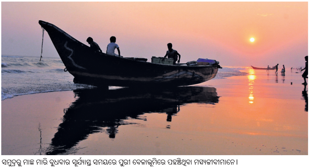
ସମୁଦ୍ର ଉପରେ ଚାଲିଥିବା ବୋଟର ଚିତ୍ରଣାକୁ ଦର୍ଶାଏ। ଖୁବ୍ ଲାଭକାରୀ ପରିସ୍ଥିତିରେ ଉପରେ ଉଲ୍ଲେଖ କରାଯାଇଛି।