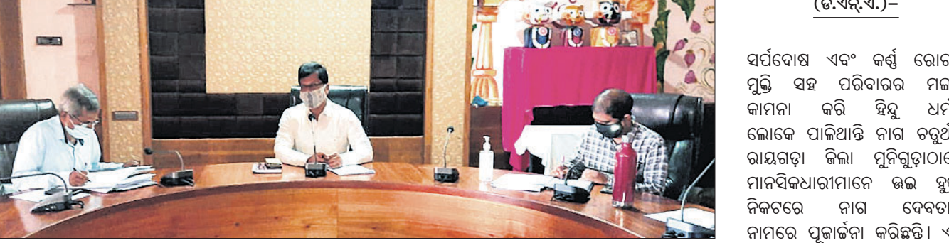
ବୈଠକରେ ଜିଲ୍ଲାପାଳଙ୍କ ସମେତ ଅନ୍ୟ ଅଧିକାରୀମାନେ।

ନବରଙ୍ଗପୁର, ୧୮୧୧ (ଡି.ପ୍ର.) ନବରଙ୍ଗପୁର ଓ ନନ୍ଦାହାଡ଼ି ବ୍ଲକର ୧୬ ଜଣ ସଂସ୍କୃତି ସହଯୋଗୀ ଛତ୍ର