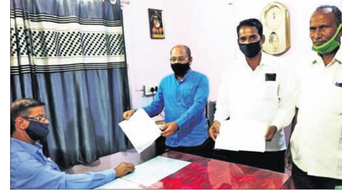
ଜିଲ୍ଲା ମୁଖ୍ୟ କୃଷି ଅଧିକାରୀଙ୍କୁ ଚାଷୀ ଅଭିଯୋଗ ପତ୍ର ପ୍ରଦାନ କରୁଛନ୍ତି।