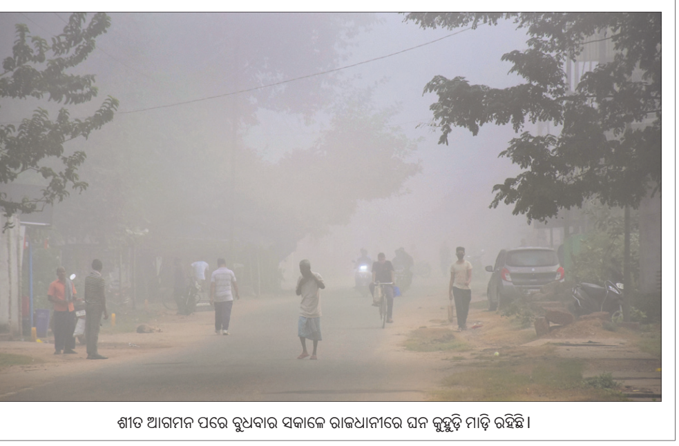
ଶୀତ ଆଗମନ ପରେ ବୁଧବାର ସକାଳେ ରାଜଧାନୀରେ ଘନ କୁହୁଳି ମାଡ଼ି ରହିଛି।