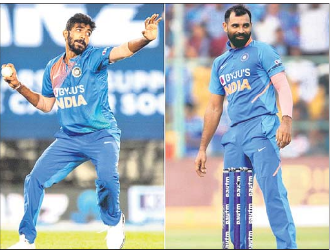
ସଂଗ୍ରାମୀ ବୁମ୍ରା ଓ ମହମ୍ମଦ ସାନି

ନୂଆଦିଲ୍ଲୀ, ୧୮।୧୧(ପି.ଟି.): ଭାରତର ପ୍ରମୁଖ ଦ୍ରୁତ ବୋଲର ସଂଗ୍ରାମୀ ବୁମ୍ରା ଓ ମହମ୍ମଦ ସାନି ଅଷ୍ଟେଲିଆ ବିପକ୍ଷରେ ସମସ୍ତ ଶ୍ରେଣୀକ ସାମିତ ଉଭୟ କ୍ରିକେଟ ମ୍ୟାଚ ଖେଳିବା ସମ୍ଭାବନା ରହିଛି। ଟିମ୍ ମ୍ୟାନେଜମେଣ୍ଟ ସେମାନଙ୍କୁ ଭାରତୀୟ ଟେଷ୍ଟ ଟେସ୍ଟରେ ଖେଳାଇ ଦେଖିବେ। ତେଣୁ ଆରମ୍ଭ ହେବାକୁ ଯାଉଥିବା ଟେଷ୍ଟ ସିରିଜ ଲଞ୍ଜିରି ପାଲି ବୁମ୍ରାଙ୍କୁ ଚାହୁଁଛନ୍ତି। ଅଷ୍ଟେଲିଆ ଗସ୍ତ ପ୍ରାରମ୍ଭରେ ଭାରତ ୩ଟି ଦିନିକି ଓ ସମାନ ସଂଖ୍ୟକ ଦିନ ୨୦୦ ମ୍ୟାଚ ଖେଳିବ। ଏହି ମ୍ୟାଚଗୁଡ଼ିକ ନଭେମ୍ବର ୨୭ରୁ ତିସହସ୍ର ୮ ମଧ୍ୟରେ