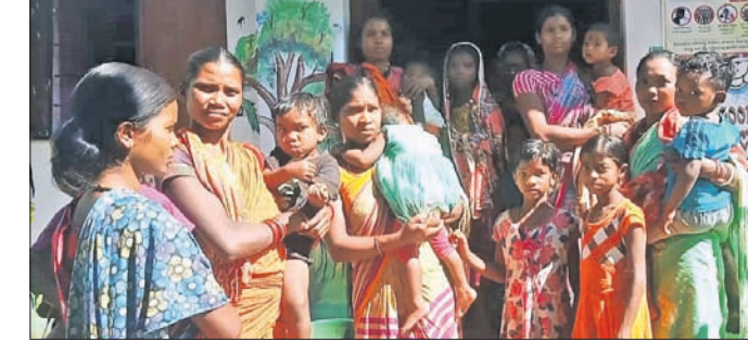
ସିତିପିଓ ମହିଳାମାନଙ୍କ ସହ ଆଲୋଚନା କରୁଛନ୍ତି।

ନବରଙ୍ଗପୁର ଜିଲ୍ଲା ଡାକ୍ତରୀ ବ୍ଲକ ବୋରିଗାଁ ପଞ୍ଚାୟତ ନିଆରୁଡ଼ା ଗାଁରେ ଛତ୍ରୁଆ ବନ୍ଧନରେ