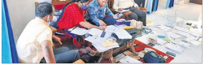
ଭିଜିଲାନ୍ସ କର୍ମଚାରୀମାନେ ଚଢ଼ାଉ କରୁଛନ୍ତି।

୧୬ ସ୍ଥାନରେ ଏକକାଳୀନ ଚଢ଼ାଉ ୨.୨୬ କୋଟି ଟଙ୍କାର ସମ୍ପତ୍ତି ଠାଉ ବାସଗୃହ, ନିହଲପ୍ରସାଦ ଆନା ଖଣ୍ଡବନ୍ଧ ଗ୍ରାମସ୍ଥିତ ପୈତୃକ ଘର ଏବଂ ଭୁବନେଶ୍ୱର କୋଲେଜିଆଲ ଡେବେଲପମେଣ୍ଟ ଏନ୍ସି ଡିଭି.ରେ ଏକକାଳୀନ ଚଢ଼ାଉ କରାଯାଇଥିଲା। ଡେକାନାଲସ୍ଥିତ ଚାଉଳ ପ୍ଲାନିଂ ଅଞ୍ଚଳରେ ଥିବା ଘରର ମୂଲ୍ୟ ୧୦ଲକ୍ଷ ୨୬ହଜାର ଟଙ୍କା ଆକଳନ କରାଯାଇଛି। ସେଠାକୁ ଏକ ଦାମୀ କାର, ଜିପ୍ (୨୦ଲକ୍ଷ ଟଙ୍କା), ଗୋଟିଏ ବୁଲେଟ୍ ଏବଂ ସ୍କୁଟି (୧ଲକ୍ଷ