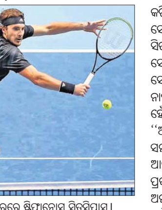
ଶର୍ ଖେଳିବା ଅବସରରେ ସ୍ଟିଫାନୋସ ସିଡିପିଆସ

ଲଣ୍ଡନ, ୧୮।୧୧(ଏପି) ଏଠାରେ ଚାଳିଥିବା ଏଟିପି ଆସୋସିଏଶନ ଅଫ୍ ଟେନିସ ପ୍ରୋଫେଶନାଲ୍ ଫାଇନାଲ୍ସ ଟେନିସ ଚ୍ୟାମ୍ପିୟନଶିପ୍ରେ ରାଫାଏଲ ନାଡାଲ୍ ହରାଇ ବିପର୍ଯ୍ୟୟ ସୃଷ୍ଟି କରିଛନ୍ତି ଡୋମିନିକ୍ ଥିମ୍। ଅନ୍ୟ ଏକ ମ୍ୟାଚରେ ଗରଥର ଚାମ୍ପିୟନ ସ୍ଟିଫାନୋସ ସିଡିପିଆସ ନବୀନତ ଆଣ୍ଡେ ରୁବଲୋଭ୍ ପରାସ୍ତ କରି ସେମିଫାଇନାଲ୍ ଆଶା ଉଜ୍ଜାବିତ କରିଛନ୍ତି। ଅଷ୍ଟିଆର ଥିମ୍ ଟାଇମ୍‌କେଟରେ ଦମ୍ଭାକ ପ୍ରଦର୍ଶନ କରି ୨୦ ଥର ଚାମ୍ପିୟନ ହେବାର ନାଡାଲ୍ଙ୍କୁ ହରାଇ ସେମିଫାଇନାଲରେ ପ୍ରବେଶ କରିଛନ୍ତି। ଡାକ୍ତର ସଂଘର୍ଷପୂର୍ଣ୍ଣ ମ୍ୟାଚରେ ଥିମ୍ ୭-୬(୬), ୬-୪(୫) ସେଟ୍ରେ ବିଜୟୀ ହୋଇଛନ୍ତି। ଗତ କାରୁଣ୍ୟରେ ଅନୁଷ୍ଠିତ ଅଷ୍ଟେଲିଆନ ଓପନ କ୍ୱାର୍ଟର ଫାଇନାଲ ପରେ ନାଡାଲ୍ଙ୍କୁ ପ୍ରଥମଥର ଭେଟିଥିଲେ ଥିମ୍। ମାତ୍ର ସେତେବେଳ ପରି ଏଥର ମଧ୍ୟ ଟାଇମ୍‌କେଟରେ ସେ ପ୍ରଭାବୀ ପ୍ରଦର୍ଶନ କରି ସଫଳ ହୋଇଛନ୍ତି। ଯୁଧ ସେ ଓପନ ଚାମ୍ପିୟନ ଥିମ୍ ଗତ ରବିବାର ସିଡିପିଆସକୁ ହରାଇ ଅଭିଯାନ ଆରମ୍ଭ କରିଥିଲେ। ଅନ୍ୟପକ୍ଷରେ ରୁବଲୋଭ କ୍ରମାଗତ