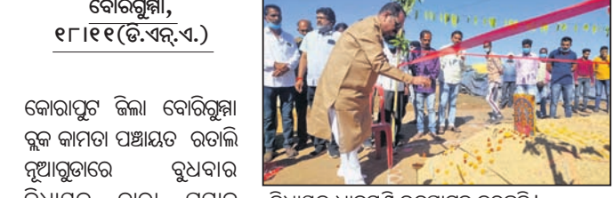
ବିଧାୟକ ଧାନମଣ୍ଡି ଉଦ୍‌ଘାଟନ କରୁଛନ୍ତି।

କୋରାପୁଟ ଜିଲ୍ଲା ବୋରିଗୁମ୍ମା ବ୍ଲକ କାମଟା ପଞ୍ଚାୟତ ରତାଳି ମୁଆରୁଡ଼ାରେ ରୁଧିବାର