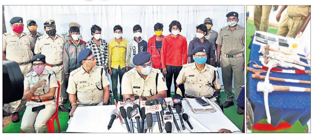
ଖବରଦାତା ସମ୍ମିଳନୀରେ ପୋଲିସ ଅଭିଯୁକ୍ତମାନଙ୍କୁ ହାକି କରିଛି ଏବଂ ଜବତ ହତ୍ୟାକାଣ୍ଡରେ ବ୍ୟବହୃତ ମାରଣାଣ୍ଡ।