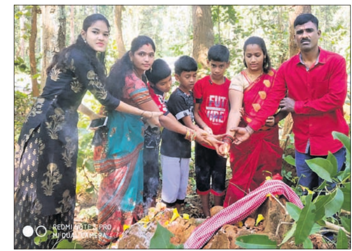
ମହିଳା ଓ ପିଲାମାନେ ବୁଟା ନିକଟରେ ପୂଜା କରୁଛନ୍ତି।

ନବରଙ୍ଗପୁର ଜିଲ୍ଲା ଡାକ୍ତରୀ ବ୍ଲକ ବୋରିଗାଁ ପଞ୍ଚାୟତ ଅଧୀନ ପରିଆବେତା