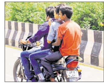
୨୦୨୦ ଅକ୍ଟୋବର ମାସରେ କେତେଜଣଙ୍କ ଲାଇସେନ୍ସ ରଦ୍ଦ କରାଯାଇଛି, ସେ