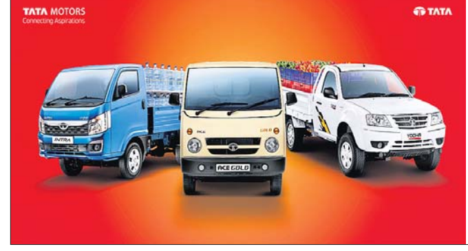
TATA MOTORS Collecting Automobiles

ନୂଆଦିଲ୍ଲୀ, ୧୯୧୧ ଟାଟା ମୋଟର୍ସ ପକ୍ଷରୁ 'ଇଣ୍ଡିଆ କି ଦୁଇଟି ଦିଆଯାଇ' ଅଭିଯାନ ସମ୍ପର୍କରେ ଘୋଷଣା କରାଯାଇଛି।