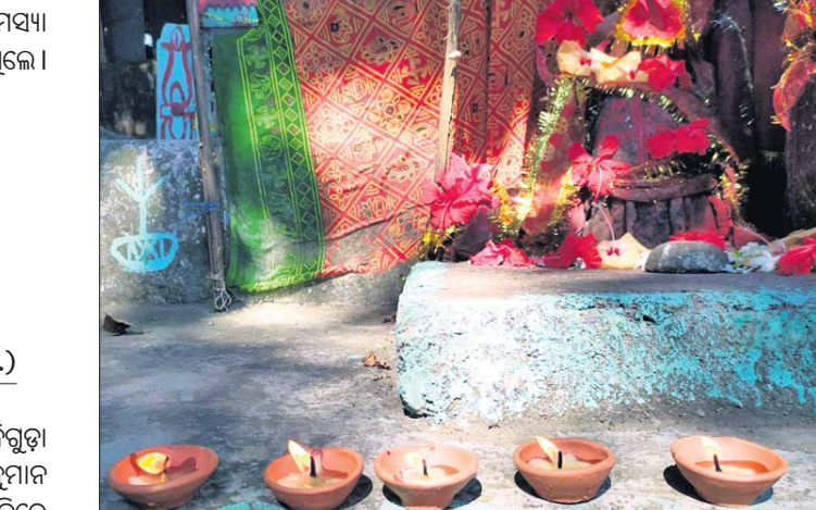
ଜିଏସ୍ ପକ୍ଷରୁ ଲଗାଯାଇଥିବା ଦୀପ।

ନବରଙ୍ଗପୁର, ୧୯।୧୧ (ବି.ପ୍ର.) ଗ୍ରାମ୍ୟ ବିକାଶ ସଙ୍ଗଠନ(ଜିଏସ୍)ର ୨୮ ତମ ଜୟନ୍ତୀ ପାଳିତ ହୋଇଛି।