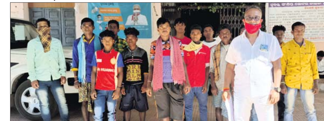
ଦାବିପତ୍ର ଦେବାକୁ ଆସିଥିବା ଗ୍ରାମବାସୀ

ସ୍ଵାଧୀନତାର ୭୩ ବର୍ଷ ପରେ ମଧ୍ୟ ବିଭାଗୀୟ ବ୍ଲକ୍ ରାଣୀଗୁଡ଼ା ପଞ୍ଚାୟତ ରାଣୀଗୁଡ଼ା ଗ୍ରାମବାସୀ ମୌଳିକ ସୁବିଧାରୁ ବଞ୍ଚିତ ରହିଛନ୍ତି।