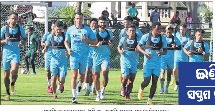
ଚେନ୍ନି ଅବସରରେ ଓଡ଼ିଶା ଏଫସି ଦଳର ଖେଳାଳିମାନେ।

ବାସେଲିନ(ଗୋଆ), ୧୯୧୧ (ପି.ଟି.) କୋଭିଡ଼-୧୯ ମହାମାରୀର ପ୍ରକୋପ ଜାରି ରହିଥିବା ବେଳେ ଦେଶର ପ୍ରଥମ ମେକର ଚୁନିମେଣ୍ଟ ଭାବେ ହାଇପ୍ରୋପାଲ ଇଣ୍ଡିଆନ ଫୁଟବଲ ଲିଗ୍ (ଆଇଏସଏଲ) ଶୁକ୍ରବାରଠାରୁ ଆରମ୍ଭ ହେବାକୁ ଯାଉଛି। ଦୀର୍ଘମଧ୍ୟ ତଳେ ଲକ୍ଷ୍ମଣର ଜାରି କରାଯାଇଥିଲା। ସେବେଠାରୁ ଭାରତରେ କୌଣସି ବଡ଼ ଚୁନିମେଣ୍ଟ ଆୟୋଜନ ହୋଇ ନ ଥିଲା। ଶୁକ୍ରବାର ସ୍ଥାନୀୟ ଜିଏସସି ସ୍ପୋର୍ଟସ୍‌ରେ ପୂର୍ବତନ ଗାମ୍ପିୟନ ଏଟିକେ ମୋହନ ବାଗାନ ଓ କେରଳ ଗ୍ଲାସର୍ସ ଉଦ୍‌ଘାଟନୀ ମ୍ୟାଚ୍‌ରେ ମୁହାଁମୁହିଁ ହେବେ।