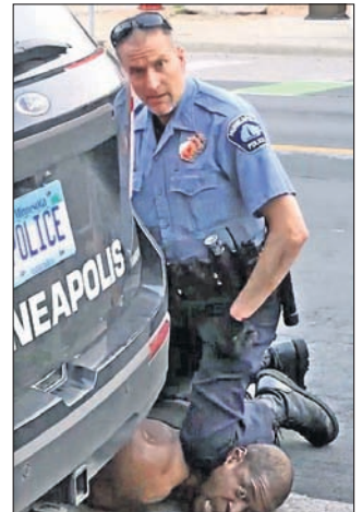
ବୋଲି ଧରାଯାଇଛି। ଉପରୋକ୍ତ ଘଟଣାର ୬ ମାସ ପୂର୍ବରୁ ଗୁରୁବାର

୨୦୨୦ ମେ ୨୫ରେ ଆମେରିକାର ମିନିଆପଲିସରେ କୃଷକମାନଙ୍କ ଲକ୍ଷ୍ୟରେ ଲାଗିଥିବା ପୋଲିସ ଅଫିସର ଆସୁରେ ଚାପି ହତ୍ୟା କରିଥିଲେ। ମୃତ୍ୟୁ ପୂର୍ବରୁ ଫୁଲଡ୍ 'ମୁଁ ନିଃଶ୍ୱାସ ନେଇପାରୁନାହିଁ' ବୋଲି ବାରମ୍ବାର କହୁଥିଲେ। ଏହି ହତ୍ୟାକାଣ୍ଡରୁ ଆମେରିକାରେ ପୁଣିଥରେ ମୁଣ୍ଡ ଟେକିଥିଲା ବର୍ଷଦିନେ ବିରୋଧୀ ଆନ୍ଦୋଳନ, ଯାହାକି 'ବ୍ଲୁ ଲାଇଫ୍ ମାଗେ' ନାମରେ ବିଦିତ। କୃଷକମାନଙ୍କ ବିରୋଧରେ ପୋଲିସ ବର୍ବରତା ଓ ଦମନଲାଳା ପ୍ରତିବାଦରେ ଉଠିଥିବା ସ୍ୱରକୁ ରାଷ୍ଟ୍ରପତି ଡୋନାଲ୍ଡ ଟ୍ରମ୍ପଙ୍କ ପରାଜୟର ଅନ୍ୟତମ କାରଣ