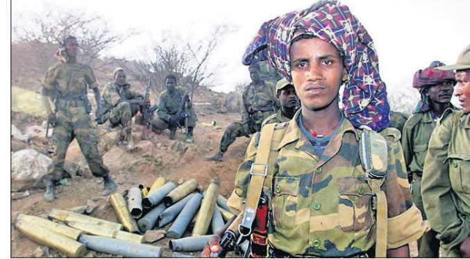
ଅଦି ଟିପିଏଲଏଫ୍ ବିରୋଧରେ ସେନା ଶିବିରକୁ ଆକ୍ରମଣ, ସୈନ୍ୟଙ୍କୁ ହତ୍ୟା ଓ ଯୁଦ୍ଧାତ୍ମକ ଚୋରି ଅଭିଯୋଗ ଆଣିଥିଲେ। ଫଳରେ ଚିତ୍ରାୟନ୍ ବିଦ୍ରୋହୀମାନେ ରାଜଧାନୀ ଆଡିଏ

ଉତ୍ତର ଆଫ୍ରିକାୟ ରାଷ୍ଟ୍ର ଇଥିଓପିଆରେ ପ୍ରଧାନମନ୍ତ୍ରୀ ଅଦି ଅହମ୍ମଦ୍ ସରକାର ବିରୋଧରେ ଚିତ୍ରେସ୍ ପିପୁଲ୍ ଲିବରେଶନ୍ ଫ୍ରଣ୍ଟ (ଟିପିଏଲଏଫ୍) ଯୁଦ୍ଧଦେହୀ ତାକରା ଦେଇଛି। ସେନା ଓ ବିଦ୍ରୋହୀଙ୍କ ମଧ୍ୟରେ ସଂଘର୍ଷ ସାମାନ୍ୟ ଅବସ୍ଥାରେ ରାଜନୈତିକ ତଥା ମାନବାଧି ସଙ୍କଟ ସୃଷ୍ଟି ହୋଇଛି। ଚିତ୍ରେସ୍ ଅଞ୍ଚଳରେ ସଂଘାୟ ସରକାର ଓ ଅସହଯୁକ୍ତ କର୍ତ୍ତୃପକ୍ଷଙ୍କ ମଧ୍ୟରେ ଦୀର୍ଘଦିନ ଧରି ଲାଗିରହିଥିବା ଉତ୍ତେଜନା ନଭେମ୍ବର ୪ରେ ସାମରିକ ସଂଘର୍ଷର ରୂପ ନେଇଥିଲା। ସଂଘର୍ଷରେ ହଜାର ହଜାର ଲୋକଙ୍କ ଜୀବନ ଯାଇଥିବାବେଳେ ୩୭,୦୦୦ରୁ ଅଧିକ ଲୋକ ପଡୋଶୀ ସୁଦାନକୁ ପଳାୟନ କରିଛନ୍ତି। ପ୍ରଧାନମନ୍ତ୍ରୀ