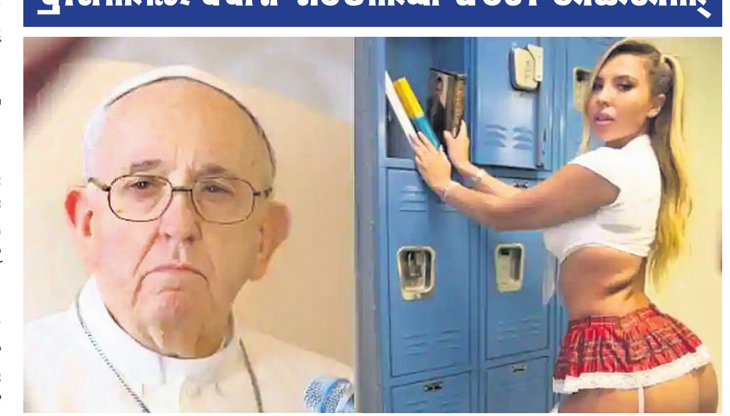
ପୋପ୍ ଫ୍ରାନ୍ସିସ୍ ନଟାଲିଆ ଗରିବୋଗୋ