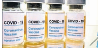
ଭିଡ଼ିଓ କନ୍ଫରେନ୍ସ ଜରିଆରେ କି-୨୦ ସମ୍ବନ୍ଧରେ କହିଛନ୍ତି। କେନ୍ଦ୍ର ପ୍ରସ୍ତୁତ ୫ଟି ଟିକାର ଏବେ ତୃତୀୟ ପର୍ଯ୍ୟାୟ ପରୀକ୍ଷା ଚାଲିଛି।

ମସ୍କୋ, ୨୨।୧୧: କରୋନା ଟିକା ସ୍ପୁଟନିକ୍-ଭି ଅନ୍ୟ ଦେଶଗୁଡ଼ିକୁ ଯୋଗାଇ ଦେବାକୁ ରୁଷିଆ ପ୍ରସ୍ତୁତ ଥିବା ଏହାର ରାଷ୍ଟ୍ରପତି ଭାଷିନି ଫୁଲିନ୍ କି-୨୦ ବୈଠକରେ କହିଛନ୍ତି। ଏଥିସହିତ ରୁଷିଆ ଆଉ ଦୁଇଟି କୋଭିଡ଼ ଟିକା ପ୍ରସ୍ତୁତ କରୁଥିବା ସେ ସୂଚନା ଦେଇଛନ୍ତି। ବିଶ୍ୱପ୍ରସାରୀ କରୋନା ଟିକା ସହଯୋଗ ଲାଗି ଚୀନରୁ ପ୍ରସ୍ତୁତ ଥିବା ଏହାର ରାଷ୍ଟ୍ରପତି ଶି କିଂପିଙ୍ଗ