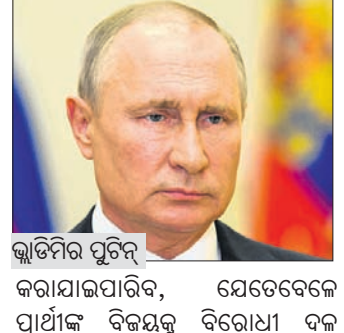
ଭାଷିନି ଫୁଲିନ୍, ଯେତେବେଳେ ପ୍ରାର୍ଥୀଙ୍କ ବିଜୟକୁ ବିରୋଧୀ ଦଳ

ମସ୍କୋ, ୨୨।୧୧ ଆମେରିକା ରାଷ୍ଟ୍ରପତି ଭାବେ କୋ ବାଇଡେନ୍‌ଙ୍କୁ ସ୍ୱୀକୃତି ଦେବାକୁ ସେ ପ୍ରସ୍ତୁତ ନୁହଁନ୍ତି ବୋଲି ରୁଷିଆ ରାଷ୍ଟ୍ରପତି ଭାଷିନି ଫୁଲିନ୍ କହିଛନ୍ତି। ତେବେ ଆମେରିକାୟମାନଙ୍କର ଆତ୍ମା ଥିବା ଯେକୌଣସି ବ୍ୟକ୍ତିଙ୍କ ସହ କାମ କରିବାକୁ ସେ ପ୍ରସ୍ତୁତ ଅଛନ୍ତି। ତେବେ ଆତ୍ମା କେବଳ ସେତେବେଳେ