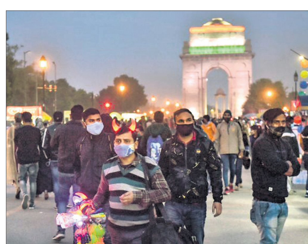
ନୂଆଦିଲ୍ଲୀରେ କରୋନା ସଂକ୍ରମଣ ଓ ମୃତ୍ୟୁ ବ୍ୟାପକ ହୋଇଥିବାବେଳେ ରବିବାର ସମ୍ପାରେ ଉଦ୍ଘୋଷଣା ରେଡ୍ ଅଞ୍ଚଳରେ ଜନଗହଳ ଦେଖିବାକୁ ମିଳିଛି।