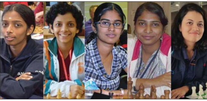
ସ୍ୱର୍ଣ୍ଣ ପଦକ ବିଜୟୀ ଭାରତୀୟ ମହିଳା ଚେସ୍ ଦଳ ।

ଏପରି ଏକ ସମୟ ଆସିବ ଯେତେବେଳେ କି ସମଗ୍ର ବିଶ୍ୱରେ କ୍ରୀଡ଼ା ପ୍ରତିଯୋଗିତା ଏକାବେକେକେ ବନ୍ଦ ହୋଇଯିବ ତାହା ବିଶ୍ୱାସୀୟ ବାହାରେ ଥିଲା । ଯଦିବା ଖେଳ ହେବ ବେଶ୍‌ବାକ୍ସୁ ଖୁସିରୁମରେ ଦର୍ଶକ ନ ଥିବେ ଏହା ମଧ୍ୟ କଳ୍ପନା କରିବା ଅସମ୍ଭବ ଥିଲା । ସିକନ ଅନୁସାରେ ବିଭିନ୍ନ କ୍ରୀଡ଼ା ହେଉଥିବାରୁ ଫୁଟବଲ ନ ହେଲେ କ୍ରିକେଟ, ବେସବଲ, ରଗ୍‌ବୀ, ଆଥଲେଟିକ୍ସ କିମ୍ବା ହକି କେଉଁଠି ନା କେଉଁଠି କିଛି ନା କିଛି କ୍ରୀଡ଼ା ଚାଲିଥାଏ । ମାତ୍ର କୋଭିଡ-୧୯ ଯୋଗୁଁ ଏପରି ଏକ ସମୟ ଆସିଲା ଯେଉଁଥିପାଇଁ ସମଗ୍ର ବିଶ୍ୱରେ କ୍ରୀଡ଼ା ଠିକ୍ ହୋଇଗଲା । ଖେଳପଡ଼ିଆ ଖାଁ ଖାଁ, ପ୍ରସ୍ତ ହୋଇଗଲେ କ୍ରୀଡ଼ାବିତ୍ । ଘରୁବାହାରିବାର ଲୁନାହିଁ । ଲକ୍ ଡାଇନ, ଶର୍ତ୍ତ ଡାଇନର କଟକଣା ମଧ୍ୟରେ ହଜିଗଲା ବିଭିନ୍ନ କ୍ରୀଡ଼ା ପ୍ରତିଯୋଗିତା । ଅଲିମ୍ପିକ୍ସ ପରି କ୍ରୀଡ଼ା ମହାକୁସ ମଧ୍ୟ ସ୍ଥଗିତ ରହିଲା । ମହାମାରୀ ପ୍ରକୋପରେ ବିଶ୍ୱବ୍ୟାପୀ ଅଗଣିତ କ୍ରୀଡ଼ା ବାତିଲ ହେଲା କିମ୍ବା ପୁଞ୍ଜିଲା । ଦୀର୍ଘ ୬ ମାସରୁ ଉର୍ଦ୍ଧ୍ୱ ଏପରି ଆଶଙ୍କାରେ ବିଚିତ୍ର ପରେ ଏବେ କୋଭିଡ କଟକଣା ମଧ୍ୟରେ କେତେକ ସ୍ଥାନରେ ଚଳଚ୍ଚଳ ହୋଇଛି କ୍ରୀଡ଼ା ଦୁନିଆ । ବିଭିନ୍ନ ଦେଶର ସରକାର ଏସ୍‌ପିସି (ଖୁଣ୍ଟାଉଁ ଅପରେଟିଂ ପ୍ରୋସିଜିଓର) ଜାରି କରି କଟକଣା ମଧ୍ୟରେ କ୍ରୀଡ଼ା ପ୍ରତିଯୋଗିତା ଆରମ୍ଭ କରିଛନ୍ତି । କରୋନା ସଂକ୍ରମଣର ଆଖିଆ ଥିବାରୁ ରୁକ୍‌ଦ୍ୱାରରେ ଅର୍ଥାତ୍ ବିନା ଦର୍ଶକରେ ଖେଳ ଅନୁଷ୍ଠିତ ହେଉଛି । ବ୍ଯାଷ୍ଟାଲାଇନ୍ ଏବଂ କୋଭିଡ୍ ଚେଷ୍ଟ