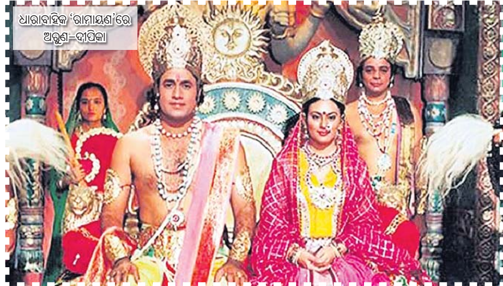
ଧାରାବାହିକ 'ରାମାୟଣ'ରେ ଅଭିନୟ କରିବା