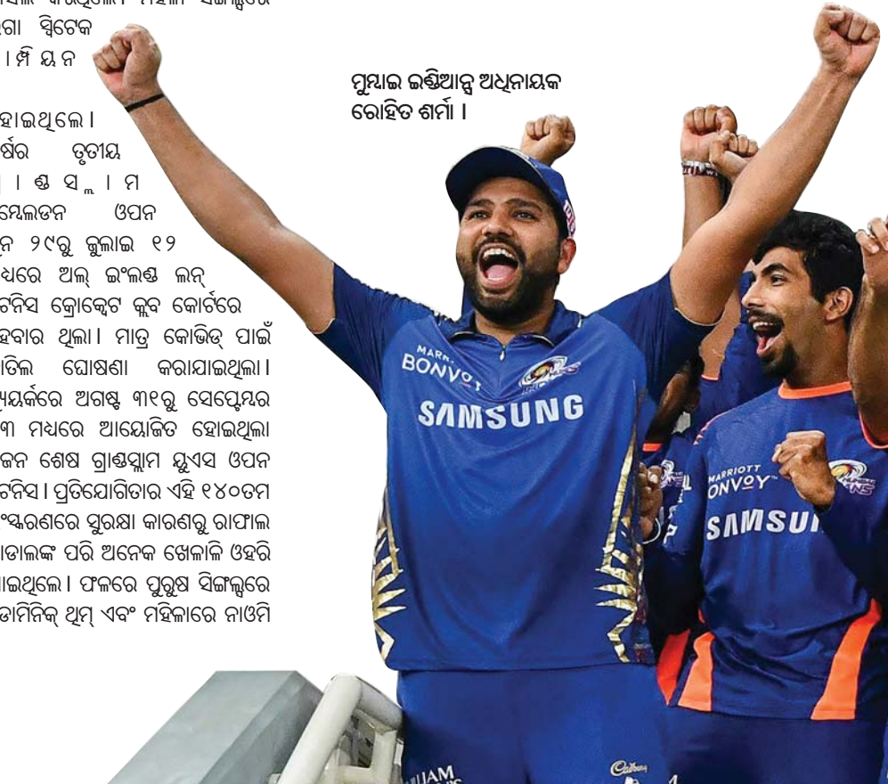
ସୁସ୍ୱ ଇଣ୍ଡିଆନ୍ ଅଧିନାୟକ ରୋହିତ ଶର୍ମା ।

ବାସୋଲିମ୍ପିକ୍ସ ଜିଏମ୍‌ସି ଆଥଲେଟିକ୍ ଷ୍ଟାଡିୟମ ଏବଂ ଭାଷୋଡାଗାମାସ୍ତିତ ତିଲକ ମଇକାବନରେ ମ୍ୟାଟଗୁଡ଼ିକ ଅନୁଷ୍ଠିତ ହେଉଛି । ଗ୍ରୀଷ୍ମସ୍ନାନ ଚେନିସ: ଅଷ୍ଟ୍ରେଲିଆରେ କରୋନା ପ୍ରଭାବ ଅନୁଭୂତ ହେବା ପୂର୍ବରୁ କାରୁୟାରୀ ୨୦୦୦ ଫେବୃୟାରୀ ୨ ପର୍ଯ୍ୟନ୍ତ ସିକନ ପ୍ରାରମ୍ଭ ଗ୍ରୀଷ୍ମସ୍ନାନ ଚେନିସ ଅନୁଷ୍ଠିତ ହୋଇ ଯାଇଛି । ଅଷ୍ଟ୍ରେଲିଆନ ଓପନର ପୁରୁଷ ସିଙ୍ଗଲରେ ନୋଭାକ୍ ଜୋକୋଭିଚ୍ ଏବଂ ମହିଳା ସିଙ୍ଗଲରେ ସୋଫିଆ କେନିନ୍ ଚାମ୍ପିୟନ ହୋଇଛନ୍ତି । କୋଭିଡ-୧୯ ପାଇଁ ବିଶେଷ ପ୍ରଭାବିତ ହୋଇଥିଲା ବିଫିଲ୍ ଗ୍ରୀଷ୍ମସ୍ନାନ ଫ୍ରେଞ୍ଚ ଶାରକାରେ ଖେଳାଯାଇଥିଲା । ଏଥିରେ ଚାମ୍ପିୟନ ହୋଇ ପୁସ୍ତକ ଇଣ୍ଡିଆନ୍ ରେକର୍ଡ୍ ୫ମଥର ପାଇଁ ଚାଲିଚଳି ହାସଲ କରିଥିଲା । ଆଇପିଏଲ ଅବସରରେ ମହିଳା ଟି୨୦ ବ୍ୟାଲେଞ୍ଜ ମଧ୍ୟ ସୁସ୍ୱ ଚେନିସ ପ୍ରତିଯୋଗିତାରେ ଫାଇନାଲରେ ସୁପରନୋଭାସକୁ ହରାଇ ଡେଲିକେଟ୍ ସୁପରଥର ପାଇଁ ଚାଲିଚଳି ହାସଲ କରିଥିଲା । ଇତିମଧ୍ୟରେ ପାକିସ୍ତାନ ଯରୋଇ ମାଟିରେ ଜିମ୍ବାୱେ ବିପକ୍ଷରେ ସିରିଜ ଖେଳି ସାରିଥିବାବେଳେ ଭାରତର ଅଷ୍ଟ୍ରେଲିଆ ଗସ୍ତ ଆରମ୍ଭ ହୋଇଛି । ଫ୍ଲେଷ୍‌ଇଣ୍ଡିଜ କ୍ରିକେଟ ଦଳ ମଧ୍ୟ ୟୁକ୍ରେନରେ ଖେଳିବା ଆରମ୍ଭ କରିଛି । ଅଷ୍ଟ୍ରେଲିଆରେ ମହିଳା ସିରିଜ ସହିତ କ୍ରିକେଟ ଆରମ୍ଭ ହୋଇଥିଲା । ଅଷ୍ଟ୍ରେଲିଆ ଓ ୟୁକ୍ରେନ ମଧ୍ୟରେ ଏହା ସିରିଜରେ ୩ ମ୍ୟାଚ ବିଶିଷ୍ଟ ଟି୨୦ ଓ ଦିନିକିଆ ମ୍ୟାଚ ଖେଳାଯାଇଥିଲା ।