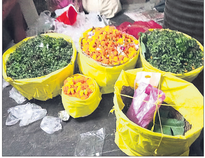
ନାଗାର୍ଜୁନ ବେଶ ପାଇଁ ଭୁଲସୀ ରଥ ପଠାଯାଇଛି।