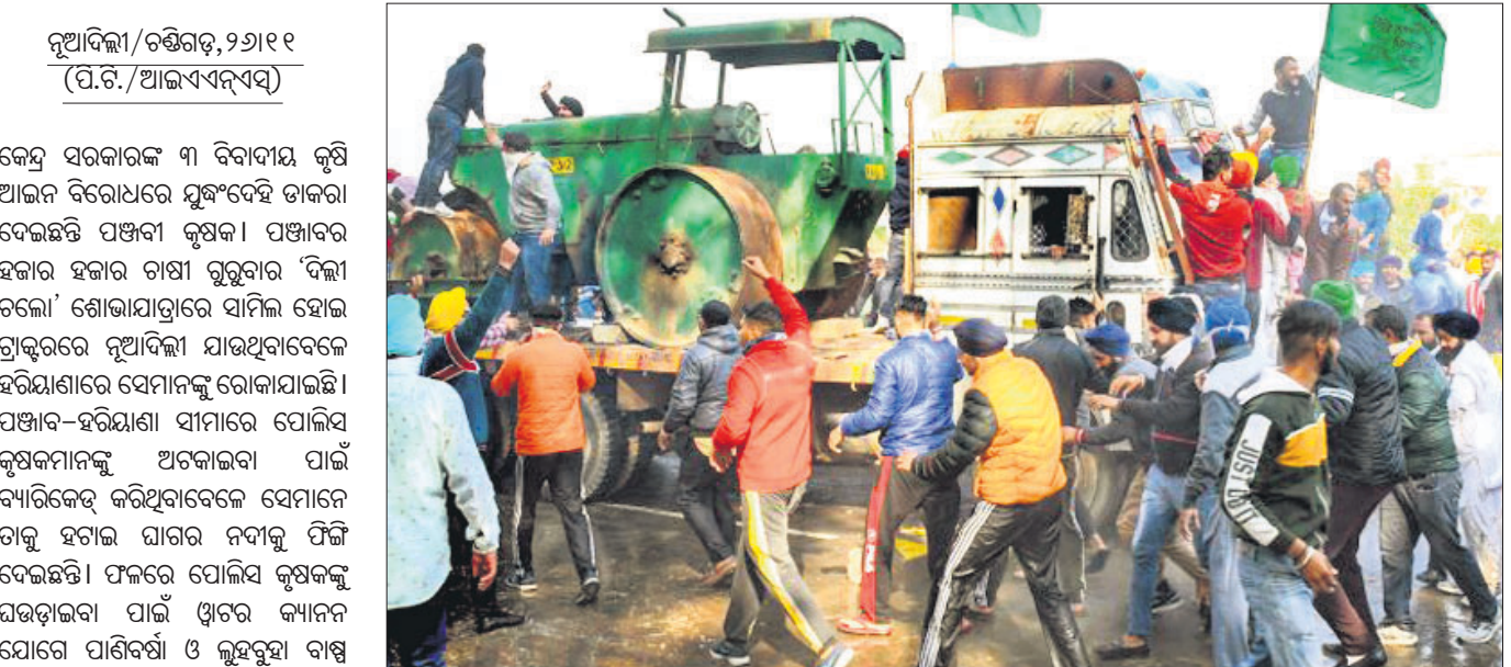
'ଦିଲ୍ଲୀ ଚଳେଲେ' ବିରୋଧରେ କେନ୍ଦ୍ର ପଞ୍ଜାବ-ହରିୟାଣା ସାମାଜିକ ଦଳ ପକ୍ଷରୁ ପ୍ରଦର୍ଶନୀ ପ୍ରଦର୍ଶନ ସମୟରେ ଖିଲଡ଼ି ହୋଇଛି ।

କେନ୍ଦ୍ର ସରକାରଙ୍କ ୩ ବିବାଦୀୟ କୃଷି ଆଇନ ବିରୋଧରେ ମୁଦ୍ଦାଦେହି ଡାକରା ଦେଇଛନ୍ତି ପଞ୍ଜାବ କୃଷକ । ପଞ୍ଜାବର ହଜାର ହଜାର ଚାଷୀ ରୁକୁବା 'ଦିଲ୍ଲୀ ଚଲେଲେ' ଶୋଭାଯାତ୍ରାରେ ସାମିଲ ହୋଇ ଗ୍ରାହକରେ ନୂଆଦିଲ୍ଲୀ ଯାଉଥିବାବେଳେ ହରିୟାଣାରେ ସେମାନଙ୍କୁ ରୋକାଯାଇଛି । ପଞ୍ଜାବ-ହରିୟାଣା ସାମାଜିକ ପୋଲିସ୍ କୃଷକମାନଙ୍କୁ ଅଟକାଇବା ପାଇଁ ବ୍ୟାରିକେଡ୍ କରିଥିବାବେଳେ ସେମାନେ ତାକୁ ହଟାଇ ଯାଗାର ନଦୀକୁ ଫିଙ୍ଗି ଦେଇଛନ୍ତି ।