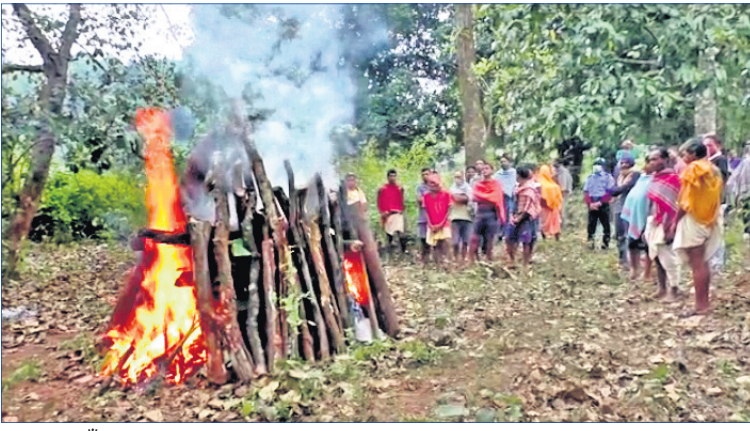
ମିଲୁପଡ଼ା ଗାଁ ଶୁଖାନରେ କାଳିଆଙ୍କୁ ପୁଣି ବିଦାୟ ଦେବା ପାଇଁ ଏକ ବଡ଼ ଘୋଡ଼ାଦଳର ବିଦାୟ ସମାବେଶ ହୋଇଥିଲା।

କନ୍ଧମାଳ ଜିଲ୍ଲା ପିରିଗୁଆ ବ୍ଲକ୍ ମିଲୁପଡ଼ା ଗ୍ରାମର ଯୋଡ଼ାପୁଣ୍ୟ ଶିଶୁ ଜଗା, କାଳିଆଙ୍କ ମଧ୍ୟରୁ କାଳିଆ ବୃଦ୍ଧଙ୍କୁ ବିଦାୟ ଦେବା ପାଇଁ ଗାଁ ଶୁଖାନରେ ଏକ ସମାବେଶ ହୋଇଥିଲା। ଏଠି ପ୍ରାୟ ୧୦୦ ଲୋକ ଉପସ୍ଥିତ ରହିଥିଲେ।