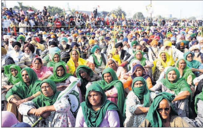
ସିନ୍ଧୁ ସାମାଜିକ ଆନ୍ଦୋଳନର ଚାଷୀ।

ମୋଦି କହିବା ସହ ନୂଆ ଆଇନ ଯେ ଦିଗରେ ଏକ ପଦକ୍ଷେପ ବୋଲି କହିଥିଲେ। ତିନି କୃଷି ଆଇନ ବିରୋଧରେ ଆନ୍ଦୋଳନ ରବିବାର ଦିଲ୍ଲୀର ୩ ଆନ୍ତର୍ଜାତୀୟ ସାମାଜିକ କାର୍ଯ୍ୟକ୍ରମରେ ଦିଲ୍ଲୀ-ଚଣ୍ଡିଗଡ଼ ସାମାଜିକ ଚଳ୍ପ କୃଷକମାନଙ୍କ କଲ୍ୟାଣ ଲାଭି ସରକାର ପ୍ରତିଶ୍ରୁତିବଦ୍ଧ ବୋଲି ପ୍ରଧାନମନ୍ତ୍ରୀ ନରେନ୍ଦ୍ର