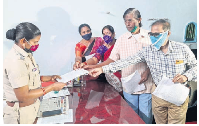
ସତେଜ ନାଗରିକ ମଞ୍ଚ ପକ୍ଷରୁ ସିଂହଦ୍ୱାର ଥାନାରେ ଏତଲା ଦିଆଯାଇଛି।