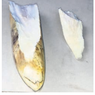
ବନ ବିଭାଗ ଉଦ୍ଧାର କରିଥିବା ଭଙ୍ଗା ହାତୀ ଦାନ୍ତ।