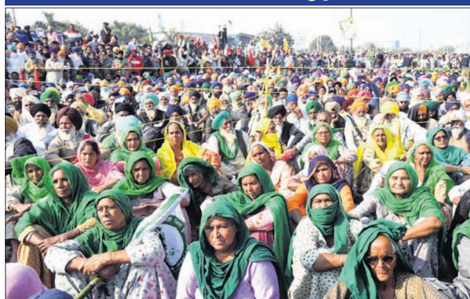
ସିନ୍ଧୁ ସାମାଜିକ ଆନ୍ଦୋଳନର ଚାଷୀ।

ମୋଦି କହିବା ସହ ନୂଆ ଆଇନ ସେ ଦିଗରେ ଏକ ପଦକ୍ଷେପ ବୋଲି କହିଥିଲେ। ତିନି କୃଷି ଆଇନ ବିରୋଧରେ ଆନ୍ଦୋଳନ ରବିବାର ଦିଲ୍ଲୀର ୩ ଆନ୍ତର୍ଜାତୀୟ ସାମାଜିକ କାର୍ଯ୍ୟକ୍ରମ ଦିଲ୍ଲୀ-ଚଣ୍ଡିଗଡ଼ ସାମାଜିକ ଚଳାଚଳିତ କୃଷକମାନଙ୍କ କଲ୍ୟାଣ ଲାଗି ସରକାର ପ୍ରତିଶ୍ରୁତି ଦେଇ ବୋଲି ପ୍ରଧାନମନ୍ତ୍ରୀ ନରେନ୍ଦ୍ର