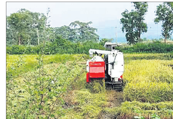
ଭେଡ଼େନ ବୁକ ଉଦ୍‌ପୁର ଅଞ୍ଚଳରେ ହାତେଇ ଯୋଗେ ଧାନ ଅମଳ ଚାଲିଛି ।