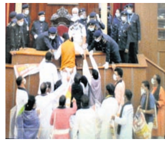
ଭୁବନେଶ୍ୱର, ୨୯/୧୧ (ବ୍ୟୁରୋ)