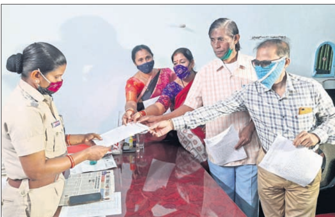
ସତେଜନ ନାଗରିକ ମଞ୍ଚ ପକ୍ଷରୁ ସିଂହଦ୍ୱାର ଥାନାରେ ଏତଲା ଦିଆଯାଇଛି।

ବଡ଼ ବିପ୍ଳବ ବୋଲି ଫାଟେଗଡ଼ ସାହିବ ଜିଲାର ଚାଷୀ ସଭାରେ ସିଂ କହିଛନ୍ତି। ଏପରି କି ଆମେରିକା ଓ କାନାଡ଼ାରେ ରହୁଥିବା ପ୍ରବାସୀ ପଞ୍ଚାବୀମାନେ କୃଷକ ଆନ୍ଦୋଳନକୁ ସମର୍ଥନ ଜଣାଇଛନ୍ତି। ଆଲୋଚନା ପୂର୍ବରୁ ବୁରାରିକୁ ଆନ୍ଦୋଳନ ସ୍ଥାନାନ୍ତର କରିବା ଲାଗି ଶାହା ଯେଉଁ ପ୍ରସ୍ତାବ ଦେଇଥିଲେ ତାକୁ କୃଷକ ସଂଗଠନଗୁଡ଼ିକ ସର୍ବସମ୍ମତ କ୍ରମେ ଅଗ୍ରାହ୍ୟ କରିଦେଇଛନ୍ତି। ଆମେ ସିନ୍ଧୁ ଏବଂ କୋଣାର୍କ ସାମାଜିକ ହଟରୁ ନାହିଁ ବୋଲି ସର୍ବଦା କହିଛନ୍ତି। ସୂଚନାଯୋଗ୍ୟ, ଆନ୍ତର୍ଜାତୀୟ ସାମାଜିକ କୃଷକମାନେ ରାସ୍ତା ଅବରୋଧ କରି ରଖୁଥିବାରୁ ଯୋଗାଣ ଶୃଙ୍ଖଳ ବାଧାପ୍ରାପ୍ତ ହୋଇଛି। ତେବେ ଆଲୋଚନା ପୂର୍ବରୁ କୃଷକମାନେ ବୁରାରି ପଡ଼ିଆକୁ ଯିବା ଲାଗି ସେ ସର୍ତ୍ତ ରଖିଥିଲେ। ସେପଟେ ରାଜସ୍ଥାନ ମୁଖ୍ୟମନ୍ତ୍ରୀ ଅଶୋକ ଚୌହାନଙ୍କ ପ୍ରଧାନମନ୍ତ୍ରୀ ନରେନ୍ଦ୍ର ମୋଦିଙ୍କ ନିକଟକୁ ପତ୍ର ଲେଖିଛନ୍ତି। ଚାଷୀଙ୍କ ସ୍ୱାର୍ଥ ଓ