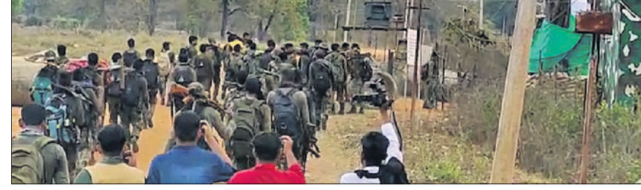
ବିଚ୍ଛୋରଣ ଘଟିଥିବା ଅଞ୍ଚଳରେ ଯବାନମାନେ କୋଫି ଅପରେଶନ କରୁଛନ୍ତି।