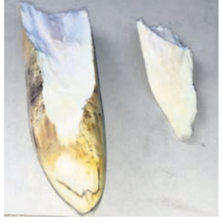
ଜବତ ହାତୀ ଦାନ୍ତ।