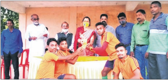
ଚାମ୍ପିୟନ ବରକାମୀ ବକ୍ସ ପୁସ୍ତକ ଲୋକାରମ୍ଭ ।