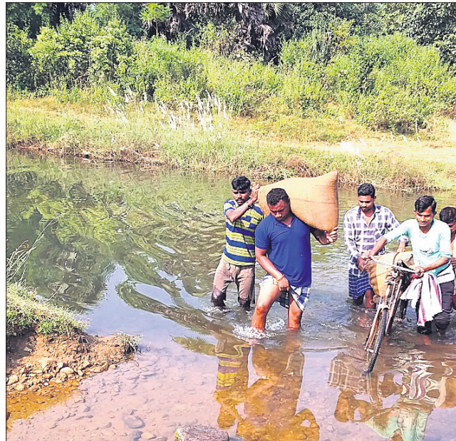
କ୍ରିକ ନ ଥିବାରୁ ଲୋକେ ପାଣିରେ ପଶି ନାଳ ପାର ହେଉଛନ୍ତି ।

ବଲାଙ୍ଗୀର ଜିଲା ଖପ୍ରାଖୋଲ ବ୍ଲକ ମହରାପଦର ପଞ୍ଚାୟତ ଅନ୍ତର୍ଗତ ଗୁଳାମୁଣ୍ଡା ଗାଁ ଗାଁ ଚାରିପଟେ ଘେରି ରହିଛି କଟକ ନାଳ।