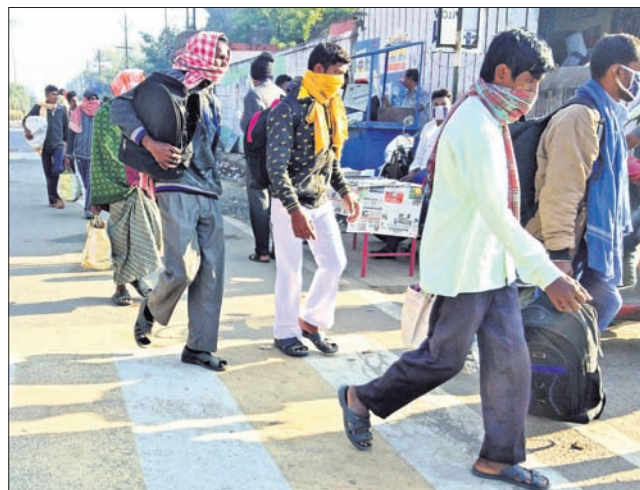
ଘରକୁ ଫେରିବା ପାଇଁ ଶ୍ରମିକମାନେ ବରଗଡ଼ ସରକାରୀ ବସଷ୍ଟାଣକୁ ଆସୁଛନ୍ତି।

ମହାନାରୀ କରୋନା ସଂକ୍ରମଣ ହେବା ପରେ ଅନେକ ଶ୍ରମିକ ଶ୍ରମିକଙ୍କୁ ପଞ୍ଜାବରେ ଉପକାରୀ କରିବା ପାଇଁ ପଞ୍ଜାବର ଖେତକୁ ଯିବାକୁ ସମର୍ଥନ ଦେଉଛନ୍ତି।