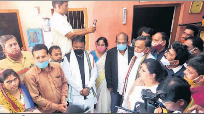
ଯତୁପୁର ଗାଁରେ ଭାଜପା ବିଧାୟକ ଓ ଅନ୍ୟମାନେ।