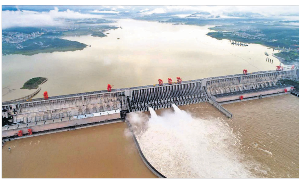
ମିଟର ଏବଂ ଲମ୍ବା ୨.୩୩ କିଲୋମିଟର ହେବା ବୋଲି କୁହାଯାଇଛି। ଚାଇନା ବ୍ରହ୍ମପୁତ୍ର ନଦୀ ଉପରେ ପୂର୍ବରୁ ୧୧ଟି ବନ୍ଧ ନିର୍ମାଣ କରିସାରିଛି। ସେଥି ମଧ୍ୟରେ

ବ୍ରହ୍ମପୁତ୍ର ନଦୀ ଉପରେ ଚାଇନା ବିଶାଳକାୟ ନଦୀବନ୍ଧ ନିର୍ମାଣ କରିବାକୁ ଯାଉଛି। ଏସମ୍ପର୍କରେ ଚାଇନାର ସରକାରୀ ଖବର କାଗଜ ଗ୍ଲୋବାଲ ଟାଇମ୍‌ସ୍‌ରେ ଏକ ରିପୋର୍ଟ ପ୍ରକାଶ ପାଇଛି। ଲଦାଖରେ ଭାରତ ଚାଇନା ମଧ୍ୟରେ ଉତ୍ତେଜନା ଲାଗି ରହିଛି। ଏପରିସ୍ଥିତିରେ ଚାଇନା ଅରୁଣାଚଳ ପ୍ରଦେଶ ନିକଟରେ ବ୍ରହ୍ମପୁତ୍ର ନଦୀର ନିମ୍ନ ଅବସ୍ଥିତିରେ ନଦୀବନ୍ଧ କରିବାକୁ ଉଦ୍ଦେଶ୍ୟ ରଖିଥିବା ଗ୍ଲୋବାଲ ଟାଇମ୍‌ସ୍‌ରେ ଉଲ୍ଲେଖ କରାଯାଇଛି। ଏନେଇ ଚାଇନାର କମ୍ୟୁନିଷ୍ଟ ସରକାରଙ୍କ ପକ୍ଷରୁ ୧୪ ଡିସେମ୍ବର ପ୍ରକାଶିତ ଯୋଜନା ଅନୁସାରେ ଏହି ଯୋଜନା କରାଯାଇଛି। ଏହି ପରିସ୍ଥିତିରେ ଚାଇନା ପକ୍ଷରୁ କୌଣସି ବଜେଟ୍ ଜାରି କରାଯାଇ ନାହିଁ। ତେବେ ଏହାକୁ ନେଇ ଭାରତ ସହିତ ଚାଇନାର ବିବାଦ ଅଧିକ ବଢ଼ିବାର ଆଶଙ୍କା ରହିଛି। ଏହାର ଉଚ୍ଚତା ୧୮୧