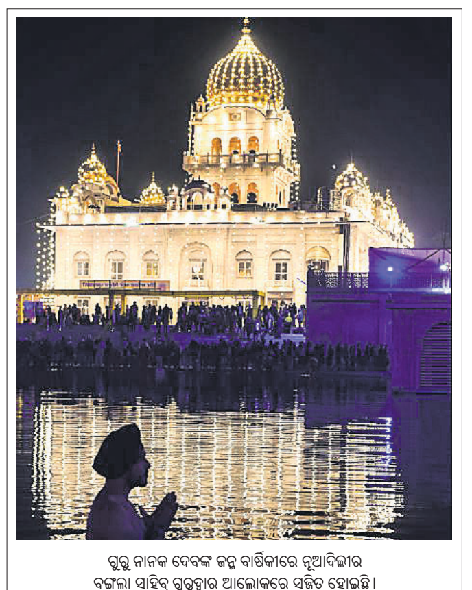
ଗୁରୁ ନାନକ ଦେବଙ୍କ ଜନ୍ମ ବାର୍ଷିକୀରେ ନୂଆଦିଲ୍ଲୀର ବଙ୍ଗଳା ସାହିବ୍ ଗୁରୁଦ୍ୱାର ଆଲୋକରେ ସଜିତ ହୋଇଛି।

କରାଯାଉଛି। ଦିଲ୍ଲୀ ସରକାରୀ ହସ୍ପିଟାଲରେ ଏହି ଟେଷ୍ଟ ମାଗଣାରେ କରାଯାଉଛି। କେଜ୍‌ରିୱାଲ୍ ଟୁଇଟ୍ କରି ଏନେଇ ସ୍ୱୀକୃତି ଦେଇଛନ୍ତି।