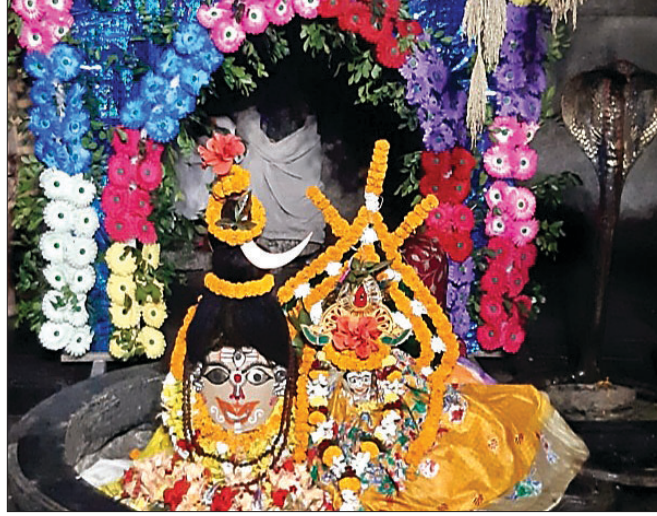
ଆରଡ଼ି, ୩୦।୧୧ (ଡି.ଏନ.ଏ.)

ରାହାସ ପୂର୍ଣ୍ଣିମା ଅବସରରେ ଭଦ୍ରକ ଲିଲାର ପ୍ରସିଦ୍ଧ ଶୈବପୀଠ ଆରଡ଼ିର ଆଖଣ୍ଡକମଣି ମନ୍ଦିରରେ ସୋମବାର ହରଗୌରୀ ବେଶ ଅନୁଷ୍ଠିତ ହୋଇଥିଲା। ବାବା ଆଖଣ୍ଡକମଣିଙ୍କୁ ହର ଓ ମାତା ପାର୍ବତୀଙ୍କୁ ଗୌରୀ ବେଶରେ ସଜିତ କରାଯାଇଥିଲା। କୋଭିଡ୍ କଟକଣା ମଧ୍ୟରେ ସେବାୟତମାନେ ବାବାଙ୍କର ଏହି ପାରମ୍ପାରିକ ବେଶ ସମ୍ପାଦନ କରିଥିଲେ। ସୂଚନା ଅନୁଯାୟୀ, ଭୋର ଟଟାରେ ପହିଲି ପହଡ଼ ଖୋଲାଇଥିଲା। ମଙ୍ଗଳ ଆଳତି ପରେ ପାଠରେ ୧୪୪ ଧାରା ଲାଗିଥିଲା। ଦିନତମାମା ନାତିକାନ୍ତି ଅନୁଯାୟୀ ପୂଜାର୍ଚ୍ଚନା ସମ୍ପାଦିତ ହୋଇଥିଲା। ଅପରାହ୍ଣ ଟଟାରେ ବାବାଙ୍କୁ ହରଗୌରୀ ବେଶରେ ସଜିତ କରାଯାଇଥିଲା। ଏହି ବେଶରେ ପିତଳ ଓ ରୁପାରେ ନିର୍ମିତ ଚକ୍ଷୁ, ନାସା, କର୍ଣ୍ଣ, ଅଧର, ହାର, ମୁକୁଟ ଆଦି ଆରଣ କରିଥିଲେ। ଏହି ବେଶ ଦର୍ଶନ କରିବାକୁ ବଞ୍ଚିତ ହୋଇଛନ୍ତି ଶ୍ରଦ୍ଧାଳୁ। ଦୀର୍ଘବର୍ଷ ମଧ୍ୟରେ ଏଭଳି ପରିସ୍ଥିତି କେବେ ଉପୁଜି ନ ଥିଲା ବୋଲି ବରିଷ୍ଠ ସେବାୟତମାନେ ପ୍ରକାଶ କରିଛନ୍ତି। କେବଳ ସେତିକି ନୁହେଁ ପବିତ୍ର ଶିବଗଙ୍ଗା ପୁଷ୍କରିଣୀରେ ଏବର୍ଷ ଶ୍ରଦ୍ଧାଳୁମାନଙ୍କ ତଳା ଭସାଇବାରେ ପ୍ରଶାସନିକ ରୋକ୍ ଲାଗିଥିଲା। ପାଠରେ ୧୪୪ ଧାରା ଲାଗିଥିଲା ରହିଥିଲା। ପାଠରେ ୧ ପ୍ଲାଟ୍ଟୁନ ପୂଜାର୍ଚ୍ଚନା ସମ୍ପାଦିତ ହୋଇଥିଲା।