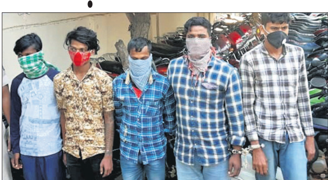
ଗିରଫ ଅଭିଯୁକ୍ତମାନେ ।

ରାଜଧାନୀରେ ସୂଚିତ ଥିବା ବୁଲି ଗାଡ଼ି ଚୋରି ଗ୍ୟାଙ୍ଗ୍ ଧରିଜି କମିଶନରେ ପୋଲିସ୍ ନୟାପଲ୍ଲୀ ଥାନା ପୋଲିସ୍ ବୁଲି ପୃଥକ ମାମଲାରୁ ୪୬ ବାଇକ୍ ଜବତ କରିବା ସହ ସମ୍ପୂର୍ଣ୍ଣ ଥିବା ବୁଲି ଗ୍ୟାଙ୍ଗ୍ ୫ ଜଣଙ୍କୁ ଗିରଫ କରିଛି ।