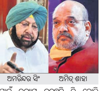
ଅମରିନ୍ଦର ସିଂ (ବାମ) ଅମିର୍ ଶାହା

ଶାହାଙ୍କୁ ଭେଟିଲେ ଅମରିନ୍ଦର ନୂଆଦିଲ୍ଲୀ, ୩୧୧୨ (ପି.ଟି.): ପଞ୍ଜାବ ମୁଖ୍ୟମନ୍ତ୍ରୀ ଅମରିନ୍ଦର ସିଂ ରୁକୁଣାର ସ୍ୱରାଷ୍ଟ୍ରମନ୍ତ୍ରୀ ଅମିର୍ ଶାହାଙ୍କୁ ଭେଟି କେନ୍ଦ୍ର ବିବାଦୀୟ କୃଷି ଆଇନ ସମ୍ପର୍କରେ ଆଲୋଚନା କରିଛନ୍ତି। ସେ ଶାହା ଓ ବିକ୍ଷୋଭରେ ଚାଷୀଙ୍କୁ ଅଚଳାବସ୍ଥାରେ ସମାଧାନ ରାସ୍ତା ସ୍ୱତନ୍ତ୍ର ବାହାର କରିବାକୁ ଅନୁରୋଧ କରିଛନ୍ତି। କୃଷକ ଆଲୋଚନା ପଞ୍ଚାବର ଅର୍ଥନୀତି ଓ ଦେଶର ଜାତୀୟ ସୁରକ୍ଷାକୁ ପ୍ରଭାବିତ କରୁଥିବା ସେ କହିଛନ୍ତି। ଶାହାଙ୍କୁ ଭେଟିବା ପରେ ତାଙ୍କ ବାସଭବନ ଆଗରେ ଅମରିନ୍ଦର କହିଛନ୍ତି, ଏହି ପ୍ରସଙ୍ଗରେ ଉଭୟ ପକ୍ଷ ଜିଦ୍ ରଖିବା ଅନୁଚିତ। ଏକ ମଧ୍ୟମ ପକ୍ଷ ରୁରତ୍ତ ବାହାର କରାଯିବା ଜରୁରୀ। କେନ୍ଦ୍ର ଓ କୃଷକଙ୍କ ମଧ୍ୟରେ ସେ ମଧ୍ୟସ୍ଥତା