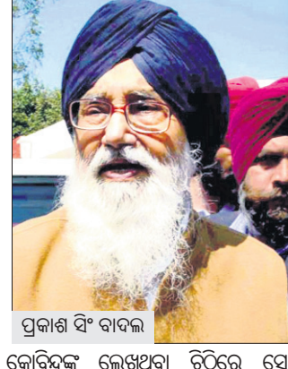
ପ୍ରକାଶ୍ ସିଂ ବାଦଲ

‘ଅନ୍ୟ କିଛି ଗୁରୁତ୍ୱ କଲେ ଦେଶ ସହ ବିଶ୍ୱାସଘାତ’ ଏକାମ୍ର କୃଷି ଆଇନ ପ୍ରତ୍ୟାହାର ପରିଚ୍ଛେଦ ଅନ୍ୟ କିଛି ଗୁରୁତ୍ୱ କଲେ ଦେଶ ଓ କୃଷକମାନଙ୍କ ସହ ବିଶ୍ୱାସଘାତ ହେବ ବୋଲି ପୁରୁଷାର କଂଗ୍ରେସ ନେତା ରାହୁଲ ଗାନ୍ଧୀ କହିଛନ୍ତି। ପଞ୍ଜାବ ମୁଖ୍ୟମନ୍ତ୍ରୀ ଅମରିନ୍ଦର ସିଂ ଓ ସ୍ୱରାଷ୍ଟ୍ରମନ୍ତ୍ରୀ ଅମିର୍ ଶାହାଙ୍କ ମଧ୍ୟରେ ସମାଧାନ ପକ୍ଷରୁ ବାହାର କରିବା ପାଇଁ ଆଲୋଚନା ପରିଚ୍ଛେଦ ଯୋଗୁଁ କୃଷକଙ୍କୁ ଏହି ମନୋଭାବ ଆସିଛି।