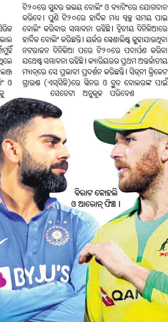
ବିରାଟ କୋହଲି ଓ ଆରୋନ୍ ଫିଣ୍ଡି ।

ଭାରତ ଓ ଘରୋଇ ଅଷ୍ଟ୍ରେଲିଆ ମଧ୍ୟରେ ଟି୨୦ ସିରିଜ୍ ଶୁକ୍ରବାରଠାରୁ ଆରମ୍ଭ ହେବ। ସ୍ଥାନୀୟ ମନୁଜା ଓଭାଲ ଗ୍ରାଉଣ୍ଡରେ ଉଭୟ ଦେଶ ପ୍ରଥମ ଟି୨୦ରେ ମୁହାଁମୁହିଁ ହେବେ। ଦିନିକିଆ ସିରିଜରେ ୧-୨ରେ ପରାସ୍ତ ହୋଇଥିଲେ ମଧ୍ୟ ଭାରତ ଟି୨୦ରେ ଅଷ୍ଟ୍ରେଲିଆକୁ କଡ଼ା ଚ୍ୟାଲେଞ୍ଜ ଦେବ। ଦିନିକିଆ ସିରିଜ ପରାଜୟ ଭାରତର ବୋଲିଂ ଓ ଫିଲ୍ଡିଂ ଦୁର୍ବଳତାକୁ ପଦାରେ ପକାଇଛି। ତେଣୁ ଭାରତକୁ ଆଗକୁ ବନ୍ତୁତ କିଛି କାର୍ଯ୍ୟ କରିବାକୁ ହେବ। ସବୁଠାରୁ ଛୋଟ ଫର୍ମାଟ୍‌ରେ ଭାରତକୁ ଆହୁରି ଏକ ସବୁଜିତ ଦଳ ଚୟନ କରିବାକୁ ହେବ। କୋଭିଡ୍-୧୯ ମହାମାରୀ କାରଣରୁ ସାରା ବିଶ୍ୱରେ କ୍ରୀଡ଼ା ବନ୍ଦ ହେବା ପୂର୍ବରୁ ଭାରତ ଆୟୋଜକ ନ୍ୟୁଜିଲାଣ୍ଡକୁ ଟି୨୦ ସିରିଜରେ ୫-୦ରେ ପରାସ୍ତ କରିଥିଲା। ତେଣୁ ଏହି କ୍ଲିନ୍ ସ୍କୁଇପରୁ ଭାରତ ଏବେ ଅଷ୍ଟ୍ରେଲିଆ ବିପକ୍ଷରେ ପ୍ରେରଣା ପାଇବା ସହ ଆତ୍ମବିଶ୍ୱାସକୁ ଆହୁରି ବୃଦ୍ଧ କରିବ। ଦିନିକିଆ ପଦାର୍ପଣରେ ଭଲ ପ୍ରଦର୍ଶନ କରିଥିବା ଯକ୍ଷର ସେଣ୍ଟିନେଲ୍ ଟି. ନନ୍ଦାକନ, ଖୁଣ୍ଟିଚନ୍ ସୁନ୍ଦର, ଦୀପକ ଚନ୍ଦର ଭାରତୀୟ ବୋଲିଂ ବିଭାଗରେ ସବୁଜନ ଆଣିବେ। ରୟାଲ ଚ୍ୟାଲେଞ୍ଜର୍ସ ବାଙ୍ଗାଲୋର ତରଫରୁ ଇଣ୍ଡିଆନ୍ ପ୍ରିମିୟର ଲିଗ୍ (ଆଇପିଏଲ୍) ଖେଳି ସୁନ୍ଦର ପ୍ରଭାବୀ ପ୍ରଦର୍ଶନ କରିଥିଲେ। ଅଧିନାୟକ ବିରାଟ କୋହଲି ଆଇପିଏଲ୍‌ରେ ପାଞ୍ଚୋଟି ଟ୍ରେନ୍ ଓ ମିଲିକ ଓଭରରେ ସୁନ୍ଦରକୁ ବୋଲିଂ କରିବାର ସୁଯୋଗ ଦେଇଥିଲେ। ସୁନ୍ଦର ମଧ୍ୟ ମିଲିଥିବା ସୁଯୋଗର ଫାଇଦା ଉଠାଇ ଭଲ ପ୍ରଦର୍ଶନ କରିଥିଲେ। ଦିନିକିଆରେ ହାର୍ଡିକ ପାଣ୍ଡା ନିୟମିତ ବୋଲିଂ କରି ନ ଥିବାରୁ ଦଳରେ ଏକମାତ୍ର ସେଣ୍ଟିନେଲ୍ ଆଲରାଉଣ୍ଡର ଭାବେ ରବୀନ୍ଦ୍ର କାଟେକ୍ଟଙ୍କୁ ସ୍ଥାନ ମିଳିଥିଲା। ତେବେ