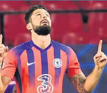
ଚାମ୍ପିୟନ୍ ଲିଗ୍ରେ ହାସଲ କରିବା ଅଭିଜ୍ଞ ଗିରୋଡ୍

ସେଭିଲି (ସେବ), ୩୧୨ (ଏପି) ଚାମ୍ପିୟନ୍ ଲିଗ୍ ଫୁଟବଲ ବୃତ୍ତିମତରେ ସବୁଠାରୁ ବୟସ୍କ ଖେଳାଳି ଭାବେ ହାସଲ କରୁଛନ୍ତି ଚେଲ୍ସି ଖିଲ୍ଲାଇକର ଅଭିଜ୍ଞ ଗିରୋଡ୍। ସେଭିଲି ବିପକ୍ଷରେ ମ୍ୟାଚରେ ୪ ଗୋଲ ଖୋର କରି ତାଙ୍କ ଦଳକୁ ୪-୦ ଗୋଲରେ ବିଜୟୀ କରାଇଛନ୍ତି। ଏହାଦ୍ୱାରା ଚେଲ୍ସି ଗୁପ୍ତ-୩ ରେ ପ୍ରଥମ ସ୍ଥାନ ଅଧିକାର କରିଛି। ୧୯୬୫ରେ ଯୁରୋପିଆନ୍ କପ୍ ଏକ ମ୍ୟାଚରେ ଫେରେନ୍ସ ପୁଲ୍ୟାସ ୩ ଗୋଲ ଖୋର କରିବାପରେ ୩୪ ବର୍ଷ ବୟସରେ ଏକ ପ୍ରତିଯୋଗିତାରେ ହାସଲ କରିବାରେ ଗିରୋଡ୍ ସବୁଠାରୁ ବୟସ୍କ ଖେଳାଳି ହେବାର ଗୌରବ ଅର୍ଜନ କରିଛନ୍ତି। ପ୍ରାୟ ୧୫ ଅର୍ଡର ଡିମାଣ୍ଡ ଖିଲ୍ଲାଇକର ୮ମ ଓ ୫୪ତମ ମିନିଟ୍ରେ ନିଖୁଣ ଶର୍ତ୍ତ ମାରି ଗୋଲ ଖୋର କରିଥିଲେ। ପରେ ୬୪ତମ ମିନିଟ୍ରେ ଏକ ହେଡରେ ଅଭିଜ୍ଞ ଗିରୋଡ୍ ସେଭିଲି ବିପକ୍ଷରେ ଏବଂ ୮୩ ତମ ମିନିଟ୍ରେ ଏକ ପେନାଲ୍ଟି ଚେଲ୍ସି କୋର୍ଟ ପ୍ରାକ୍ ଲାମ୍ପାର୍ଡ। ଗିରୋଡ୍ ଏହା ପୂର୍ବରୁ ଆଉ ଥରେ ୪ଗୋଲ ଖୋର କରିଥିଲେ। ପ୍ରାୟ ୨୧ ରୁ ୨୯ ଦଳ ତରଫରୁ ଖେଳୁଥିବାବେଳେ ଗୋଟିଏ ମ୍ୟାଚରେ ସେ ୪ଟି ଗୋଲ ଦେଇଥିଲେ। ଚାମ୍ପିୟନ୍ ଲିଗ୍ରେ ଚେଲ୍ସି ତରଫରୁ ହାସଲ କରିବାରେ ଗିରୋଡ୍ ୨୦୦୬ରେ ଡିଏସ୍ ଗ୍ରୋଗ୍ସ ଏହି ସଫଳତା ହାସଲ କରିଥିଲେ।