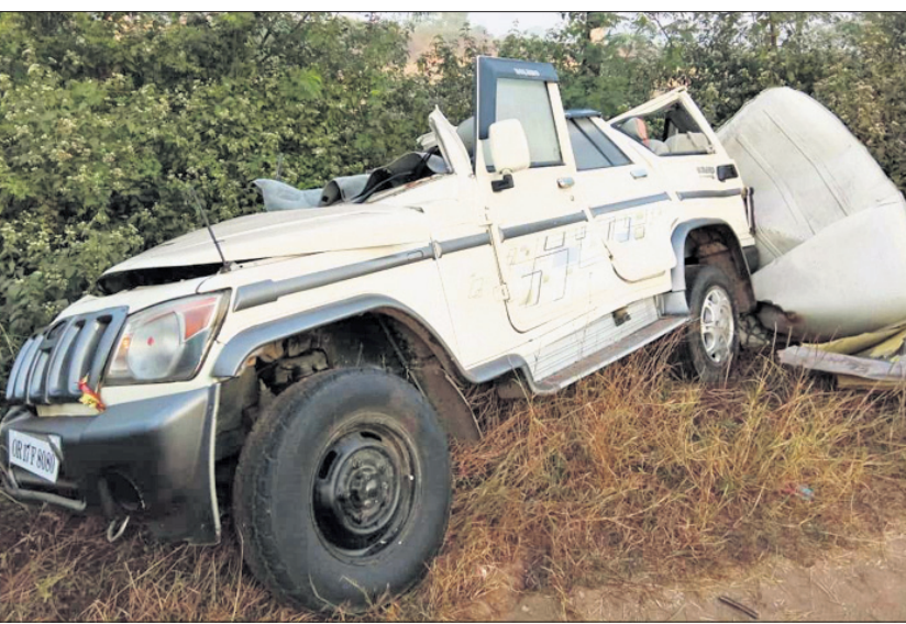
ଦୁର୍ଘଟଣାରେ ବୁଲୁଥିବା ବସଯାତ୍ରୀ ଗାଡ଼ି