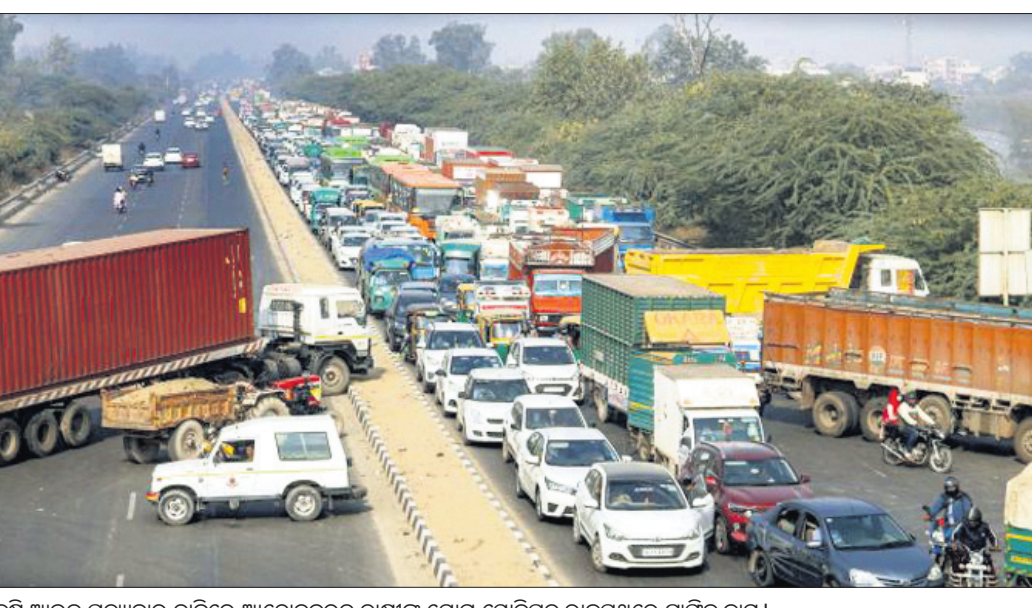
କୃଷି ଆଇନ ପ୍ରତ୍ୟାହାର ଦାବିରେ ଆଲୋଚନାରେ ଚାଷୀଙ୍କ ଯୋଗୁଁ ସୋନିପତ୍ ସିନ୍ଧୁରେ ଗ୍ରାମ୍ୟ କ୍ୟାମ୍ପ।

ନୂଆଦିଲ୍ଲୀ, ୩୧୧୨ ୩ ନୂଆ କୃଷି ଆଇନ ପ୍ରତ୍ୟାହାର ଦାବିରେ ପଞ୍ଜାବ, ହରିୟାଣା ଓ ଉତ୍ତରପ୍ରଦେଶ ସମେତ ଅନ୍ୟ ରାଜ୍ୟଗୁଡ଼ିକର ଚାଷୀମାନେ ଚଳାଇଥିବା ଆଲୋଚନା ରୁକୁଣାରେ ଅସ୍ତମ୍ଭୁତ ଦିନରେ ପହଞ୍ଚିଛି। ଦିଲ୍ଲୀରୁ ରୁରାଡ଼ିସ୍ଥିତ ନିରଙ୍କାବା ପଡ଼ିଆ ସମେତ ଜାତୀୟ ରାଜଧାନୀ ସୀମାରେ ବିଭିନ୍ନ କୃଷକ ସଙ୍ଘଠନ ପକ୍ଷରୁ ବିକ୍ଷୋଭ ଅଚଳାବସ୍ଥାରେ ସମାଧାନ ରାସ୍ତା ସ୍ୱତନ୍ତ୍ର ଅଧିବେଶନ ଡାକି ବିବାଦୀୟ କୃଷକ ଆଲୋଚନା କୃଷି ଆଇନକୁ ପ୍ରତ୍ୟାହାର କରିବା ସହ ସର୍ବନିମ୍ନ ସହାୟକ ମୂଲ୍ୟ (ଏଏଏସ୍) ସୁରକ୍ଷିତ କରିବା ପାଇଁ ନୂଆ ଆଇନ ଆଣନ୍ତୁ ବୋଲି ଚାଷୀମାନେ ଅନୁରୋଧ କରୁଛନ୍ତି। ନଚେତ୍ ଦିଲ୍ଲୀକୁ ସିଲ୍ କରିଦିଆଯିବ ବୋଲି ସେମାନେ ଚେତାବନା ଦେଇଛନ୍ତି। ଏହି ଅଚଳାବସ୍ଥା ଦୂର କରିବା ପାଇଁ କେନ୍ଦ୍ର ସରକାର ଓ ପ୍ରାୟ ୪୦ ଚାଷୀ ନେତାଙ୍କ ମଧ୍ୟରେ ହୋଇଥିବା ଚର୍ଚ୍ଚା