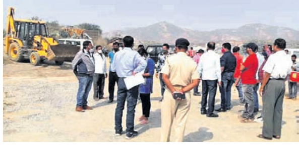
କ୍ରଶର ଭଙ୍ଗାଗଲା ବେଳେ ଉପସ୍ଥିତ ପ୍ରଶାସନିକ ଅଧିକାରୀ ଓ ଅନ୍ୟମାନେ।