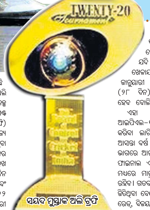
ସମ୍ବନ୍ଧ ମୁଖ୍ୟ ଅଂଶ ଗୁପ୍ତ