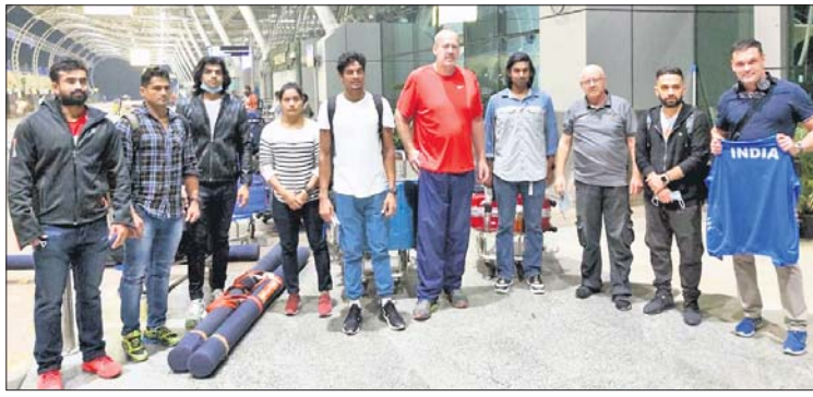
ଭାରତୀୟ ଜାଭେଲିନ୍ ଥ୍ରୋ ଦଳର ଏଲିଟ୍ ସଦସ୍ୟ ଓ ସପୋର୍ଟ ସ୍ଟାଫ୍‌ମାନେ।

ଭାରତୀୟ ଜାଭେଲିନ୍ ଥ୍ରୋ ଦଳର ଏଲିଟ୍ ଆଥଲେଟ୍‌ମାନେ ଗୁରୁବାର ଭୁବନେଶ୍ୱରରେ ପହଞ୍ଚିଛନ୍ତି। ଉତ୍ତରାଖଣ୍ଡରେ ଶୀତ ଲହରୀ ଯୋଗୁ ଆଥଲେଟିକ୍ସ ଫେଡେରେଶନ ଅଫ ଇଣ୍ଡିଆ (ଏଏଫଆଇ) ପଟିଆଲାସ୍ଥିତ ଏହାର ଟ୍ରେନିଂସେଣ୍ଟର ଜାଭେଲିନ୍ ଥ୍ରୋ ଦଳକୁ ଭୁବନେଶ୍ୱର ଗୁମାସ୍ତା କରାଇ ନୀରଜ ଚୋପ୍ରା ଓ ଶିବପାଲ ସିଂହଙ୍କ ସମେତ ଜାଭେଲିନ୍ ଦଳର ଏଲିଟ୍ ସଦସ୍ୟମାନେ ଭୁବନେଶ୍ୱରସ୍ଥିତ କଳିଙ୍ଗ ସ୍ମାଡିୟମରେ ଅଲିମ୍ପିକ୍ ପ୍ରସ୍ତୁତି ପାଇଁ ଟ୍ରେନିଂ ନେବେ। ଏଏଫଆଇ ଅନୁରୋଧ ରକ୍ଷା କରି ଓଡ଼ିଶା ସରକାର ଟ୍ରେନିଂ କ୍ୟାମ୍ପ ପାଇଁ ସମସ୍ତ ପ୍ରକାର ସୁବିଧା ସୁଯୋଗ ଯୋଗାଇ ଦେଇଛନ୍ତି। ନୀରଜ ଓ ଶିବପାଲଙ୍କ