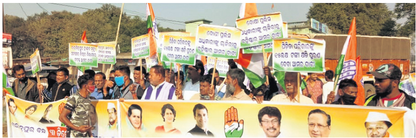
ବୀରମିତ୍ରପୁରରେ କଂଗ୍ରେସ ଦଳ ପକ୍ଷରୁ ବନ୍ଦ ଡାକିବାରେ ସାମିଲ କର୍ମୀମାନେ ।