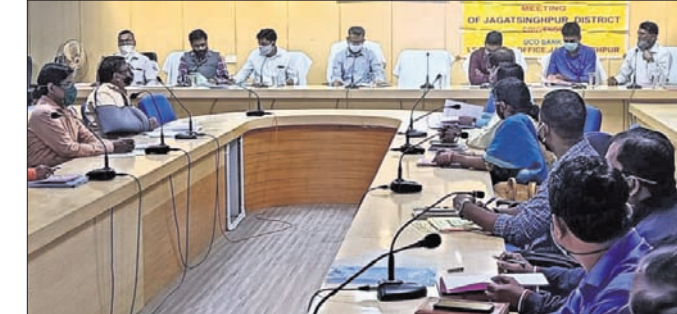
ଜିଲ୍ଲାପ୍ରଧାନ ସମାକ୍ଷୀ ବୈଠକରେ ଜିଲ୍ଲାପାଳ ଓ ଅନ୍ୟମାନେ।