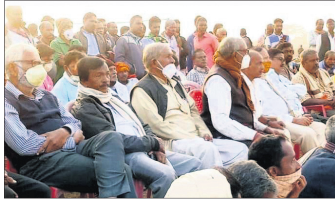
ବରୁଣାଡ଼ିଆଠାରେ ଅନୁଷ୍ଠିତ ବୈଠକ।

କେନ୍ଦ୍ରାପଡ଼ା ଅଧିକାରକନିକା/ଆଲି, ୩୧୨ (ଡି.ଏନ.ଏ.)