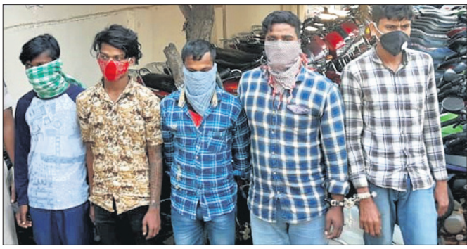
ଗିରଫ ଅଭିଯୁକ୍ତମାନେ ।

ରାଜଧାନୀରେ ସୂଚକ ଥିବା ଦୁଇଟି ଗାଡ଼ି ଚୋରି ଗ୍ୟାଙ୍ଗ୍ ଧରିତ କମିଶନରେ ଘୋଷଣା ନୟାପଲ୍ଲୀ ଥାନା ପୋଲିସ୍ ଦୁଇ ପୁଅକ ମାମଲାରେ ୪୬ ବାଇକ୍ ଜବତ କରିବା ସହ ସମ୍ପୂର୍ଣ୍ଣ ଥିବା ଦୁଇ ଗ୍ୟାଙ୍ଗ୍ ୫ ଜଣଙ୍କୁ ଗିରଫ କରିଛି । ଏଥିସହ ଅଧିକାଂଶ ଚୋରା ଗ୍ୟାଙ୍ଗ୍ ଉଦ୍ଧାରଣ କରାଯାଇଛି ।