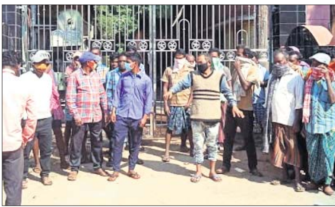
ପଞ୍ଚାୟତ କାର୍ଯ୍ୟାଳୟ ଗେଟ ସମ୍ମୁଖରେ ଉଦ୍ଧୃତ ଗ୍ରାମବାସୀ।

ହୋଇ ନ ଥିବାରୁ ଗ୍ରାମବାସୀ ଅସନ୍ତୋଷ ପ୍ରକାଶ କରିଥିଲେ। ଦୀର୍ଘଦିନ ଧରି ଏହି କାର୍ଯ୍ୟ ଚାଲି ଆସୁଥିବା ବେଳେ ସୂଚନା ଫଳକରେ ବିଭାଗ ପକ୍ଷରୁ କୌଣସି ସୂଚନା ପ୍ରଦାନ କରାଯାଇ ନାହିଁ। ଫଳରେ ପ୍ରକଳ୍ପ ଶେଷ ହେବା ନେଇ ସନ୍ଦେହ ଉତ୍ପନ୍ନ ହେଲା। ଏହାକୁ ନେଇ ପଞ୍ଚାୟତରେ ଥିବା ୪ଟି ଗ୍ରାମର ଗ୍ରାମବାସୀ କାର୍ଯ୍ୟାଳୟରେ ତାଲା ପକାଇ ବିରୋଧ କରିଥିଲେ। ପ୍ରତିଶ୍ରୁତି ମୁତାବକ କାର୍ଯ୍ୟ ସମ୍ପୂର୍ଣ୍ଣ ନ ହେଲେ ଆନ୍ଦୋଳନରୁକ୍ତ ପକ୍ଷ ଅବଲମ୍ବନ କରିବେ ବୋଲି ପଞ୍ଚାୟତବାସୀ ଚେତାବନୀ ଦେଇଛନ୍ତି।