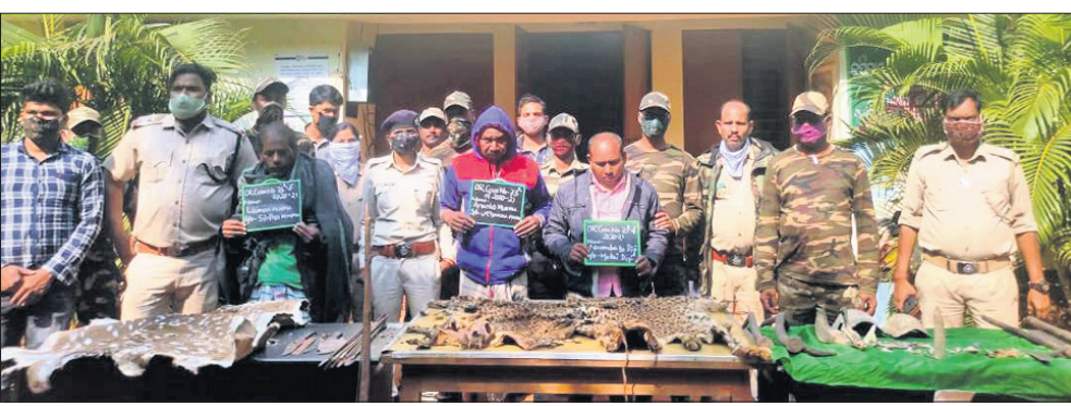
ଗିରଫ ଅଭିଯୁକ୍ତଙ୍କ ସହ ବନ କର୍ମଚାରୀ।

ଢେଙ୍କାନାଳ ଅପ୍ରିଲ ୨୧ ଅଭୟାରଣ୍ୟର ନିଷିଦ୍ଧାଞ୍ଚଳରେ ରାଜୁତି କରୁଛନ୍ତି ସେବାଦାର ଶିକାରୀ। ରାତି ଅଧରେ ଗରୁଡ଼ି ଦେଶୀ ବନ୍ଧୁକ। ଚଳି ପଡ଼ୁଛନ୍ତି ବାଘ, ବାରହା, ହରିଣ, ଶମ୍ଭର, ଭାଲୁ ଭଳି ବନ୍ୟଜୀବ। ବିଦ୍ୟୁତ୍ ପୋଖି ବସାଇ ମରାଯାଉଛି ହାତୀ। ଚଢ଼ାଦରରେ ବିକ୍ରି କରାଯାଉଛି କରୁ ମାଂସ। ଦାନ୍ତ, ଶିଙ୍ଗ, ଚମଡ଼ା, ନଖ ଚାଲାଇ କରାଯାଉଛି। ଅଭୟାରଣ୍ୟରୁ ସହରରେ ପହଞ୍ଚିବା ପରେ ଏସବୁ ଅଙ୍ଗପ୍ରତ୍ୟଙ୍ଗ ମୂଲ୍ୟ ବହୁତୁଣ୍ଡା ବଢ଼ିଯାଉଛି। ଏଥିରେ ବିଧିବଦ୍ଧ ଭାବେ କାମ କରୁଛି ଏକ ରାମାକେଟ୍। ଶିକାରୀଙ୍କ ଗ୍ରାମ୍ କରନ୍ତର ପାଇଁ ଡେଙ୍କାନାଳରୁ ଏପରି ବେଆଇନ କାରବାରର ଚେର ଖୋଜି, କଟକ ସମେତ ବାହାର ରାଜ୍ୟରେ ପହଞ୍ଚାଇବା। ଗତ ଶନିବାର ରାତିରେ କପିଳାସ ଅଭୟାରଣ୍ୟରେ ଶିକାରୀ-ବନ କର୍ମଚାରୀଙ୍କ ମଧ୍ୟରେ ଚାଲି ବିନାମୟ ହୋଇଥିଲା। ଚଢ଼ାଉ ବେଳେ ୫ ଅଭିଯୁକ୍ତ ଧରାପଡ଼ିଥିବାବେଳେ ୪ ଦେଶୀ