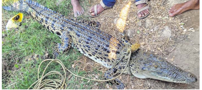
ନଦୀରୁ ଉଦ୍ଧାର କୁମ୍ଭୀର। ବନବିଭାଗକୁ ଖବର ଦିଆଯାଇଥିଲା। ସହାୟତା ପରେ ଗ୍ରାମବାସୀ ଉଦ୍ଧାର ବାହାବଳପୁର ବନବିଭାଗ କର୍ମଚାରୀ କୁମ୍ଭୀରକୁ ହସ୍ତାନ୍ତର କରିଥିଲେ।

ବାଲେଶ୍ୱର ସଦର ବ୍ଲକ ଅନ୍ତର୍ଗତ ଛାନ୍ଦୁଆ ଘଡ଼େଇ ଛକ ନିକଟ ପଞ୍ଚୁପଡ଼ା ନଦୀରୁ ସୋମବାର ଗାଁ ଲୋକେ ଏକ କୁମ୍ଭୀର ଉଦ୍ଧାର କରିଛନ୍ତି। କୁମ୍ଭୀର ଲମ୍ବ ୬ ଫୁଟ୍, ୪ଦିନ ଧରି ନଦୀର ଏହି ସ୍ଥାନରେ ୩/୪ଟି କୁମ୍ଭୀର ଉପାତ କରୁଥିବା ସ୍ଥାନୀୟ ଲୋକେ ଦେଖି ଭୟଭୀତ ହୋଇଯାଇଥିଲେ। ଗାଁ ଲୋକେ ଜାଲ ପକାଇବା ସମୟରେ ଏକ କୁମ୍ଭୀର ଲାଗିଥିଲା। ଏ ସମ୍ପର୍କରେ