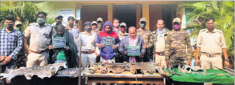
ଗିରଫ ଅଭିଯୁକ୍ତଙ୍କ ସହ ବନ କର୍ମଚାରୀ।

ଢେଙ୍କାନାଳ ଅଫିସ, ୭।୧୨ ଅଭୟାରଣ୍ୟର ନିଷିଦ୍ଧାଞ୍ଚଳରେ ରାଜୁତି କରୁଛନ୍ତି ପେସାଦାର ଶିକାରୀ। ରାତି ଅଧରେ ଗର୍ଜୁଛି ଦେଶୀ ବନ୍ଧୁକ। ଚଳି ପଡୁଛନ୍ତି ବାଘ, ବାରହା, ହରିଣ, ଶମ୍ବର, ଭାଲୁ ଭଳି ବନ୍ୟଜୀବ। ବିଦ୍ୟୁତ୍ ଫାଶ ବସାଇ ମରାଯାଉଛି ହାତୀ। ଚଢ଼ାଦରରେ ବିକ୍ରି କରାଯାଉଛି ଜନ୍ତୁ ମାଂସ। ଦାନ୍ତ, ଶିଙ୍ଗ, ଚମଡ଼ା, ନଖ ଚାଲାଣ କରାଯାଉଛି। ଅଭୟାରଣ୍ୟରୁ ସହରରେ ପହଞ୍ଚିବା ପରେ ଏସବୁ ଅଙ୍ଗପ୍ରତ୍ୟଙ୍ଗ ମୂଲ୍ୟ ବହୁଗୁଣା ବଢ଼ିଯାଉଛି। ଏଥିରେ ବିଧିବଦ୍ଧ ଭାବେ କାମ କରୁଛି ଏକ ର୍ୟାକେଟ୍। ଶିକାରୀଙ୍କ ଗ୍ରାମ୍ କରିଡର ପାଲଟିଥିବା ଢେଙ୍କାନାଳରୁ ଏପରି ବେଆଇନ କାରବାରର ତେର ଖୋର୍ଦ୍ଧା, କଟକ ସମେତ ବାହାର ରାଜ୍ୟରେ ପହଞ୍ଚିଲାଣି। ଗତ ଶନିବାର ରାତିରେ କପିଳାସ ଅଭୟାରଣ୍ୟରେ ଶିକାରୀ-ବନ କର୍ମଚାରୀଙ୍କ ମଧ୍ୟରେ ବୁଲି ବିନିମୟ ହୋଇଥିଲା। ଚଢ଼ାଉ ବେଳେ ୫ ଅଭିଯୁକ୍ତ ଧରାପଡ଼ିଥିବାବେଳେ ୪ ଦେଶୀ