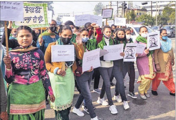
ପଞ୍ଜାବର ଜଳନ୍ଧରରେ 'ଭାରତ ବନ୍ଦ' ସପକ୍ଷରେ ଆନ୍ଦୋଳନକୁ ଓହ୍ଲାଇଛନ୍ତି କଲେଜ ଛାତ୍ରୀ।