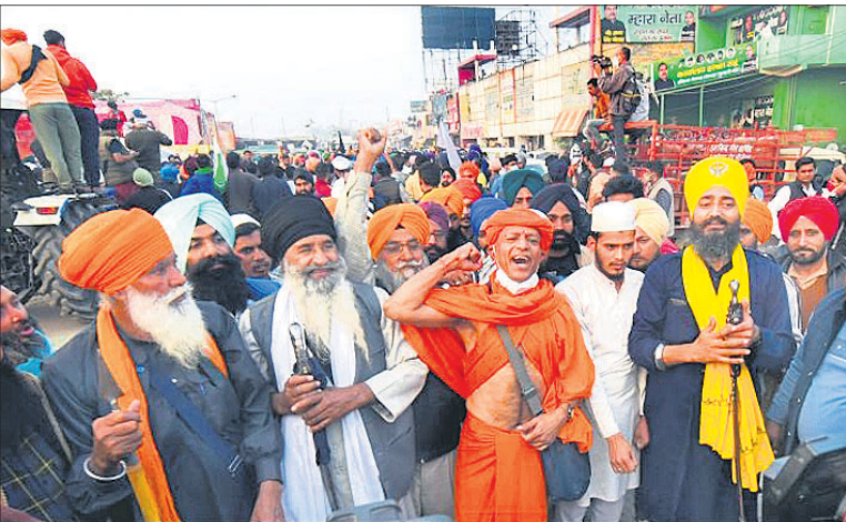
ନୂଆଦିଲ୍ଲୀ: କୃଷକ ଆନ୍ଦୋଳନରେ ବିଭିନ୍ନ ସମ୍ପ୍ରଦାୟର ଆଧ୍ୟାତ୍ମିକ ଗୁରୁ ସାମିଲ ହୋଇଛନ୍ତି।