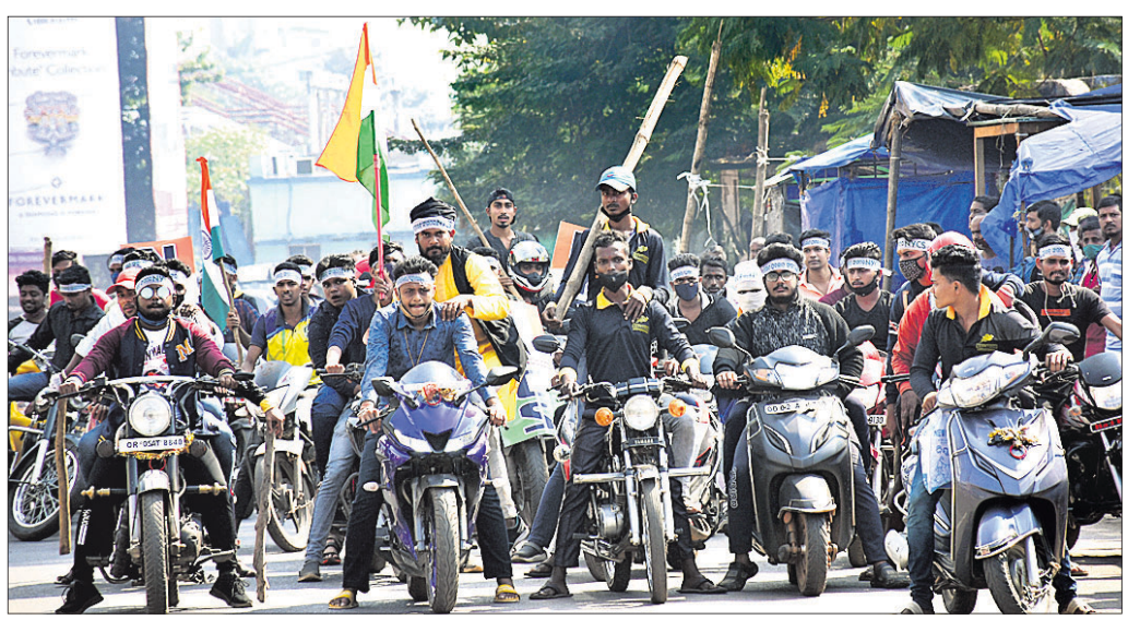
ନବନିର୍ମାଣ କୃଷକ ମୁବ ସଙ୍ଗଠନ ପକ୍ଷରୁ ଭୁବନେଶ୍ୱର ରେଳଷ୍ଟେଶନ ରାସ୍ତାରେ ବାଇକ୍ ଶୋଭାଯାତ୍ରା।

କେନ୍ଦ୍ର ସରକାରଙ୍କ ନୂତନ କୃଷି ଆଇନ ପ୍ରତ୍ୟାହାର ଦାବିରେ ମଙ୍ଗଳବାର ଭାରତ ବନ୍ଦ ପ୍ରଭାବ ରାଜଧାନୀ ଭୁବନେଶ୍ୱରରେ ଦେଖିବାକୁ ମିଳିଥିଲା। ଆନ୍ଦୋଳନରେ ବିଭିନ୍ନ ରାଜନୈତିକ ଦଳ, ଟ୍ରେଡ ୟୁନିୟନ ଓ ମାଜିଷ୍ଟ୍ରେଟ୍ ସାମିଲ ହୋଇଥିଲେ। ବିଭିନ୍ନ ସ୍ଥାନରେ ରାସ୍ତାବନ୍ଦୀ, ପିକେଟିଂ ପାଳିବାକୁ ଧାରଣା, ବିକ୍ଷୋଭ ଓ ଶୋଭାଯାତ୍ରା ଯୋଗୁଁ ଗାଡ଼ି ମୋଟର, ରେଳ ଚଳାଚଳ ବ୍ୟାହତ ହୋଇଥିଲା। ସେହିପରି ସମସ୍ତ ସରକାରୀ ଓ ବେସରକାରୀ କାର୍ଯ୍ୟାଳୟ ସମେତ ଦୋକାନ ବଜାର ବନ୍ଦ ରହିଥିଲା। ଜାତୀୟ ରାଜପଥର ଉଭୟ ପାର୍ଶ୍ୱରେ ଦୀର୍ଘ ସମୟ ଧରି ଯାନବାହନ ଅଟକି ରହିଥିଲା। କେତେକ ସ୍ଥାନରେ