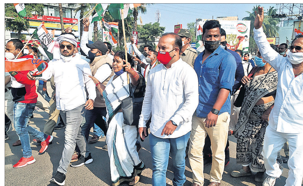
ବାଦାମବାଡି ଗ୍ରାମିକ୍ ଛକରେ କଟକ ନଗର ଜିଲା କଂଗ୍ରେସ ପକ୍ଷରୁ ବିକ୍ଷୋଭ।