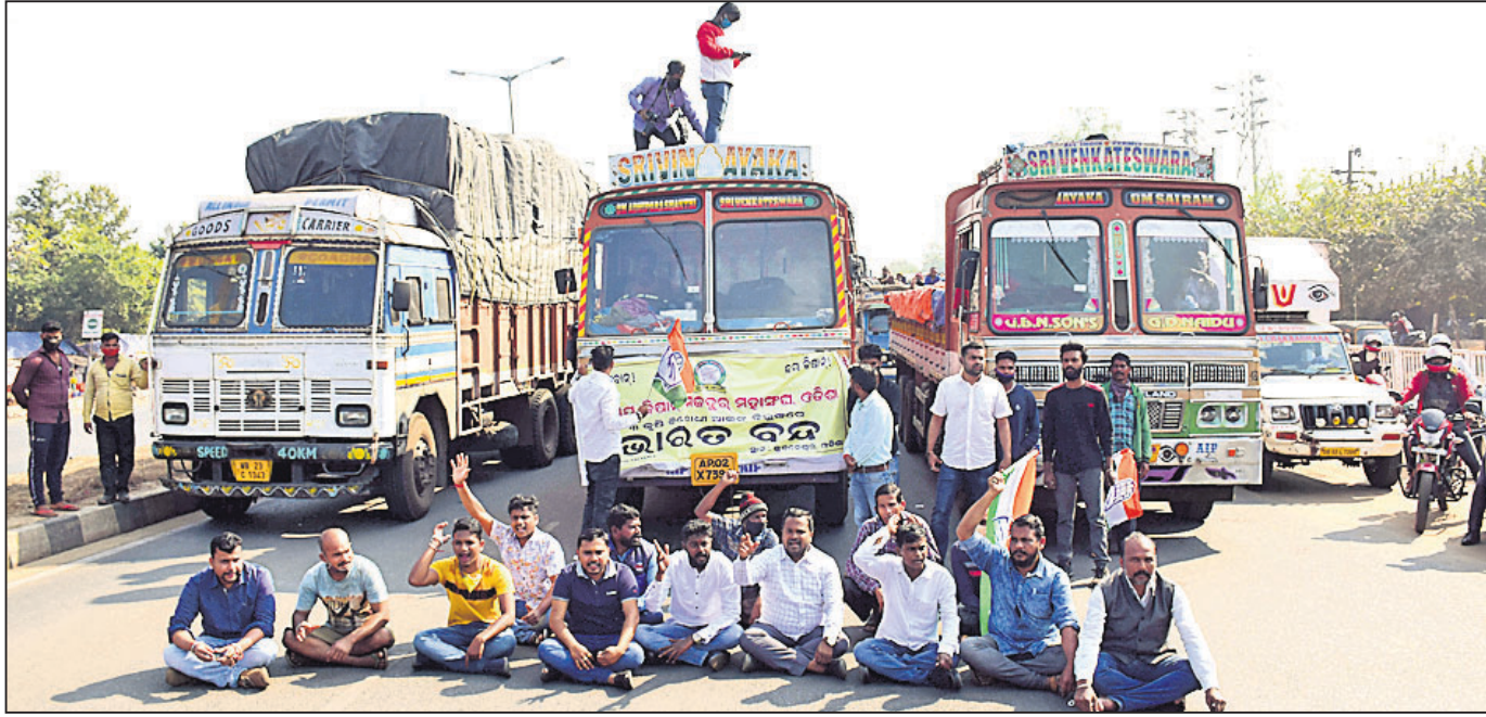
ଭୁବନେଶ୍ୱର ବାଣାଦିହାର-ସର୍ବସଙ୍ଗ ରାସ୍ତାକୁ ଆନ୍ଦୋଳନକାରୀମାନେ ଅବରୋଧ କରିଛନ୍ତି ।