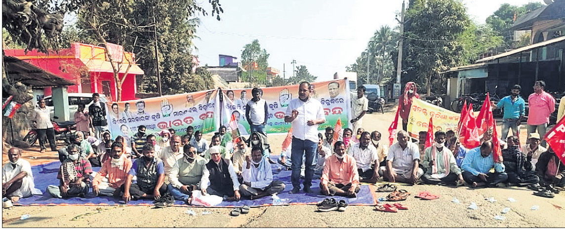
ଖୋର୍ଦ୍ଧାରେ ବୋଲଗଡ଼ଠାରେ ୫୭ ନଂ. କାଟାୟ ରାଜପଥ ଅବରୋଧ କରାଯାଇଛି।