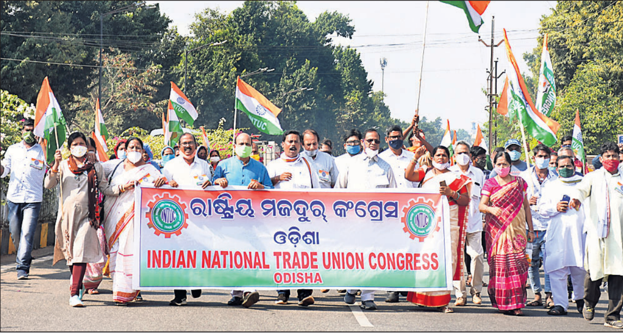
ରାଷ୍ଟ୍ରୀୟ ମଜଦୁର କଂଗ୍ରେସ ଓଡ଼ିଶା ଶାଖା ପକ୍ଷରୁ ଶୋଭାଯାତ୍ରା ।