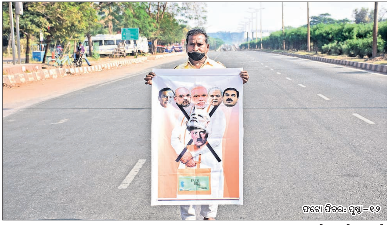
ଭୁବନେଶ୍ୱରରେ ମଙ୍ଗଳବାର ଭାରତ ବନ୍ଦ ପ୍ରଭାବରେ ରାସ୍ତା ଶୁଣ୍ଠନ ଥିବା ବେଳେ ଜଣେ ଆନ୍ଦୋଳନକାରୀ ଏକ ଫ୍ଲେକ୍ସ ମାଧ୍ୟମରେ କେନ୍ଦ୍ର ନୂଆ କୃଷି ଆଇନକୁ ବିରୋଧ କରୁଛନ୍ତି।

ଭୁବନେଶ୍ୱର, ୮ ଡିସେମ୍ବର (ବ୍ୟବସାୟ): କେନ୍ଦ୍ରରେ ଭାଜପା ନେତୃତ୍ୱାଧୀନ ଏନଡିଏ ସରକାରଙ୍କ ୩ କୃଷି ଆଇନକୁ ବିରୋଧ କରି ବିଭିନ୍ନ କୃଷକ ସଂଗଠନ ଏବଂ ରାଜନୈତିକ ଦଳ ତରଫରୁ ମଙ୍ଗଳବାର ଭାରତ ବନ୍ଦ ଚାଳନା ଦିଆଯାଇଥିଲା। ଏହାକୁ ଦେଖିବାପାଇଁ ବିପୁଳ ସମର୍ଥନ ମିଳିଛି। ଓଡ଼ିଶାରେ ମଧ୍ୟ ବନ୍ଦ ସଫଳ ହୋଇଛି। ରାଜ୍ୟର ବିଭିନ୍ନ ଜିଲ୍ଲାରେ କୃଷକ ସଂଗଠନ ପକ୍ଷରୁ ଶୋଭାଯାତ୍ରା, ପିକେଟିଂ କରାଯିବା ସହ ଜାତୀୟ ରାଜପଥ ଅବରୋଧ କରି ପ୍ରତିବାଦ କରାଯାଇଛି। କାଁ ଭାଁ ଦୁଇଟିକିଆ ଯାନବାହନ ଚଳାଚଳ କରୁଥିଲେ ମଧ୍ୟ ସରକାରୀ କାର୍ଯ୍ୟାଳୟ, ବୋକାଳ ବଜାର, ବ୍ୟବସାୟିକ ପ୍ରତିଷ୍ଠାନ, ବ୍ୟାଙ୍କ ବନ୍ଦ ରହିଥିଲା। ବୋକାଳ ବଜାର, କାର୍ଯ୍ୟାଳୟ ବନ୍ଦ ରହିଥିବାରୁ ରାସ୍ତାଘାଟ ଶୁନ୍ୟ ହୋଇପଡ଼ିଥିଲା। କୃଷକ ଓ ଶ୍ରମିକ ସଂଗଠନଗୁଡ଼ିକ ବିଭିନ୍ନ ରେଳଷ୍ଟେଶନରେ ବିକ୍ଷୋଭ କରିବାକୁ ୫ ଘଣ୍ଟା ଧରି ରେଳ ଚଳାଚଳ ହୋଇପାରି ନ ଥିଲା। ଦୂରଦୂରାନ୍ତକୁ ଯିବାକୁ ଥିବା ଲୋକମାନେ ସନ୍ଧ୍ୟା ପର୍ଯ୍ୟନ୍ତ ବିପୁଳ ସମର୍ଥନ ମିଳିଥିଲା। ପୁଷ୍ପା-୪