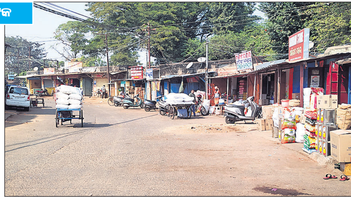
ଦେଶବ୍ୟାପୀ ବନ୍ଦ ପ୍ରଭାବରୁ ମାଲଗୋଦାମରେ ଖାଁ ଖାଁ ଦୃଶ୍ୟ ।