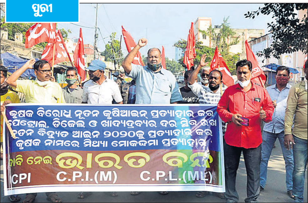
ପୁରୀରେ କୃଷକ ବିରୋଧୀ ଆଇନ ବିରୋଧରେ ବିରୋଧ ।