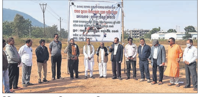
ବିଭିନ୍ନ ସଙ୍ଗଠନ ପକ୍ଷରୁ ପ୍ରତିବାଦ କରାଯାଇଛି।

ଖୋର୍ଦ୍ଧାରେ ବହୁଶେଷ ପାହାଡ଼ ପାଦଦେଶରେ ପାଇକ ସ୍ଥାନ ନିର୍ମାଣ ଶିଳାନ୍ୟାସକୁ ମଙ୍ଗଳବାର ବର୍ଷେ ବିତିଥିଲେ ମଧ୍ୟ ବର୍ତ୍ତମାନ ସୁଦ୍ଧା ସରକାରଙ୍କ ପକ୍ଷରୁ ଏହାର ନିର୍ମାଣ କାର୍ଯ୍ୟ ଆରମ୍ଭ ଲାଗି କୌଣସି ପଦକ୍ଷେପ ଗ୍ରହଣ କରାଯାଇ ନାହିଁ।