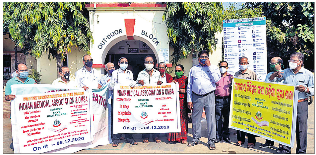
ଭିକ୍ଷୁଆନ ମେଡିକାଲ ଆସୋସିଏସନ ପକ୍ଷରୁ ମଙ୍ଗଳବାର ପୁରୀ ମୁଖ୍ୟ ଚିକିତ୍ସାଳୟ ସମ୍ମୁଖରେ ଧାରଣା ଦିଆଯାଇଛି।

ଭୁବନେଶ୍ୱର, ୮.୧୨ (ବୁଧବେଳା): ଦୋଳାନରେ ନିଆଁ ଲାଗାଇଦେବା ଘଟଣାରେ ଖଣ୍ଡଗିରି ଥାନା ପୋଲିସ ମଙ୍ଗଳବାର ଜଣେ ଅଭିଯୁକ୍ତଙ୍କୁ ଗିରଫ କରି କୋର୍ଟଚାଲାଣ କରିଛି।