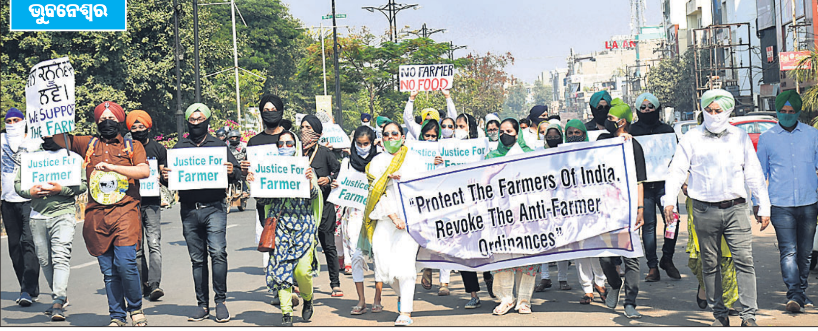
କେନ୍ଦ୍ର ସରକାରଙ୍କ କୃଷି ଆଇନ ପ୍ରତ୍ୟାହାର ଦାବିରେ ମଙ୍ଗଳବାର 'ଶିଖ୍ ଏଭ୍' ପକ୍ଷରୁ ମାଷ୍ଟର କ୍ୟାଣ୍ଟିନ ଛକରେ ବିରୋଧ ଓ ଶୋଭାଯାତ୍ରା ।