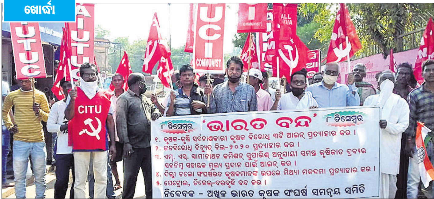
ଅଞ୍ଚଳ ଭାରତ କୃଷକ ସଂଘର୍ଷ ସମନ୍ୱୟ ସମିତି ପକ୍ଷରୁ ଖୋର୍ଦ୍ଧାରେ ଆନ୍ଦୋଳନ କରାଯାଇଛି ।