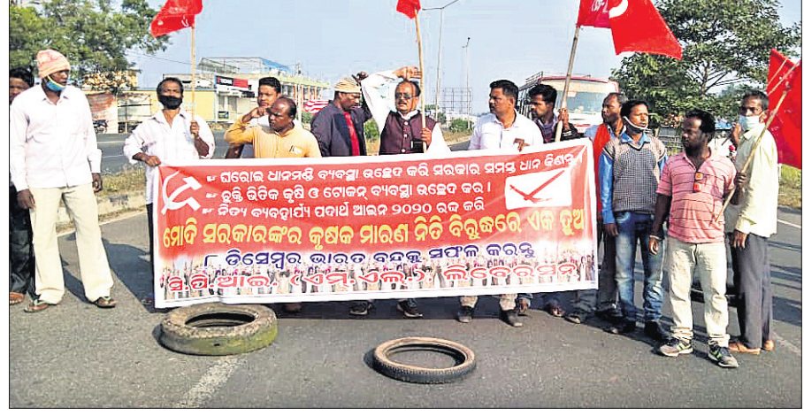
କେନ୍ଦ୍ରର ନୂତନ କୃଷି ଆଇନ ପ୍ରତ୍ୟାହାର ଦାବିରେ ମଙ୍ଗଳବାର ପୁରୀ ଜିଲ୍ଲା ପିପିଲି ଠାରେ ବିକ୍ଷୋଭ କରାଯାଇଛି।

ପୁରୀ ଅଫିସ, ୮.୧୨: କେନ୍ଦ୍ର ସରକାରଙ୍କ ନୁଆ କୃଷି ଆଇନକୁ ବିରୋଧ କରି ଚାଷୀଙ୍କ ପକ୍ଷରୁ ମଙ୍ଗଳବାର ଭାରତ ବନ୍ଦ ଡାକରା ଦିଆଯାଇଥିଲା।