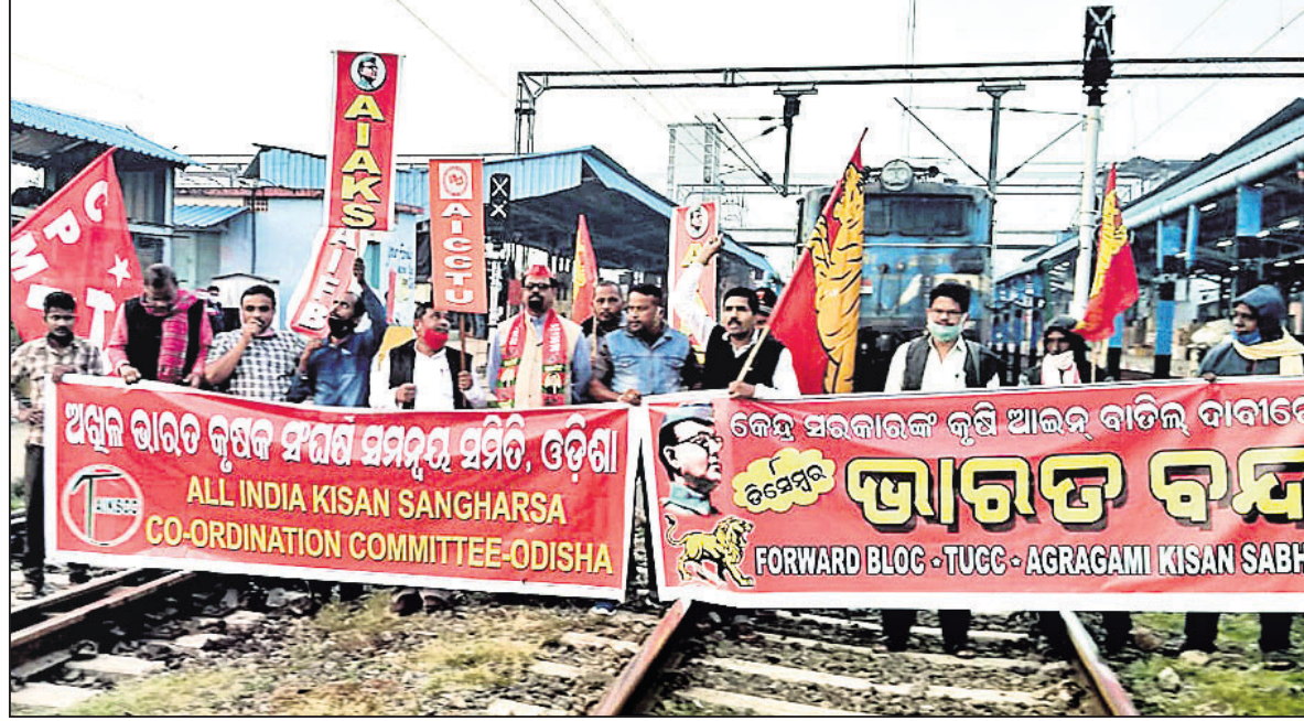
ଫରାଡ଼ି ଚୁକ ସମେତ ଅନ୍ୟାନ୍ୟ ମିଳିତ ଟ୍ରେଡ୍ ୟୁନିୟନ ପକ୍ଷରୁ ଭୁବନେଶ୍ୱର ରେଳଠେ ଷ୍ଟେସନରେ ରେଳରୋକୋ ।