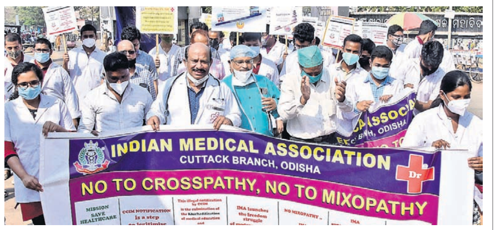
ଭାରତୀୟ କେନ୍ଦ୍ରୀୟ ଔଷଧ ପରିଷଦର ବିଜ୍ଞପ୍ତିକୁ ପ୍ରତ୍ୟାହାର କରିବା ଦାବି ନେଇ ଭାରତୀୟ ଚିକିତ୍ସକ ସଂଘ, ଓଡ଼ିଶା ଶାଖା ପକ୍ଷରୁ ମଙ୍ଗଳବାର କଟକସ୍ଥିତ ଆଇଏମଏସ୍ ହାଉସ୍ ପରିସରକୁ ବାହାରିଥିବା ଶୋଭାଯାତ୍ରା।