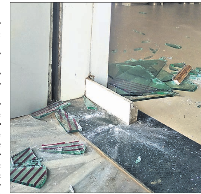
ବାଦାମବାଡିସ୍ଥିତ ଏକ ଘରୋଇ ବ୍ୟାଙ୍କ ମୁଖ୍ୟ ଦ୍ୱାର ଗୁଲ୍‌ଫୁ ଆନ୍ଦୋଳନକାରୀ ଭାଙ୍ଗି ଦେଇଛନ୍ତି।

କେନ୍ଦ୍ରର ୩ ବିବାଦୀୟ କୃଷି ଆଇନ ପ୍ରତ୍ୟାହାର ଦାବିରେ ମଙ୍ଗଳବାର ଭାରତ ବନ୍ଦ ଡାକରା ଦିଆଯାଇଥିଲା। ଏହି ବନ୍ଦର ମିଶ୍ରିତ ପ୍ରଭାବ କଟକ ସହରରେ ଦେଖିବାକୁ ମିଳିଥିଲା। ସହରରେ ବସ୍ ଓ ଅଟୋ ଚଳାଚଳ ବନ୍ଦ ରହିଥିବାବେଳେ ଟ୍ରେଡ ଚଳାଚଳ ସମାନ୍ୟ ବାଧାପ୍ରାପ୍ତ ହୋଇଥିଲା। ଅନ୍ୟପକ୍ଷରେ ଦୋକାନବଜାର ଆଂଶିକ ଭାବେ ଖୋଲାଥିଲା। ତେବେ ବନ୍ଦର ପ୍ରଭାବ ସବୁଠୁ ଅଧିକ ବାଦାମବାଡି ବସ୍‌ଷ୍ଟାଣ୍ଡ ଓ ମଧୁପାଟଣା ଅଞ୍ଚଳରେ ଦେଖିବାକୁ ମିଳିଥିଲା। ବାମଦଳ ଓ ବିଭିନ୍ନ କୃଷକ ସଙ୍ଗଠନର କର୍ମକର୍ମୀମାନେ ପୂର୍ବାହ୍ନ ୧୦ଟାରେ ମଧୁପାଟଣାଠାରେ ପ୍ରତିବାଦ ସଭା କରିଥିଲେ। ପରେ ବାଦାମବାଡିରେ ପହଞ୍ଚି ଯାନବାହନ ଅଟକାଇଥିଲେ। ସେହିପରି କଂଗ୍ରେସ କର୍ମୀମାନେ କଟକର ଛକକୁ ବାହାରି ବାଦାମବାଡିରେ ପହଞ୍ଚି ବସ୍ ରୋକିବା ସହ ଓ ପ୍ରତିବାଦ କରିଥିଲେ। ପୋଲିସ୍ ପ୍ରତିବାଦକାରୀଙ୍କୁ ଉତ୍ତରାଞ୍ଚଳ ସହ କେତେଜଣଙ୍କୁ ଗିରଫ କରିବା ପରେ ଛାଡି ଦେଇଥିଲା।