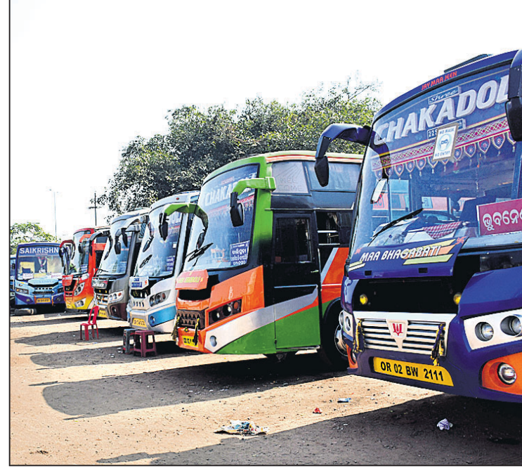
ବରପୁଣ୍ଡା ବସ୍ଷ୍ଟାଣ୍ଡରେ ଅଟକି ରହିଥିବା ବସ୍ ।