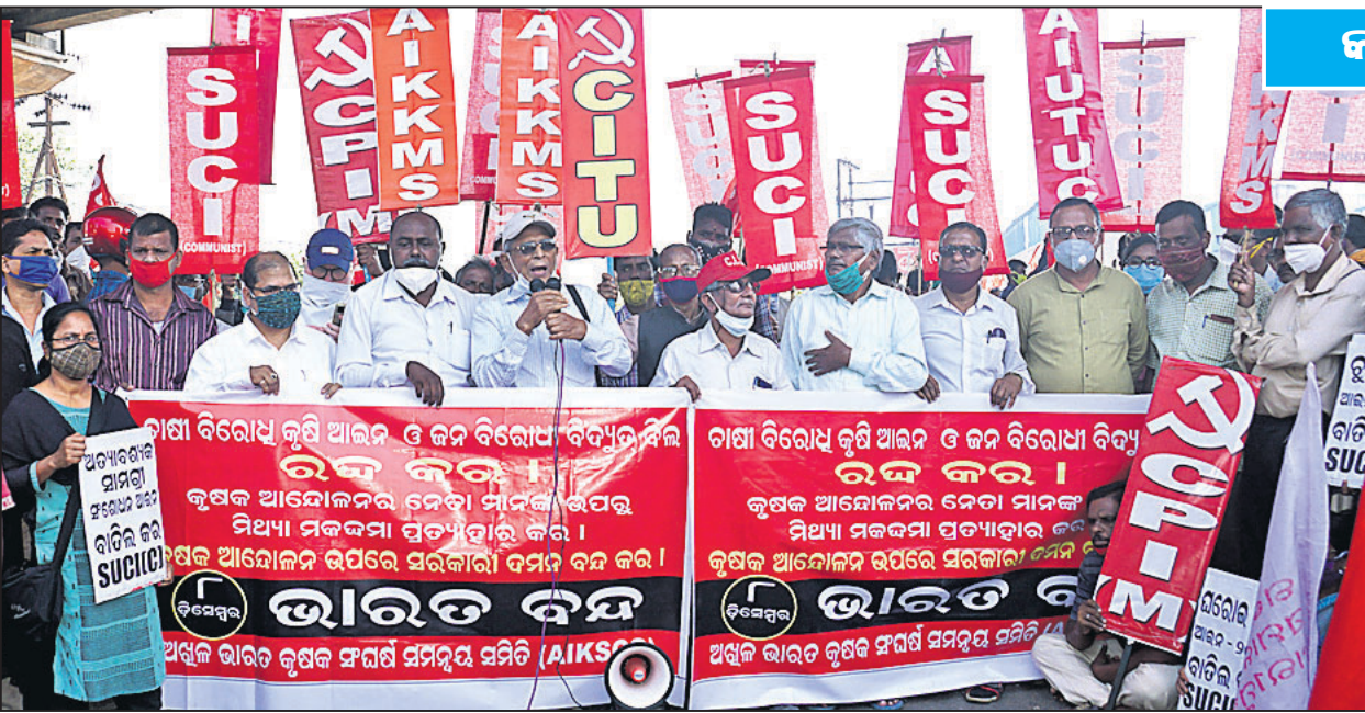
କଟକଠାରେ ବିଭିନ୍ନ ଶ୍ରମିକ ସଂଗଠନ ପକ୍ଷରୁ ଭାରତବନ୍ଦ ସଫଳ କରିବାକୁ ଆହ୍ୱାନ ଦିଆଯାଇଛି ।