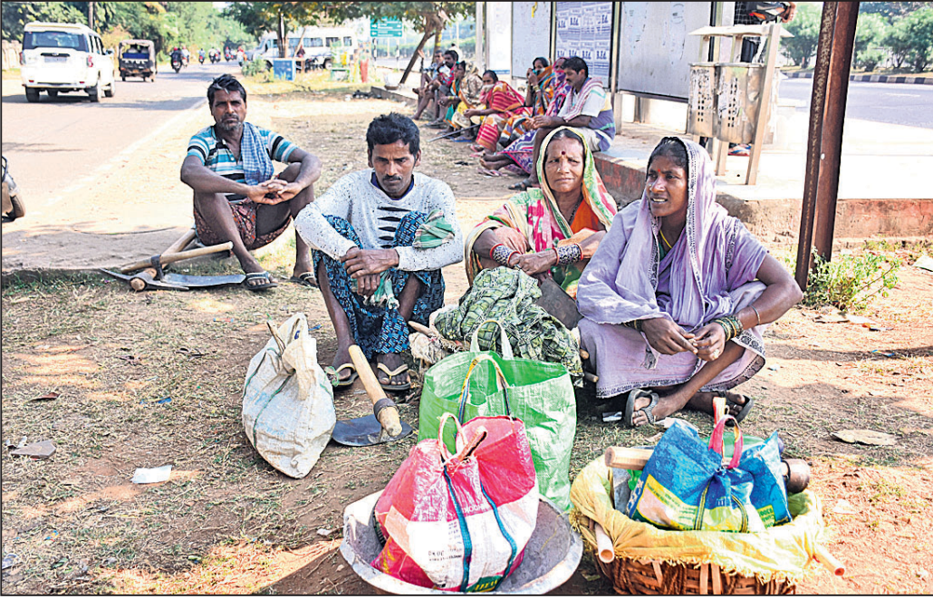
ବନ୍ଦ ଯୋଗୁ ନିର୍ମୂଲ୍ୟ ଦୁର୍ଗାମଣ୍ଡପ ନିକଟରେ ହାତ ବାନ୍ଧି ବସିଥିବା ଦିନମଜୁରିଆ ।