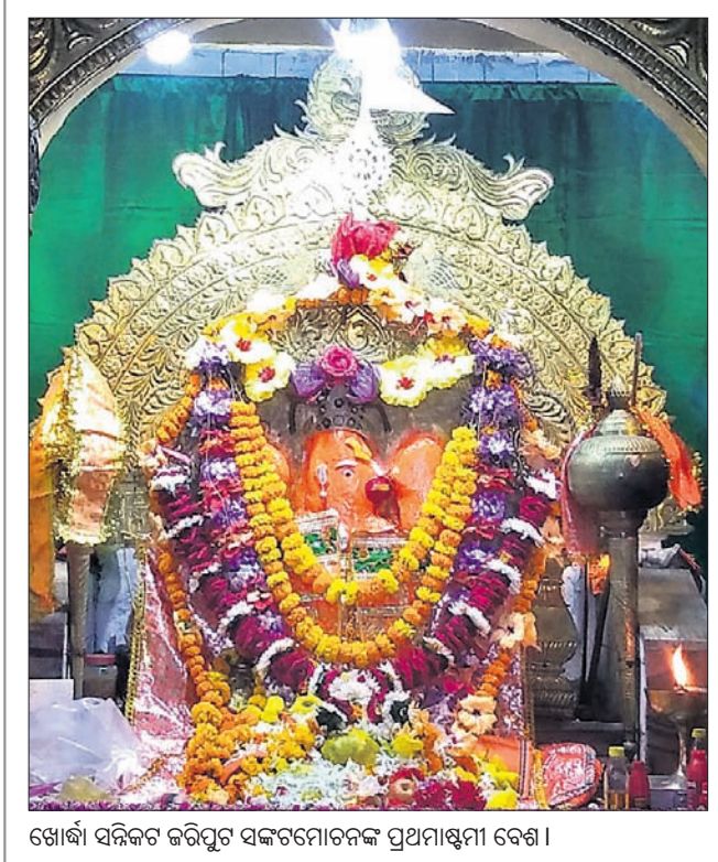
ଖୋର୍ଦ୍ଧା ସନିକର ଜରିପୁଟ ସକଳମୋଚନଙ୍କ ପ୍ରଥମାଷ୍ଟମୀ ବେଶ।

୧୮୧୭ରେ ପାଇକ ବିଦ୍ରୋହ ଆରମ୍ଭ ହୋଇଥିଲା। ୧୮୦୪ରେ ଜୟୀ ରାଜଗୁରୁଙ୍କ ନେତୃତ୍ୱରେ ଆରମ୍ଭ ହୋଇଥିବା ରାଜ ବିଦ୍ରୋହ, ୧୮୧୭ରେ ପାଇକ ବିଦ୍ରୋହ, ୧୮୨୭ରେ ଚାପଳ ବିଦ୍ରୋହ ଏବଂ ୧୮୩୬ରେ କୃତ୍ତିବାସ ପାଇକଶାଖା ନେତୃତ୍ୱରେ ହୋଇଥିବା ସଂଗ୍ରାମ ପରେ ଏହା ଶେଷ ହୋଇଥିଲା।