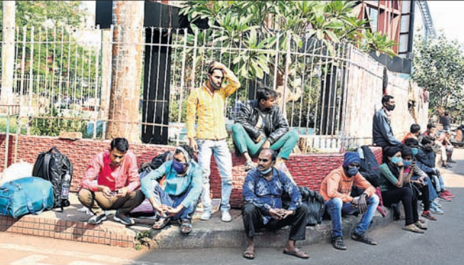
ଟ୍ରେଡ ବନ୍ଦ ଯୋଗୁଁ ଯାତ୍ରୀମାନେ ଷ୍ଟେଶନ ବାହାରେ ବସି ରହିଛନ୍ତି।

ଆନ୍ଦୋଳନକାରୀଙ୍କୁ ଅଟକାଇବାକୁ ଯାଇ ପୋଲିସ୍‌ଜୁନାକେଦମ୍‌ହେବାକୁ ପଡ଼ିଥିଲା। ବନ୍ଦସ୍ୱରୂପ, ରେଳ ଷ୍ଟେଶନରେ ଯାତ୍ରୀ ହତସ୍ତ ବନ୍ଦ ଯୋଗୁଁ ଗଡ଼ବ୍ୟୟାନକୁ ଯାଇ ନ ପାରି ହଜାରଶ ହୋଇଥିଲେ ଅନେକ ଯାତ୍ରୀ।