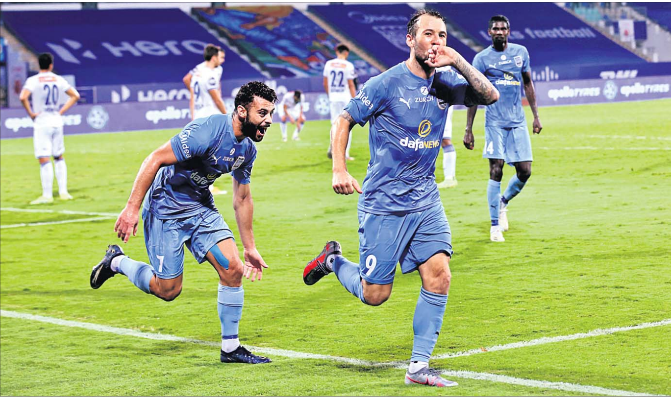
ଗୋଲ ଦେବା ପରେ ମୁୟାଲ ଷ୍ଟାଇଲର ଆତମ ଲେ' ଫୋଟୋ