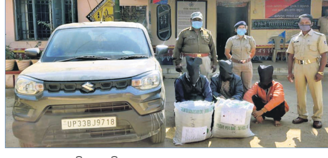
ଜବତ କାର ଏବଂ ଗିରଫ ଅଭିଯୁକ୍ତମାନେ।

ଜଳଯୋଗାଣ ବିଭାଗ ନିର୍ଦ୍ଦେଶକ ଯତ୍ନା ଅନୁରେଷ୍ଟ କୁମାର ପାଢ଼ୀ ମଞ୍ଚାସାନ କରିଥିଲେ।