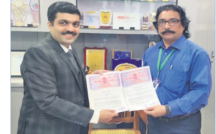
ରୁଦ୍ଧି ସ୍ୱାକ୍ଷର ପରେ ପ୍ରଦର୍ଶନ କରାଯାଉଛି।

ରାୟଗଡ଼ା ଜିଲ୍ଲା ଗୁଣ୍ଡାପୁର ଜିଆଇଇଟି ବିଶ୍ୱବିଦ୍ୟାଳୟ ଏବଂ ଗୁରୁଗୀତ ସୂଚି ଆରମ୍ଭ ହୋଇଛି।