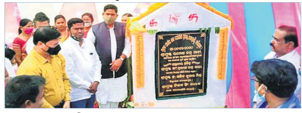
ନବରଙ୍ଗପୁର ଏମପି ଏବଂ ଝରିଗାଁ ବିଧାୟକ ପ୍ରକଳ୍ପ ଶିଳାନିଧା କରୁଛନ୍ତି।

ନବରଙ୍ଗପୁର ଜିଲ୍ଲା ରନ୍ଧାହାଣ୍ଡି ବ୍ଲକ୍ ୧୪ ପଞ୍ଚାୟତର ଜନସାଧାରଣଙ୍କୁ ବିଶୁଦ୍ଧ ପାନୀୟ ଜଳ ଯୋଗାଣ ସକାଶେ ଜଳଯୋଗାଣ ନିଗମ ଦ୍ୱାରା ବୁଧବାର ୧୪୦ କୋଟି ବ୍ୟୟରେ ବୃହତ୍ ଜଳଯୋଗାଣ ପ୍ରକଳ୍ପର ଶିଳାନିଧା କରାଯାଇଛି।