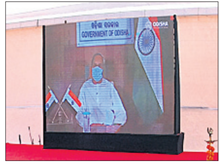
ଭିଡ଼ିଓ କନ୍ଫରେନ୍ସ ମାଧ୍ୟମରେ ମୁଖ୍ୟମନ୍ତ୍ରୀ ଇକୋ ରିଟ୍ରିଟ୍‌କୁ ଉଦ୍ଘାଟନ କରୁଛନ୍ତି।

ରାଜ୍ୟର ୫ଟି ସ୍ଥାନରେ ଆରମ୍ଭ ହୋଇଛି ବହୁ ପ୍ରତୀକ୍ଷିତ 'ଇକୋ ରିଟ୍ରିଟ୍'। ରାମଚଣ୍ଡୀ ବେଳାଭୂମି ସମେତ ଭିତରକନିକା, ଦାରିଙ୍ଗବାଡ଼ି, ହାରାକୁଦ ଓ ସାତକୋଶିଆଠାରେ ରାଜ୍ୟ ପର୍ଯ୍ୟଟନ ବିଭାଗର ଏହି ମେଘା ଇଭେଣ୍ଟର ବିତରଣ ସଂସ୍କରଣର ଶୁଭାରମ୍ଭ ହୋଇଛି। ବୁଧବାର ମୁଖ୍ୟମନ୍ତ୍ରୀ ନବୀନ ପଟ୍ଟନାୟକ ଭିଡ଼ିଓ କନ୍ଫରେନ୍ସ ମାଧ୍ୟମରେ ଏହାକୁ ଉଦ୍ଘାଟନ କରିବା ସହ ସମସ୍ତ ଅତିଥିଙ୍କୁ ସ୍ୱାଗତ କରିଛନ୍ତି। ପୂର୍ବ ଭାରତରେ ଓଡ଼ିଶା କେବଳ 'ଇକୋ ରିଟ୍ରିଟ୍' ଫେଷ୍ଟିଭାଲ ଆୟୋଜନ କରୁଛି। ଓଡ଼ିଶାର ସୌନ୍ଦର୍ଯ୍ୟ ପ୍ରତି ପର୍ଯ୍ୟଟକଙ୍କୁ ଆକୃଷ୍ଟ କରିବାରେ ଇକୋ ରିଟ୍ରିଟ୍ ୨୦୨୦ ଏକ ହଲ୍ଲମାର୍ଗ ସାଜିବ ବୋଲି ମୁଖ୍ୟମନ୍ତ୍ରୀ କହିଛନ୍ତି। ଏଥିରେ ପର୍ଯ୍ୟଟକଙ୍କ ସୁରକ୍ଷାକୁ ରାଜ୍ୟ ସରକାର ପ୍ରାଥମିକତା ଦେଉଛନ୍ତି। କୋଭିଡ଼ ନିୟମାବଳୀକୁ କଡ଼ାକଡ଼ି ପାଳନ କରାଯାଉଛି। ପର୍ଯ୍ୟଟକମାନେ