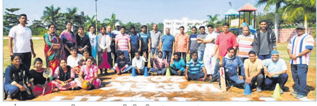
କାର୍ଯ୍ୟକ୍ରମରେ ଅଂଶଗ୍ରହଣ କରିଥିବା ସ୍କୁଲ ଅଧ୍ୟକ୍ଷ, ଶିକ୍ଷୟିତ୍ରୀ ଶିକ୍ଷକ ଓ ଅନ୍ୟମାନେ।

ରାୟଗଡ଼ା ଜିଲ୍ଲା ଗୁଣ୍ଡାପୁର ଜିଆଇଇଟି ବିଶ୍ୱବିଦ୍ୟାଳୟ ଏବଂ ଗୁରୁଗୀତ ସୂଚି ଆରମ୍ଭ ହୋଇଛି।