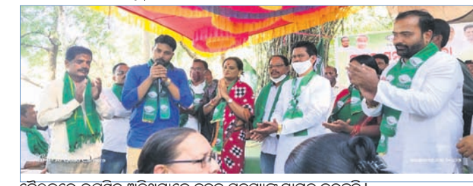
ବୈଠକରେ ଉପସ୍ଥିତ ଅତିଥିମାନେ ନୂତନ ସଦସ୍ୟଙ୍କୁ ସ୍ୱାଗତ କରୁଛନ୍ତି।