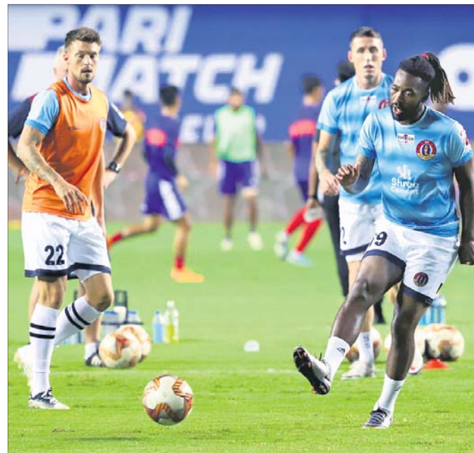
ଅଭ୍ୟାସ ଅବସରରେ ଇଷ୍ଟବେଙ୍ଗଲ ଖେଳାଳିମାନେ।

ଇଣ୍ଡିଆନ ସୁପର ଲିଗ୍ (ଆଇଏସ୍‌ଏଲ) ଚୁର୍ଣ୍ଣମେଣ୍ଟରେ ଝୁନାଇଟେଟ ଏସ୍‌ସି ପରାସ୍ତ ହେବ। ଏହି ଖେଳରେ ଝୁନାଇଟେଟ ଏସ୍‌ସି ୨-୧ ଗୋଲରେ ଚେନାଇନ ଏଫ୍‌ସିକୁ ପରାସ୍ତ କରିଛି।