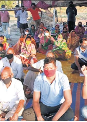
ଧାରଣାରେ ବସିଥିବା ପଥରମୁଣ୍ଡା ଗ୍ରାମର ୨୫ ପରିବାର।

ପ୍ରଶାସନ, ରାଜନେତା କେହି ବି ଦୃଷ୍ଟି ଦେଇନାହାନ୍ତି। ଗୁରୁବାର ଗ୍ରାମବାସୀ ଜିଲ୍ଲାପାଳଙ୍କୁ ପୁନଃ ଦାବିପତ୍ର ପ୍ରଦାନ କରିବା ସହ ସମସ୍ୟା ସମାଧାନ କରା ନ ଗଲେ ଆଗାମୀ ୧୮ ତାରିଖକୁ କାର୍ଯ୍ୟବନ୍ଦ ଆନ୍ଦୋଳନ କରାଯିବ ବୋଲି ଚେତାବନା ଦେଇଛନ୍ତି। ଏ ନେଇ କଟିଶି ଓସିପି ଜିଏମ୍.ସି.ଏ.ଏ. ଯୋଗାଯୋଗ କରାଯାଇଥିଲେ ମଧ୍ୟ ମତାମତ ମିଳିପାରି ନାହିଁ।