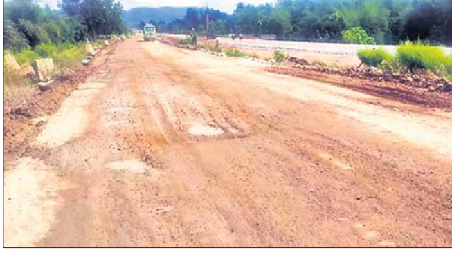
୫୫ନଂ. ଜାତୀୟ ରାଜପଥର ସମ୍ପ୍ରସାରଣ କାର୍ଯ୍ୟ ଜାରି ରହିଛି।

କେନ୍ଦ୍ରାଞ୍ଚଳ ଦେଇ ପୂର୍ବକୁ ପଶ୍ଚିମ ଓଡ଼ିଶାକୁ ଯୋଡ଼ୁଥିବା ୫୫ ନଂ. ଜାତୀୟ ରାଜପଥ ସମ୍ପ୍ରସାରଣରେ ଅହେତୁକ ଦିନ ହେଉଛି। ଜାତୀୟ ରାଜପଥ ପ୍ରାୟକରଣ କର୍ତ୍ତୃପକ୍ଷ (ଏନ୍.ଏ.ଏ.ଆଇ.) ପକ୍ଷରୁ ଏହି କାର୍ଯ୍ୟ ଠିକାସଂସ୍ଥା ଗାୟତ୍ରୀ ପ୍ରୋଜେକ୍ଟସ୍ ଦିଆଯାଇଛି। କିନ୍ତୁ ସମୟସୀମା ଶେଷ ହୋଇଯାଇଥିଲେ ମଧ୍ୟ ଉକ୍ତ ସଂସ୍ଥା ନିର୍ମାଣ ଶେଷ କରିପାରି ନାହିଁ। ଫଳରେ ଦୈନିକ ହଜାର ହଜାର ଭାରାଯାନ ଚଳାଚଳ କରୁଥିବା ଏହି ରାଜପଥରେ ଦୁର୍ଘଟଣା ସଂଖ୍ୟା ବଢ଼ିଚାଲିଛି। ଗତ ୩ ବର୍ଷ ମଧ୍ୟରେ ଶତାଧିକ ଯାତ୍ରୀଙ୍କ ଜୀବନ ହାନି ହୋଇଯାଇଛି। ସମ୍ପ୍ରସାରଣ କିପରି ଶୀଘ୍ର ଶେଷ ହେବ ତାହା ଉପରେ ଠିକା ସଂସ୍ଥା କିମ୍ବା ଏନ୍.ଏ.ଏ.ଆଇ କୋର୍ ଭେଦ ନ ଥିବାରୁ ଅନୁଗୋଳ ଜିଲ୍ଲାରେ ଜନ ଅସନ୍ତୋଷ ବଢ଼ିବାରେ ଲାଗିଛି।