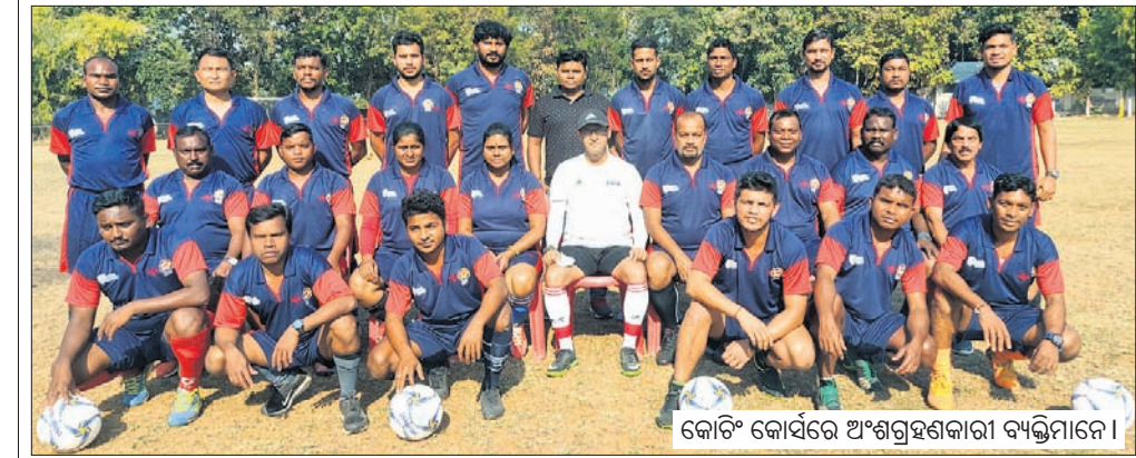
କୋଟି କୋର୍ସରେ ଅଂଶଗ୍ରହଣକାରୀ ବ୍ୟକ୍ତିମାନେ।