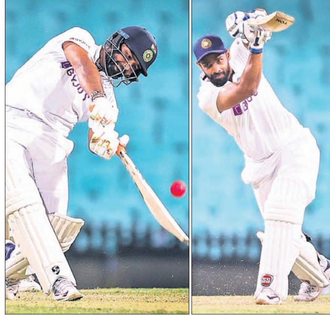
ଶତକ ହାସଲ ଅବସରରେ ରିଷଭ ପନ୍ତ ଓ ହରୁମା ବିହାରୀ।

ବିଜ୍ଞାନ, ୧୨।୧୨ ଅଷ୍ଟେଲିଆ ବିପକ୍ଷ ପ୍ରଥମ ଟେଷ୍ଟ ପୂର୍ବରୁ ଶତକ ହାସଲ କରି ନିଜ ଦାବିକୁ ମଜବୁତ କରିଛନ୍ତି ଭାରତର ହରୁମା ବିହାରୀ ଓ ରିଷଭ ପନ୍ତ। ଉଭୟଙ୍କ ଅପରାଜିତ ଶତକ ସହାୟତାରେ ଭାରତ ଏଠାରେ ଚାଲିଥିବା ଦିବାରାତ୍ର ଓପିଆର ଗେମରେ ନିଜର ସ୍ଥିତିକୁ ଦୃଢ଼ କରିଛି। ବିତାଣ ଦିବସ ଶେଷସୂକ୍ଷ୍ମ ଭାରତ ଏହାର ବିତାଣ ଇନିଂସରେ ୪ ଭଲକେଟ