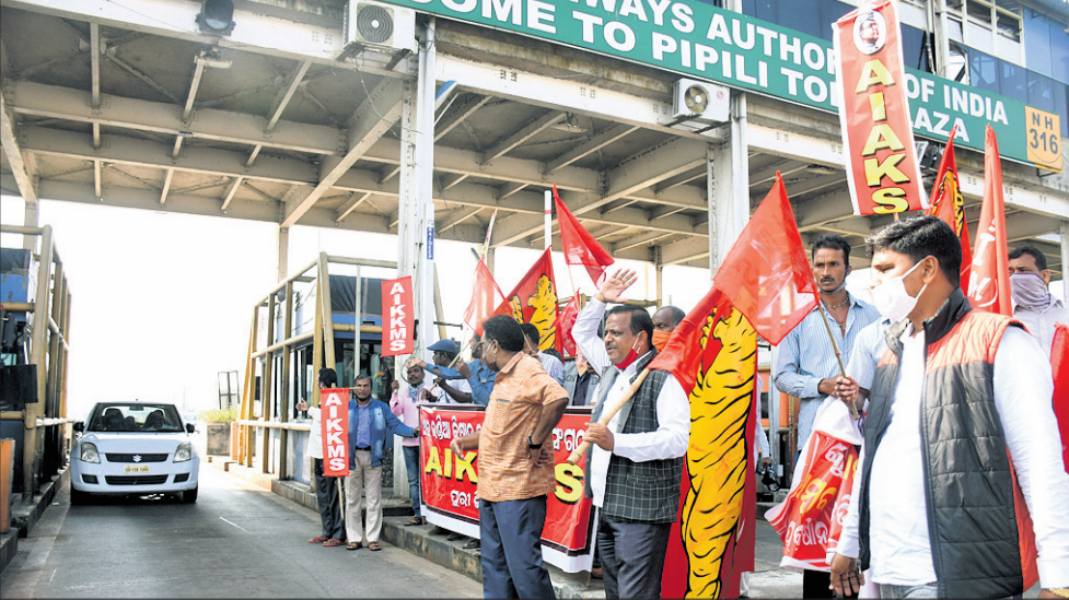
କେନ୍ଦ୍ରର ନୂଆ କୃଷି ଆଇନ ପ୍ରତ୍ୟାହାର ଦାବିରେ ଆନ୍ଦୋଳନରେ ବିଭିନ୍ନ କୃଷକ ସଂଗଠନ ପକ୍ଷରୁ ପିପିଲି ଟୋଲପ୍ଲାଜାକୁ ଶନିବାର ଅକ୍ତିଆର କରାଯାଇ ଯାନବାହନଗୁଡ଼ିକୁ ଦେଇପୂଜ୍ଞ ଭାବେ ଛଡ଼ାଯାଇଛି।