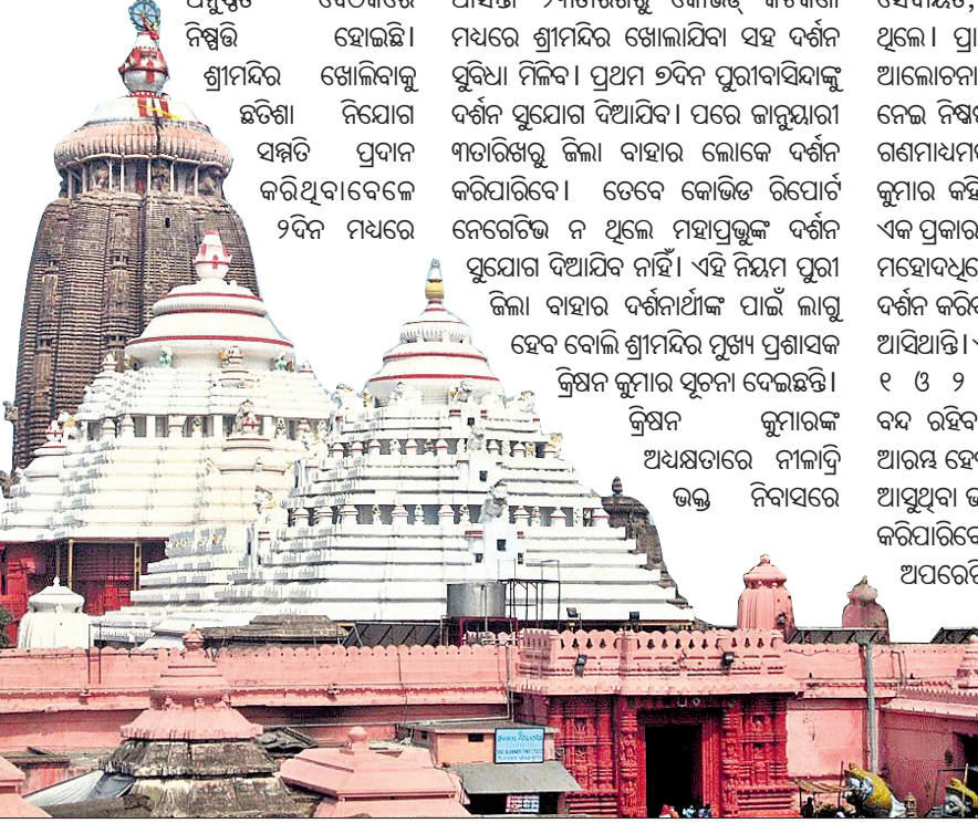
ପୁରୀ ଅଧିକାରୀ, ୧୨୧୧୨

କରାଯିବାକୁ ନିଷ୍ପତ୍ତି ନିଆଯାଇଛି। ଶ୍ରୀମନ୍ଦିର ନାତିକାନ୍ତିକୁ ସୁରୁଖୁରୁରେ କରିବା ଲକ୍ଷ୍ୟରେ ଏଭଳି କଟକଣା ରଖାଯାଇଛି। ଏହି ସମୟରେ ସାହାଣ ମେଲ ଦର୍ଶନ ବନ୍ଦ ରହିବ। ସେହିପରି ସମସ୍ତ ଭକ୍ତମାନେ ଯେପରି ମହାପ୍ରସାଦ ପାଇପାରିବେ ତାହାର ବ୍ୟବସ୍ଥା ହୋଇଛି। ମନ୍ଦିର ଖୋଲିବା ସହିତ ସମସ୍ତ କର୍ମଚାରୀଙ୍କ ପାଇଁ ପରିଚୟପତ୍ର ବ୍ୟବସ୍ଥା ହୋଇଛି। ଏନେଇ ଯେପରି କୌଣସି ତ୍ରୁଟି ନ ରୁହେ ମନ୍ଦିର ପ୍ରଶାସନ ଏହା ଉପରେ କଡ଼ା ନଜର ରହିବ। ଜିଲ୍ଲା ବାହାର ଲୋକଙ୍କୁ କୋଭିଡ଼ ନେଗେଟିଭ ରିପୋର୍ଟ ଦେବାକୁ ପଡ଼ିବ। ଦର୍ଶନର ୪୮ଘଣ୍ଟା ପୂର୍ବରୁ ରାପିଡ଼ ଆର୍ଥିକେନ୍ ଟ୍ରେଷ୍ଚୁ (ଆରଏଟି) କିମ୍ବା ଆର୍ଡି-ପିସିଆର ଟ୍ରେଷ୍ଚୁ ରିପୋର୍ଟ ଆଣିଥିବା ଦରକାର। ଯେଉଁ ଭକ୍ତ କୋଭିଡ଼ ନେଗେଟିଭ ରିପୋର୍ଟ ଦେଖାଇପାରିବେ ନାହିଁ ସେମାନଙ୍କ ପ୍ରବେଶ ଉପରେ କଟକଣା ଜାରି କରାଯିବ। ୬୫ବର୍ଷରୁ ଅଧିକ ବୟସ୍କ ଓ ପିଲାଙ୍କୁ ନ ଆସିବାକୁ ଅନୁରୋଧ କରାଯିବ। ୩ତାରିଖ ଠାରୁ ପ୍ରଥମ ସପ୍ତାହରେ ପ୍ରତ୍ୟେକ ଦିନ ୫୦୦୦ ଭକ୍ତଙ୍କୁ ଦର୍ଶନ ଅନୁମତି ମିଳିବ। ପରିସ୍ଥିତିକୁ ଦେଖି ଧାରଣ୍ୟରେ ଦର୍ଶନାର୍ଥୀଙ୍କ ସଂଖ୍ୟା ବଦାଯିବ। ପୁଷ୍ପା-୪