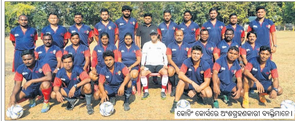
କୋଟି କୋର୍ସରେ ଅଂଶଗ୍ରହଣକାରୀ ବ୍ୟକ୍ତିମାନେ।