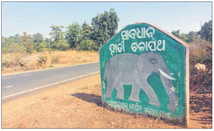
ସମ୍ବଲପୁର ପଡ଼ିଆବାହାଳ ରେଞ୍ଜରେ ଥିବା କରିଡର ଓ ହାତୀ ଚଳାପଥ ।