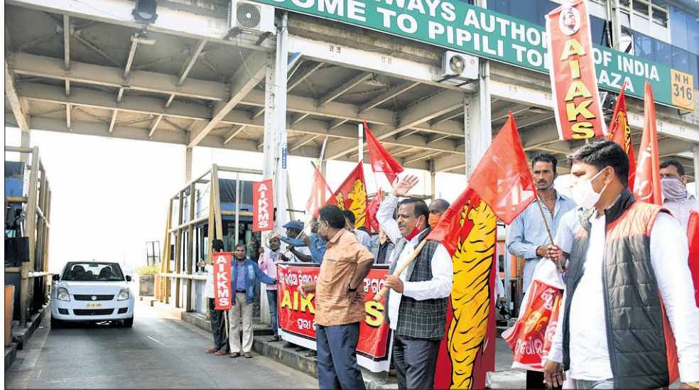
କେନ୍ଦ୍ରର ନୂଆ କୃଷି ଆଇନ ପ୍ରତ୍ୟାହାର ଦାବିରେ ଆନ୍ଦୋଳନରେ ବିଭିନ୍ନ କୃଷକ ସଂଗଠନ ପକ୍ଷରୁ ପିପିଲି ଟୋଲ୍‌ପ୍ଲାଜାକୁ ଶନିବାର ଅକ୍ତିଆର କରାଯାଇ ଯାନବାହନଗୁଡ଼ିକୁ ଦେଇପୂଜ୍ଞ ଭାବେ ଛଡ଼ାଯାଇଛି।