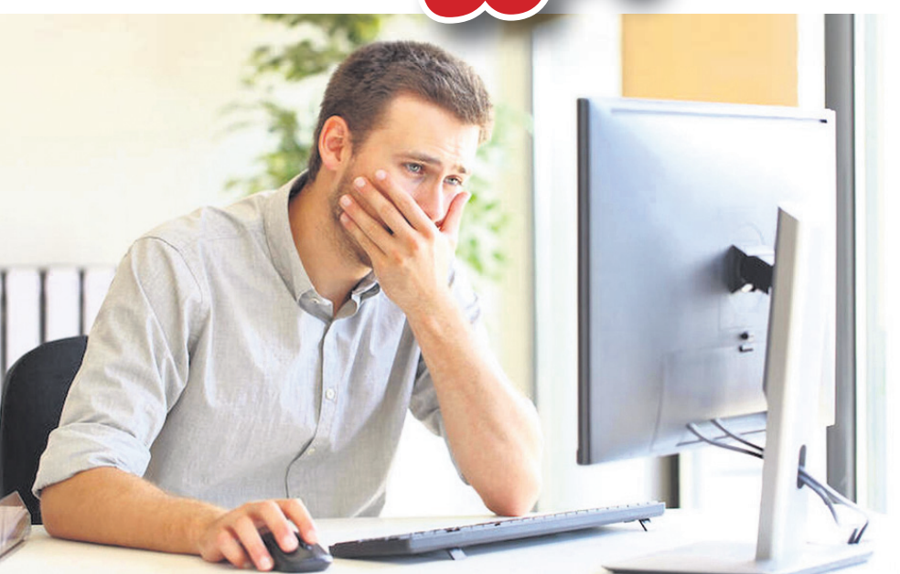
ଦୁର୍ଦ୍ଦିନ ମନ ଭିତରେ ବହୁ ଦିନ ଧରି ବସା ବାନ୍ଧି ରହିବା ଦ୍ୱାରା ମନ ଭାରାଭାର ହୋଇ ଚାହା ମାନସିକ ତଥା ଶାରୀରିକ ପ୍ରସ୍ତରରେ ପ୍ରଭାବ ପକାଇ ଉଚ୍ଚ ରକ୍ତଚାପ, ମଧୁମେହ, ହୃଦ୍‌ରୋଗ, ଶ୍ୱାସ, ଅଜୀର୍ଣ୍ଣ, ମୁଣ୍ଡ ବ୍ୟଥା, ଅନିଦ୍ରା ସହ ଶରୀର କ୍ଳାନ୍ତି ଆଦି ବିଭିନ୍ନ ରୋଗ ସୃଷ୍ଟି ହେବାର ଯଥେଷ୍ଟ ଆଶଙ୍କା ରହିଥାଏ ...

ସଂସ୍କୃତି ଓ ପରମ୍ପରା, ସାମାଜିକ ରୀତିନୀତି ଦୈନିକ ଖାଦ୍ୟ ପାନୀୟ ଶୈଳୀ, ଆଧ୍ୟାତ୍ମିକ ଚିନ୍ତାଧାରା ସହ ଧର୍ମ, ନ୍ୟାୟ, ସତ୍ୟମାର୍ଗଠାରୁ ବେଳେ ବେଳେ ନିଜକୁ ଦୂରେଇ ରଖିବା ପାଇଁ ପସନ୍ଦ କରି ବିଭିନ୍ନ ଦୁର୍ଦ୍ଦିନ ଚିନ୍ତାଧାରା କାର୍ଯ୍ୟ କରୁଛି। ଏହାର ଫଳ ସ୍ୱରୂପ ମନୁଷ୍ୟ ମନରେ ଚିନ୍ତା ଜାଗ୍ରତ ହୋଇ ଚାହା ଦୁର୍ଦ୍ଦିନରେ ରୂପାନ୍ତରିତ ହୋଇ ଶରୀରରେ ବିଭିନ୍ନ ମାନସିକ ରୋଗ ସହ ଶାରୀରିକ ରୋଗ ମଧ୍ୟ ହେବାର ଯଥେଷ୍ଟ ଆଶଙ୍କା ରହିଛି। ଦୁର୍ଦ୍ଦିନ ମନ ଭିତରେ ବହୁଦିନ ଧରି ବସା ବାନ୍ଧିରହିବା ଦ୍ୱାରା ମନ ଭାରାଭାର ହୋଇ ଚାହା ମାନସିକ ତଥା ଶାରୀରିକ ପ୍ରଭାବ ପକାଇ ଉଚ୍ଚ ରକ୍ତଚାପ, ମଧୁମେହ, ହୃଦ୍‌ରୋଗ, ଶ୍ୱାସ, ଅଜୀର୍ଣ୍ଣ, ମୁଣ୍ଡ ବ୍ୟଥା, ଅନିଦ୍ରା ସହ ଶରୀର କ୍ଳାନ୍ତି ଆଦି ବିଭିନ୍ନ ରୋଗ ସୃଷ୍ଟି ହେବାର ଯଥେଷ୍ଟ ଆଶଙ୍କା ରହିଥାଏ। ଆମ ମନରେ କୌଣସି ଘଟଣା କିମ୍ବା ଦୁର୍ଘଟଣା ନେଇ ଅତ୍ୟଧିକ ଚିନ୍ତା କରିବା, କୌଣସି ଅତ୍ୟନ୍ତ ଦୁଃଖ କଥାରେ ମିଶ୍ରମାଣ ହୋଇ ଭାଙ୍ଗିପଡ଼ିବା ଦ୍ୱାରା ମନର ଦୁର୍ଦ୍ଦିନ ମାନସିକ ପ୍ରସ୍ତରରେ ତାହାର ପ୍ରଭାବ ସାମିତ ନ ରଖି ତାହା ଶରୀର ଉପରେ ପ୍ରତିକୂଳ ପ୍ରଭାବ ପକାଇ ଥାଏ। ଆମେ ଯଦି କୌଣସି ଗଭୀର ଦୁଃଖଦ ଖବର ଶୁଣିବା, ଜୀବନ ପ୍ରତି ବିପଦର ଆଶଙ୍କା, ନିଜର ସମ୍ପାନ ହାନି ହୋଇ ହେଉ କିମ୍ବା କୌଣସି ଘଟଣାକୁ ନେଇ ମନରେ ଅତ୍ୟନ୍ତ ଘୋର (ରୋଗ)ସୃଷ୍ଟି ହେବା ଦ୍ୱାରା ଏହା ମନ ଉପରେ ଗଭୀର ଗାପ ସୃଷ୍ଟି ହୋଇ ଶରୀର ପ୍ରକୃତ ସ୍ୱାସ୍ଥ୍ୟ, ନିଃଶ୍ୱାସ ପ୍ରଶ୍ୱାସରେ ପ୍ରଖରତା ଆଦି ହୃଦ୍‌ସ୍ପନ୍ଦନ ବୃଦ୍ଧି ସହ ନାଡ଼ୀର