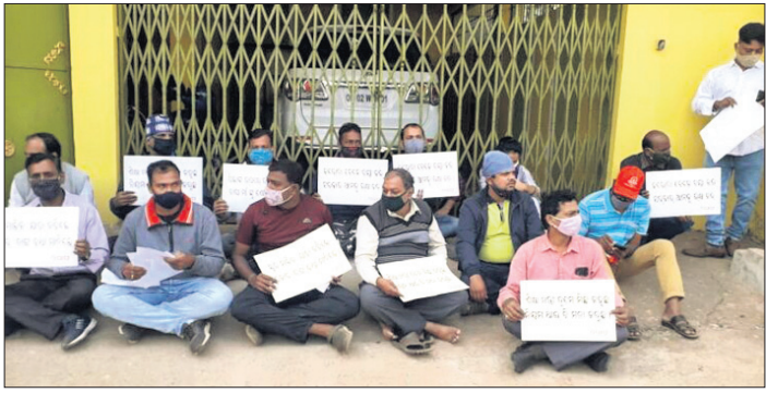
ଗଣଶିକ୍ଷା ମନ୍ତ୍ରୀଙ୍କ ବାସଭବନ ସମ୍ମୁଖରେ ଅଭିଭାବକମାନେ ଧାରଣାରେ ବସିଛନ୍ତି।

ଅନୁଲୋକ ଲାଗୁ କରାଯାଇ ନାହିଁ ବୋଲି ଅଭିଭାବକମାନେ ପ୍ରୋତ୍ସାହନ ଦେଇଛନ୍ତି।