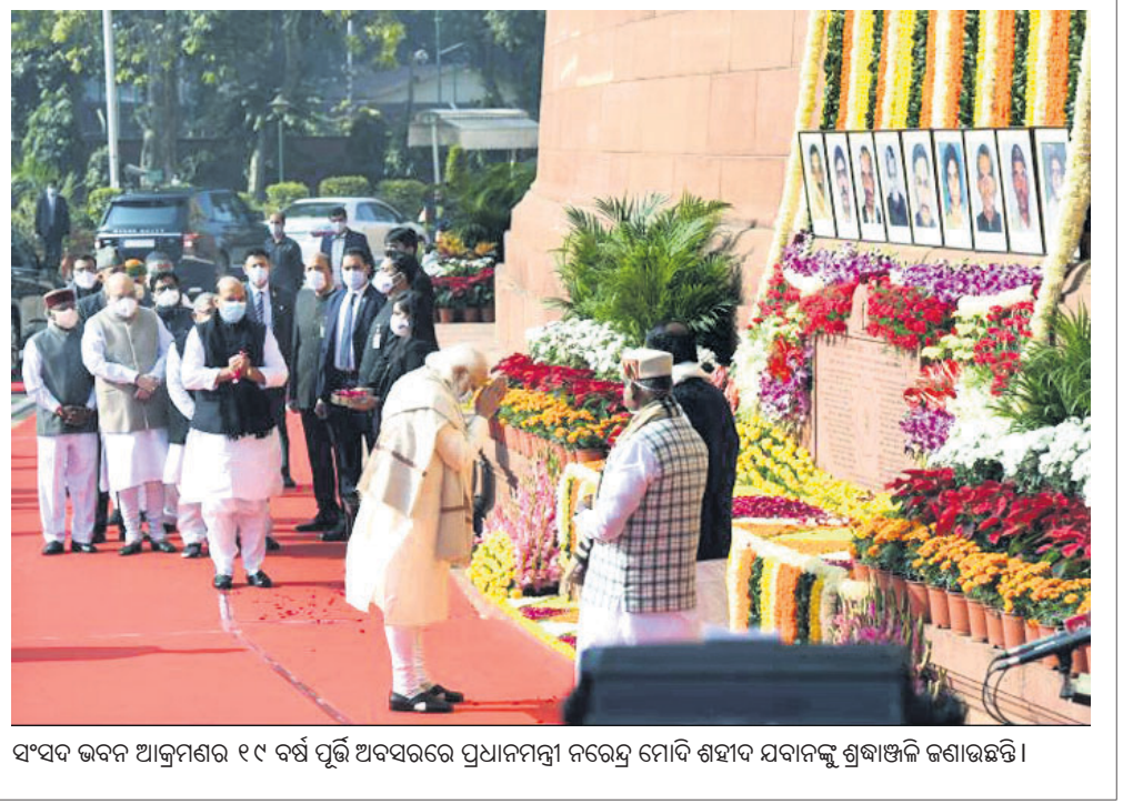
ଏସଏଭି ଭବନ ଆକ୍ରମଣର ୧୯ ବର୍ଷ ପୂର୍ତ୍ତି ଅବସରରେ ପ୍ରଧାନମନ୍ତ୍ରୀ ନରେନ୍ଦ୍ର ମୋଦି ଶହାଦ ଯାଗଜୁ ଶ୍ରଦ୍ଧାଞ୍ଜଳି ଜଣାଇଛନ୍ତି।