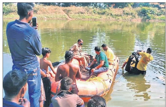
ସାତାକୁ ସୁବାଦାଭର ପୋଖରୀରେ ଖୋଜୁଛନ୍ତି।