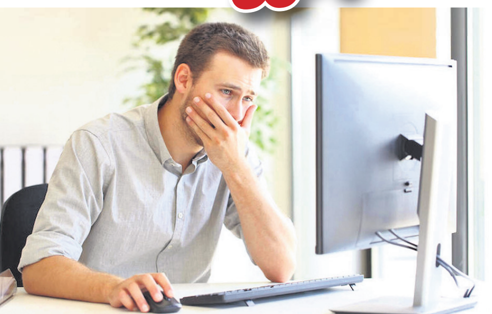
ଦୁର୍ଦ୍ଦିନ ମନ ଭିତରେ ବହୁ ଦିନ ଧରି ବସା ବାନ୍ଧି ରହିବା ଦ୍ୱାରା ମନ ଭାରାକ୍ରାନ୍ତ ହୋଇ ତାହା ମାନସିକ ତଥା ଶାରୀରିକ ପ୍ରସ୍ତରରେ ପ୍ରଭାବ ପକାଇ ଉଚ୍ଚ ରକ୍ତଚାପ, ମଧୁମେହ, ହୃଦ୍‌ରୋଗ, ଶ୍ୱାସ, ଅଜୀର୍ଣ୍ଣ, ମୁଣ୍ଡ ବ୍ୟଥା, ଅନିଦ୍ରା ସହ ଶରୀର କ୍ଳାନ୍ତି ଆଦି ବିଭିନ୍ନ ରୋଗ ସୃଷ୍ଟି ହେବାର ଯଥେଷ୍ଟ ଆଶଙ୍କା ରହିଥାଏ ...

ସଂସ୍କୃତି ଓ ପରମ୍ପରା, ସାମାଜିକ ରୀତିନୀତି ଦୈନିକ ଖାଦ୍ୟ ପାନୀୟ ଶୈଳୀ, ଆଧ୍ୟାତ୍ମିକ ଚିନ୍ତାଧାରା ସହ ଧର୍ମ, ନ୍ୟାୟ, ସତ୍ୟମାର୍ଗଠାରୁ ବେଳେ ବେଳେ ନିଜକୁ ଦୂରରେ ରଖିବା ପାଇଁ ପସନ୍ଦ କରି ବିଭିନ୍ନ ଦୁର୍ଦ୍ଦିନ ଚିନ୍ତାଧାରା କାର୍ଯ୍ୟ କରୁଛି। ଏହାର ଫଳ ସ୍ୱରୂପ ମନୁଷ୍ୟ ମନରେ ଚିନ୍ତା ଲାଗୁତ ହୋଇ ଶରୀରରେ ବିଭିନ୍ନ ମାନସିକ ରୋଗ ସହ ଶାରୀରିକ ରୋଗ ମଧ୍ୟ ହେବାର ଯଥେଷ୍ଟ ଆଶଙ୍କା ରହିଛି। ଦୁର୍ଦ୍ଦିନ ମନ ଭିତରେ ବହୁଦିନ ଧରି ବସା ବାନ୍ଧିରହିବା ଦ୍ୱାରା ମନ ଭାରାକ୍ରାନ୍ତ ହୋଇ ତାହା ମାନସିକ ତଥା ଶାରୀରିକ ପ୍ରସ୍ତର ପକାଇ ଉଚ୍ଚ ରକ୍ତଚାପ, ମଧୁମେହ, ହୃଦ୍‌ରୋଗ, ଶ୍ୱାସ, ଅଜୀର୍ଣ୍ଣ, ମୁଣ୍ଡ ବ୍ୟଥା, ଅନିଦ୍ରା ସହ ଶରୀର କ୍ଳାନ୍ତି ଆଦି ବିଭିନ୍ନ ରୋଗ ସୃଷ୍ଟି ହେବାର ଯଥେଷ୍ଟ ଆଶଙ୍କା ରହିଥାଏ। ଆମ ମନରେ କୌଣସି ଘଟଣା କିମ୍ବା ଦୁର୍ଘଟଣା ନେଇ ଅତ୍ୟଧିକ ଚିନ୍ତା କରିବା, କୌଣସି ଅତ୍ୟନ୍ତ ଦୁଃଖ କଥାରେ ମିତ୍ରମାଣ ହୋଇ ଭାଙ୍ଗିପଡ଼ିବା ଦ୍ୱାରା ମନର ଦୁର୍ଦ୍ଦିନ ମାନସିକ ପ୍ରସ୍ତରରେ ତାହାର ପ୍ରଭାବ ସାମିତ ନ ରଖି ତାହା ଶରୀର ଉପରେ ପ୍ରତିକୂଳ ପ୍ରଭାବ ପକାଇ ଥାଏ। ଆମେ ଯଦି କୌଣସି ଗଭୀର ଦୁଃଖଦ ଖବର ଶୁଣିବା, ଜୀବନ ପ୍ରତି ବିପଦର ଆଶଙ୍କା, ନିଜର ସମ୍ପାଦ ହାନି ହୋଇ, ଅପମାନିତ ବୋଧ କରିବା ପରି ଘଟଣା ହେଉ କିମ୍ବା କୌଣସି ଘଟଣାକୁ ନେଇ ମନରେ ଅତ୍ୟନ୍ତ ଘୋର (ରାଗ) ସୃଷ୍ଟି ହେବା ଦ୍ୱାରା ଏହା ମନ ଉପରେ ଗଭୀର ଗାପ ସୃଷ୍ଟି ହୋଇ ଶରୀର ପ୍ରକୃତ ସ୍ୱାସ୍ଥ୍ୟ, ନିଶ୍ୱାସ ପ୍ରଣାସରେ ପ୍ରଖରତା ଆଦି ହୃଦ୍‌ସ୍ପନ୍ଦନ ବୃଦ୍ଧି ସହ ନାଡ଼ୀର