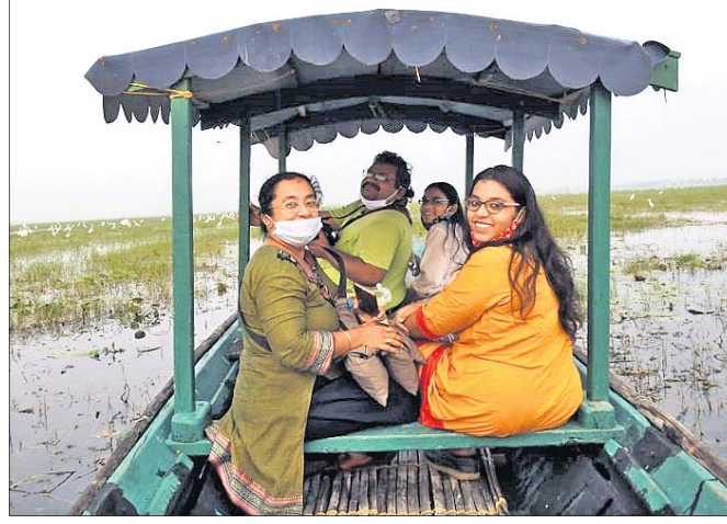
ପର୍ଯ୍ୟଟକମାନେ ତଜାରେ ଭ୍ରମଣ କରୁଛନ୍ତି।