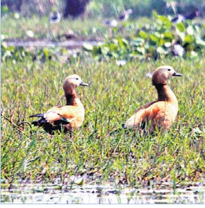
ରୁଟି ସେଲ୍ ଡକ୍।