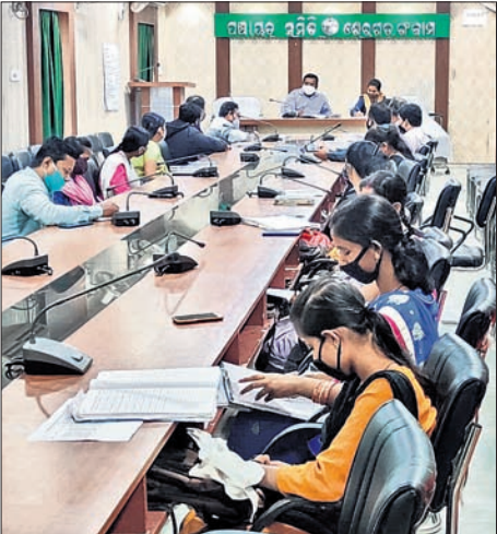
ବୈଠକରେ ଯୋଗ ଦେଇଥିବା ଅଧିକାରୀ ଓ କର୍ମଚାରୀ ମାନେ।

ଶେରଗଡ଼, ୧୩୧୨ (ଡି.ଏନ୍.ଏ.) ଶେରଗଡ଼ ବ୍ଲକ୍ ସଭାଗୃହରେ ରବିବାର ପ୍ରଶାସନ ଓ ବ୍ୟାଙ୍କ ଅଧିକାରୀମାନଙ୍କର ମିଳିତ ବୈଠକ ଅନୁଷ୍ଠିତ ହୋଇଯାଇଛି।