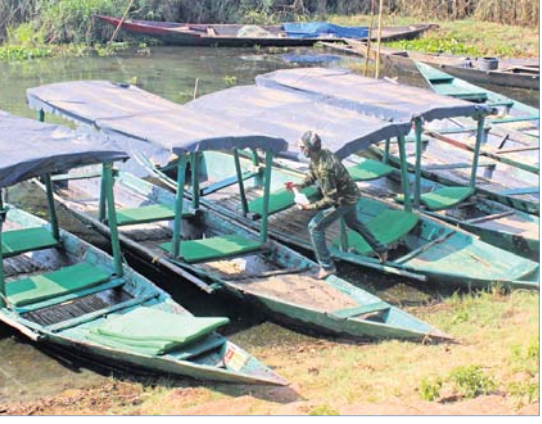
ତଜାଗାଳକ୍ ସାମାଜିକ କରାଯାଇଛି।

ସମସ୍ୟା ପର୍ଯ୍ୟଟକଙ୍କ ଆଗମନରେ ବାଧ୍ୟ ହୋଇଛି। ରେଳ ଓ ବିମାନ ସେବା ଏଯାବତ୍ ସ୍ୱାଭାବିକ ହୋଇ ନ ଥିବାରୁ ବାହାର ପର୍ଯ୍ୟଟକ ସେପରି ଆସିପାରୁନାହାନ୍ତି। କରୋନା ଭୟରେ ରାଜ୍ୟର ପର୍ଯ୍ୟଟକମାନେ ପିଲାଛୁଆ ଧରି ଯିବାକୁ ଭିତର ମଣ୍ଡନାହାନ୍ତି। ଏପଟେ ବସ୍ ଓ ଅନ୍ୟ ଯାତାବାହୀ ଗାଡ଼ି ପର୍ଯ୍ୟାପ୍ତ ପରିମାଣରେ ଚଳାଚଳ କରୁ ନ ଥିବାରୁ ଯେଉଁମାନେ ଆସୁଛନ୍ତି ସେମାନେ ନାନା ହତହତାର ସମ୍ମୁଖୀନ ହେଉଛନ୍ତି। ଏଣେ ଲୋକ ନ ହେଲେ ତକା ଗଢୁନି। କାଁଆଁ ପର୍ଯ୍ୟଟକ ଆସୁଥିବାରୁ ମଙ୍ଗଳାୟୋଡ଼ିରେ ଲକୋ ଭୁବିଜମ ଭାଷଣ କ୍ଷତିଗ୍ରସ୍ତ ହୋଇଛି। କାମ ନ ପାଇ ବହୁ ବାର୍ତ୍ତାଗାଳକ୍ ଅନ୍ୟ ରାଜ୍ୟକୁ ଚାଲିଯାଉଛନ୍ତି। ଅନ୍ୟପକ୍ଷରେ ପର୍ଯ୍ୟଟକଙ୍କ ପାଇଁ ବନ ବିଭାଗ ଅସୁବିଧା କାମ୍ପ ସହ ସ୍ୱତନ୍ତ୍ର ବ୍ୟବସ୍ଥା କରି ବାହାରକୁ ଚାଲି ଯିବାକୁ ସୁରକ୍ଷା ପାଇଁ ପଦକ୍ଷେପ