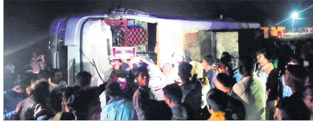
ଭୁବନେଶ୍ୱରର ବସ୍ ଓଲଟି

ସାରା ରାଜ୍ୟରେ ଏବେ ଥଣ୍ଡା ପ୍ରକୋପ ସାମାନ୍ୟ ମନ୍ ରହିଛି। କିନ୍ତୁ ସକାଳୁ ଘନ କୁହୁଡ଼ିରେ ଆଲୁଦିତ ହେଉଛି ରାଜ୍ୟର ଅଧିକାଂଶ ଅଞ୍ଚଳ। ପ୍ରାୟ ୮ଟା ପର୍ଯ୍ୟନ୍ତ କୁହୁଡ଼ି ରହୁଥିବାରୁ ରାସ୍ତାଘାଟରେ ଯାତାୟତରେ ଅସୁବିଧା ହେଉଛି। ରବିବାର କେନ୍ଦ୍ରାପଡ଼ା, ଜଗତସିଂହପୁର, କଟକ, ଖୋର୍ଦ୍ଧା, ନୟାଗଡ଼, କନ୍ଧମାଳ, ରାୟଗଡ଼ା, କୋରାପୁଟ, ମାଲକାନଗିରି ଓ ବୌଦ୍ଧରେ ଅଧିକ କୁହୁଡ଼ି ପରିଲକ୍ଷିତ ହୋଇଥିଲା। ସୋମବାର ମଧ୍ୟ ରାଜ୍ୟର କିଛି ଅଞ୍ଚଳରେ କୁହୁଡ଼ି ରହିବ। ରାୟଗଡ଼ା, କନ୍ଧମାଳ, କୋରାପୁଟ, ମାଲକାନଗିରି ଓ ନୟାଗଡ଼ରେ କୁହୁଡ଼ି ଦେଖାଯିବ ବୋଲି ଭୁବନେଶ୍ୱର ଆଞ୍ଚଳିକ ପାଣିପାଗ କେନ୍ଦ୍ର ପୂର୍ବାନୁମାନ କରିଛି। ତେବେ ଆସନ୍ତା ୧୭ ତାରିଖରୁ ରାଜ୍ୟରେ ଶୀତ ବଢ଼ିବ। ରାତିର ତାପମାତ୍ରା ପ୍ରାୟ ୪ରୁ ୫ଡିଗ୍ରୀ ହ୍ରାସ ପାଇବ। କିନ୍ତୁ ୧୭ ତାରିଖରେ ଉତ୍ତର ଆନ୍ଧ୍ୟାଚରୀ ଓଡ଼ିଶାରେ ସ୍ୱଳ୍ପ ଧରଣର ବର୍ଷା ହେବା ସମ୍ଭାବନା ରହିଥିବା ପାଣିପାଗ କେନ୍ଦ୍ର ସୂଚନା ଦେଇଛି। ରବିବାର ସୁନ୍ଦରଗଡ଼ ଓ ଦାରିଙ୍ଗବାଡ଼ିରେ ସର୍ବନିମ୍ନ ତାପମାତ୍ରା ୧୨.୦ଡିଗ୍ରୀ ରହିଥିବାବେଳେ କୋରାପୁଟରେ ୧୩.୨, ଭବାନୀପାଟଣା ଓ ବାରିପଦାରେ ୧୪.୦, ଝାରସୁଗୁଡ଼ା ୧୪.୬, ଚାଲଚେର ୧୪.୮, କେନ୍ଦୁଝରଗଡ଼, ବଲାଙ୍ଗୀର ଓ ବୌଦ୍ଧରେ ୧୫.୦ ଡିଗ୍ରୀ ରେକର୍ଡ କରାଯାଇଛି।