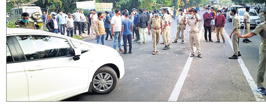
ଗାଡ଼ି ଯାଞ୍ଚ କରୁଛି ପୋଲିସ୍। ମିଳିଥିଲା। ଗୋପାଳପୁର କଲେଜ ଛକକୁ ବୋଲାଇଁ ପର୍ଯ୍ୟନ୍ତ ଲୋକେ ଚାଲିଚାଲି ଯାଉଥିବା ଦେଖାଯାଇଥିଲା।

୫୦୦ ଏସ୍.ଏସ୍.ଏସ୍. ରକ୍ଷା ଦିଆଯାଇ ନ ଥିବା ଜାରିକା ମିଶନ ପକ୍ଷରୁ ଜଣାଯାଇଥିଲା। ଏସ୍.ଏସ୍.ଏସ୍. କେବେ ରକ୍ଷା ଯୋଗାଣ ହେବ ବୋଲି ବିଚ୍ଛିନ୍ନ ସାହୁ ବ୍ୟାଙ୍କର ମ୍ୟାନେଜରମାନଙ୍କୁ ପଚାରିଥିଲେ।