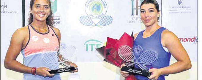
ଟ୍ରିପ୍ ସହ ଅଜିତା ରାଜନା ଓ ଟାଇଲ ପାର୍ଟନର ଏକାକରିନ୍ ଗୋରୁରାଣୀ

ଦୁବାଇ, ୧୩।୧୨ (ପି.ଟି.): ଭାରତୀୟ ଟପ୍ ଟେନିସ ଖେଳାଳି ଅଜିତା ରାଜନା