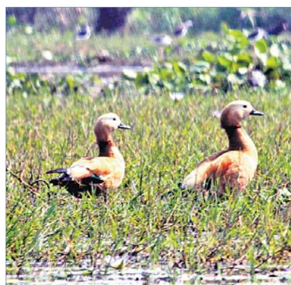
ରୁଟି ସେଲ୍ ଡକ୍।