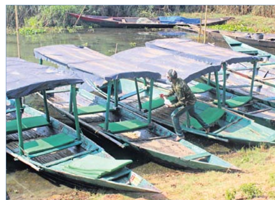
ତଜାଗୁଡ଼ିକୁ ସାନିଟାଇଜ୍ କରାଯାଇଛି।

ସମସ୍ୟା ପର୍ଯ୍ୟଟକଙ୍କ ଆଗମନରେ ବାଧ୍ୟ ହୋଇଛି। ରେଳ ଓ ବିମାନ ସେବା ଏଯାବତ୍ ସ୍ୱାର୍ଭାବିକ ହୋଇ ନ ଥିବାରୁ ବାହାର ପର୍ଯ୍ୟଟକ ସେପରି ଆସିପାରୁନାହାନ୍ତି। କରୋନା ଭୟରେ ରାଜ୍ୟର ପର୍ଯ୍ୟଟକମାନେ ପିଲାଛୁଆ ଧରି ଯିବାକୁ ଭିତର ମଣ୍ଡନାହାନ୍ତି। ଏପଟେ ବସ୍ ଓ ଅନ୍ୟ ଯାତାବାହୀ ଗାଡ଼ି ପର୍ଯ୍ୟାପ୍ତ ପରିମାଣରେ ଚଳାଚଳ କରୁ ନ ଥିବାରୁ ଯେଉଁମାନେ ଆସୁଛନ୍ତି ସେମାନେ ନାନା ହତହତୀର ସମ୍ମୁଖୀନ ହେଉଛନ୍ତି। ଏଣେ ଲୋକ ନ ହେଲେ ତକା ଗରୁଜି। କାହା ପର୍ଯ୍ୟଟକ ଆସୁଥିବାରୁ ମଙ୍ଗଳାୟୋଡ଼ିରେ ଲକୋ ରୁଜିଙ୍ଗ ଭାଗ୍ୟ ଯତ୍ନଗ୍ରସ୍ତ ହୋଇଛି। କାମ ନ ପାଇ ବସୁ ବାର୍ତ୍ତା ଗାଭଡ଼ ଅନ୍ୟ ରାଜ୍ୟକୁ ଚାଲିଯାଉଛି। ପାଇଁ ପର୍ଯ୍ୟଟକଙ୍କ ପ୍ରବେଶ ବନ୍ଦ ରହିଥିଲା। ନଭେମ୍ବରରୁ ଧାରେ ଧାରେ ପର୍ଯ୍ୟଟକ ଆସିବା ଆରମ୍ଭ କରିଛନ୍ତି। ହେଲେ ଏବେ ବି ଯାତାୟାତ