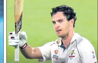
ବେନ୍ ମ୍ୟାକ୍ଡର୍ମୋଟ୍ ଓ କ୍ୟାଟ୍ ଫ୍ଲିକ୍ସର ପ୍ରତିଦ୍ୱନ୍ଦ୍ୱୀ

ସିଦ୍ଧାରେ ସୁଦୂରାଠାରୁ ଆରମ୍ଭ ହେବାକୁ ଯାଉଥିବା ଦିବାରାତ୍ର ପ୍ରଥମ ଚେଷ୍ଟା