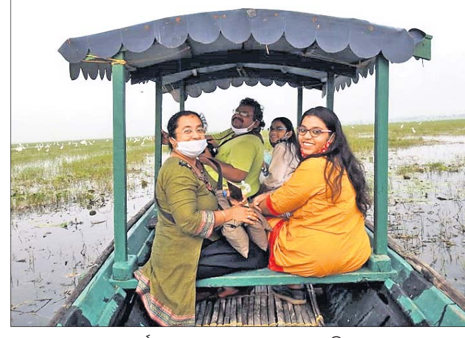
ପର୍ଯ୍ୟଟକମାନେ ତଜାରେ ଭ୍ରମଣ କରୁଛନ୍ତି।