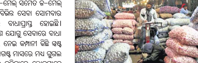
ନୂଆଦିଲ୍ଲୀ, ୧୪/୧୨: ପାଇକାରୀ ମୂଲ୍ୟାଭିତ୍ତିକ ମୁଦ୍ରାଂଶୁତି (ଡକ୍ୟୁମେଣ୍ଟ) ୯ ମାସର ସର୍ବୋଚ୍ଚ ସ୍ତରରେ ରହିଛି । ନଭେମ୍ବରରେ ଏହା ୧.୫୫% ସ୍ତର ହ୍ରାସ ପାଇଛି । ମାନ୍ୟତାପ୍ରାପ୍ତ ସାମଗ୍ରୀ ଦର ଉଚ୍ଚରେ ରହିବା ଯୋଗୁଁ ଏଭଳି ସ୍ଥିତି ଉତ୍ପନ୍ନ ହୋଇଛି । ଏହି ସମୟରେ ଖାଦ୍ୟ ସାମଗ୍ରୀ ଦରଦାମ ସ୍ୱାଭାବିକ ରହିଛି । ଚଳିତ ବର୍ଷ ଅକ୍ଟୋବରରେ ଡକ୍ୟୁମେଣ୍ଟ ୧.୪୮% ସ୍ତରରେ ରହିଥିଲା । ଗତ ବର୍ଷ ନଭେମ୍ବରରେ ଏହା ୦.୫୮%ରେ ଥିଲା । ଫେବୃଆରୀ ପରଠାକୁ ପାଇକାରୀ ମୂଲ୍ୟାଭିତ୍ତିକ ମୁଦ୍ରାଂଶୁତି ସର୍ବୋଚ୍ଚ ସ୍ତର ରହିଛି । ଫେବୃଆରୀରେ ଏହା ୨.୨୬% ସ୍ତରରେ ରହିଥିଲା । ନଭେମ୍ବର ମାସରେ ଖାଦ୍ୟ ସାମଗ୍ରୀ ଦରରେ ମୁଦ୍ରାଂଶୁତି ୩.୯୪% ସ୍ତରରେ ରହିଛି । ଏହା ଅକ୍ଟୋବର ମାସରେ ୬.୩୭% ସ୍ତରରେ ରହିଥିଲା ।

ଗୁଗଲର ବିଭିନ୍ନ ସେବା ବାଧ୍ୟପ୍ରାପ୍ତ ନୂଆଦିଲ୍ଲୀ, ୧୪/୧୨: ସର୍ବ ଲଞ୍ଜିନ ଗୁଗଲର ଇ-ମେଲ୍ ସମେତ ଇ-ମେଲ୍ ସହ ଅନ୍ୟ ବିଭିନ୍ନ ସେବା ସୋମବାର ଅପରାହ୍ନରେ ବାଧ୍ୟପ୍ରାପ୍ତ ହୋଇଛି । କେଉଁ କାରଣ ଯୋଗୁଁ ସେବାରେ ବାଧା ଆସିଲା ସେ ନେଇ କମ୍ପାନୀ କିଛି ସୂଚନା ଦେଇନାହିଁ । ଅଗଷ୍ଟ ମାସରେ ମଧ୍ୟ ଗୁଗଲ ସେବା ଲାଭ କରିବାରେ ଲୋକମାନେ ବିଭିନ୍ନ ସମସ୍ୟା ସାମ୍ନା କରିଥିଲେ ।