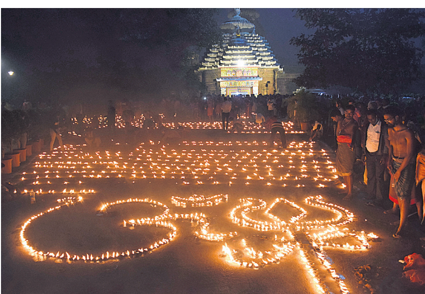
ଲିଙ୍ଗରାଜ ମନ୍ଦିର ପାଇଁ କ୍ୟାବିନେଟ୍ରେ ଅଧ୍ୟାୟେକ୍ସ ମଞ୍ଜୁର ପରେ ମନ୍ଦିର ସମ୍ମୁଖରେ ୧୦ ହଜାର ଦୀପଦାନ କରାଯାଇଛି।

ଭୁବନେଶ୍ଵର, ୧୪।୧୨ (ବୁଧବେ) ପୁରୀ ଶ୍ରୀମନ୍ଦିର ଭଳି ଭୁବନେଶ୍ଵରରେ ଥିବା ମହାପ୍ରଭୁ ଶ୍ରୀ ଲିଙ୍ଗରାଜ ମନ୍ଦିର ପରିଚାଳନା ପାଇଁ ରାଜ୍ୟ ସରକାର ଏକ ସ୍ଵତନ୍ତ୍ର ଆଇନ ଆଣିଛନ୍ତି। ଏହାଦ୍ଵାରା ମନ୍ଦିର, ଏହାର ସମ୍ପତ୍ତି, ପରିସର ମଧ୍ୟରେ ଓ ବାହାରେ ଥିବା ଅନ୍ୟ ମନ୍ଦିର, ପବିତ୍ର ସ୍ଥାନ ଓ ମଠ ସମ୍ପର୍କିତ ବିଷୟଗୁଡ଼ିକର ସୁପରିଚାଳନା ଓ ସୁଶାସନକୁ ଦୃଷ୍ଟିରେ ରଖି ଏହାର ପରିଚାଳନା ଦାୟିତ୍ଵ ଏକ କର୍ମଚିକୁ ନ୍ୟସ୍ତ କରାଯିବ। ରାଜ୍ୟ ସରକାର ସ୍ଵତନ୍ତ୍ର ଆଇନକୁ କାର୍ଯ୍ୟକାରୀ କରିବା ପାଇଁ ଅଧ୍ୟାୟେକ୍ସ ଆଣିଛନ୍ତି। ଏହାଦ୍ଵାରା ମନ୍ଦିର କାର୍ଯ୍ୟଗୁଡ଼ିକର ଉତ୍ତମ ଏବଂ ସୁ ପରିଚାଳନା ହେବା ସହିତ ତାହାପ୍ରା, ଭକ୍ତ ଓ ଉପାସକମାନଙ୍କୁ ଉନ୍ନତ ମାନର ସୁବିଧା ସୁଯୋଗ ଯୋଗାଇ ଦିଆଯାଇପାରିବ। ଏହି ଆଇନ ମନ୍ଦିର ସମ୍ପତ୍ତି ସୁରକ୍ଷିତ ରଖିବା ପାଇଁ କର୍ମଚିକୁ ସମ୍ବଳ କରିବ। ଭକ୍ତ ଅଧ୍ୟାୟେକ୍ସ ଅଣାଯିବା ପରେ ଶ୍ରୀଲିଙ୍ଗରାଜ ମନ୍ଦିର ରାଜ୍ୟ ସରକାର ରାଜ୍ୟରେ ତାହାର ଅଭାବ ପୂରଣ କରିବା, ମେଡିକାଲ ଶିକ୍ଷାର ପ୍ରସାର ଏବଂ ଉନ୍ନତ ମାନର ସ୍ଵାସ୍ଥ୍ୟସେବା ଯୋଗାଇ ଦେବା ନିମନ୍ତେ ଚର୍ଚ୍ଚା କି ମାଧ୍ୟମରେ ଯାଜପୁର ଓ ପୁରୀଠାରେ ଦୁଇଟି ମେଡିକାଲ କଲେଜ ଓ ହସ୍ପିଟାଲ ନିର୍ମାଣ କରିବାକୁ ନିଷ୍ପତ୍ତି ନେଇଛନ୍ତି। ଏଥିପାଇଁ ୬୫୧.୦୭ କୋଟି ଟଙ୍କା ଫ୍ଲୁସ୍ଟା-୪