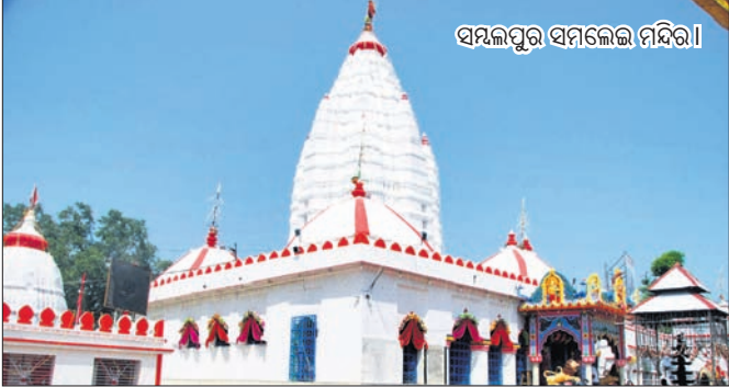
ସମଲେଇ ସମଲେଇ ମନ୍ଦିର।

ସମଲେଇ ସମଲେଇ ମନ୍ଦିର ଖୋଲିବା ନେଇ ଆଶା ରଖାଯାଇଛି। ସୋମବାର ସନ୍ଧ୍ୟାରେ ଗ୍ରନ୍ଥବୋଧି ପକ୍ଷରୁ ଅନୁଷ୍ଠିତ ବୈଠକରେ ଏହା ସ୍ଵୀକୃତ ହୋଇଛି। ନିର୍ଦ୍ଦିଷ୍ଟ ଦିନ ଧାର୍ଯ୍ୟ ହୋଇ ବୋଲି ଗ୍ରନ୍ଥବୋଧି ସଭାପତି ସଞ୍ଜୟ କୁମାର ବାବୁ ସୂଚନା ଦେଇଛନ୍ତି। ସେ ଆଲୋଚନା ହୋଇଥିଲା। ମନ୍ଦିର ଖୋଲିବା ନେଇ ସରକାରଙ୍କ ଏଠିପ୍ରତି ସମ୍ପୂର୍ଣ୍ଣ ସହଯୋଗ ଦିଆଯାଉଛି। ଗାତ ପୋତାଯିବା ଅପେକ୍ଷା କରାଯାଇଛି। ଏହା ସହ ଜିଲ୍ଲା ପ୍ରଶାସନର ଅନୁମତି ନିଆଯିବ। ପ୍ରଥମ ୫ଦିନ ସମଲେଇବାସୀଙ୍କୁ ଦର୍ଶନ କରିବାର ସୁଯୋଗ ଦିଆଯିବ। ପରେ ଅନ୍ୟ ଭକ୍ତଙ୍କ ପାଇଁ ସୁବିଧା କରାଯିବ। ମନ୍ଦିର ପରିସରରେ ଲାଲ୍ ଓ ସାଓନ୍ଧ ଭଳି ଉନ୍ନତମାନଙ୍କୁ କାମ କରାଯାଉଛି। ସେଥିପାଇଁ ମନ୍ଦିର ପରିସରରେ ଗାତ