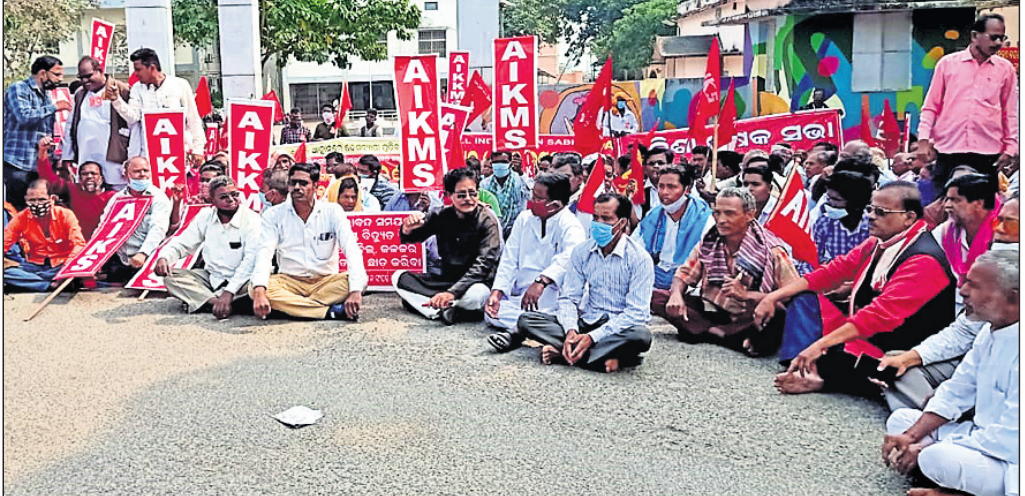
ଧାରଣାରେ ବସିଥିବା କୃଷକ ସଙ୍ଗଠନର ସଦସ୍ୟମାନେ ।