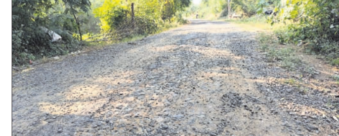
ରାସ୍ତାକୁ ପିଚୁ ଭରିଯାଇଛି ।

ପ୍ରଧାନମନ୍ତ୍ରୀ ଗ୍ରାମ ସଡ଼କ ଯୋଜନାରେ ନିର୍ମିତ ଝରପଲ୍ଲୀ ଓ ରାଧାମୋହନପୁର ରାସ୍ତା ଶୋଚନୀୟ ହୋଇପଡ଼ିଛି । ଏହା ଗୋପାଳପୁର ଥାନା ରୋଡ୍‌ସେକ୍ସରେ ପଞ୍ଚାୟତ ଅନ୍ତର୍ଗତ ଝିଲ୍‌ପଦର, ଝରପଲ୍ଲୀ, ରାଧାମୋହନପୁର ଓ ରୋଡ୍‌ସେକ୍ସରେ ସଂଯୋଗ କରୁଛି । ମିଳିଥିବା ତଥ୍ୟନୁଯାୟୀ, ୨୦୧୮ରେ ପ୍ରଧାନମନ୍ତ୍ରୀ ଗ୍ରାମ ସଡ଼କ ଯୋଜନାରେ ଏକ କୋଟି ୮୭ ଲକ୍ଷ ଟଙ୍କା ବ୍ୟୟରେ ୨.୯୭୫ କି.ମି. ରାସ୍ତା କାର୍ଯ୍ୟ ଆରମ୍ଭ ହୋଇଥିଲା । ପିଚୁ ରାସ୍ତା ୨.୩୮୫ ଓ ୦.୫୯୦ କି.ମି. କଂକ୍ରିଟ୍ ରାସ୍ତା ରହିଛି ।