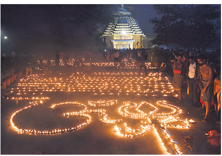
ଲିଙ୍ଗରାଜ ମନ୍ଦିର ପାଇଁ କ୍ୟାବିନେଟ୍ରେ ଅଧ୍ୟାୟେକ୍ସ ମଞ୍ଜୁର ପରେ ମନ୍ଦିର ସମ୍ମୁଖରେ ୧୦ ହଜାର ଦୀପଦାନ କରାଯାଇଛି।

ଭୁବନେଶ୍ୱର, ୧୪।୧୨ (ବ୍ୟୁରୋ) ପୁରୀ ଶ୍ରୀମନ୍ଦିର ଭଳି ଭୁବନେଶ୍ୱରରେ ଥିବା ମହାପ୍ରଭୁ ଶ୍ରୀ ଲିଙ୍ଗରାଜ ମନ୍ଦିର ପରିଚାଳନା ପାଇଁ ରାଜ୍ୟ ସରକାର ଏକ ସ୍ୱତନ୍ତ୍ର ଆଇନ ଆଣିଛନ୍ତି। ଏହାଦ୍ୱାରା ମନ୍ଦିର, ଏହାର ସମ୍ପତ୍ତି, ପରିସର ମଧ୍ୟରେ ଓ ବାହାରେ ଥିବା ଅନ୍ୟ ମନ୍ଦିର, ପବିତ୍ର ସ୍ଥାନ ଓ ମଠ ସମ୍ପର୍କିତ ବିଷୟଗୁଡ଼ିକର ସୁପରିଚାଳନା ଓ ସୁଶାସନକୁ ଦୃଷ୍ଟିରେ ରଖି ଏହାର ପରିଚାଳନା ଦାୟିତ୍ୱ ଏକ କର୍ମଚିକୁ ନ୍ୟସ୍ତ କରାଯିବ। ରାଜ୍ୟ ସରକାର ସ୍ୱତନ୍ତ୍ର ଆଇନକୁ କାର୍ଯ୍ୟକାରୀ କରିବା ପାଇଁ ଅଧ୍ୟାୟେକ୍ସ ଆଣିଛନ୍ତି। ଏହାଦ୍ୱାରା ମନ୍ଦିର କାର୍ଯ୍ୟଗୁଡ଼ିକର ଉତ୍ତମ ଏବଂ ସୁ ପରିଚାଳନା ହେବା ସହିତ ତାହାପ୍ରା, ଭକ୍ତ ଓ ଉପାସକମାନଙ୍କୁ ଉନ୍ନତ ମାନର ସୁବିଧା ସୁଯୋଗ ଯୋଗାଇ ଦିଆଯାଇପାରିବ। ଏହି ଆଇନ ମନ୍ଦିର ସମ୍ପତ୍ତି ସୁରକ୍ଷିତ ରଖିବା ପାଇଁ କର୍ମଚିକୁ ସମ୍ବଳ କରିବ। ଭକ୍ତ ଅଧ୍ୟାୟେକ୍ସ ଅଣାଯିବା ପରେ ଶ୍ରୀଲିଙ୍ଗରାଜ ମନ୍ଦିର ରାଜ୍ୟ ସରକାର ରାଜ୍ୟରେ ତାହାର ଅଭାବ ପୂରଣ କରିବା, ମେଡିକାଲ ଶିକ୍ଷାର ପ୍ରସାର ଏବଂ ଉନ୍ନତ ମାନର ସ୍ୱାସ୍ଥ୍ୟସେବା ଯୋଗାଇ ଦେବା ନିମନ୍ତେ ଚର୍ଚ୍ଚା କି ମାଧ୍ୟମରେ ଯାଜପୁର ଓ ପୁରୀଠାରେ ଦୁଇଟି ମେଡିକାଲ କଲେଜ ଓ ହସ୍ପିଟାଲ ନିର୍ମାଣ କରିବାକୁ ନିଷ୍ପତ୍ତି ନେଇଛନ୍ତି। ଏଥିପାଇଁ ୬୫୧.୦୭ କୋଟି ଟଙ୍କା ପୃଷ୍ଠା-୪