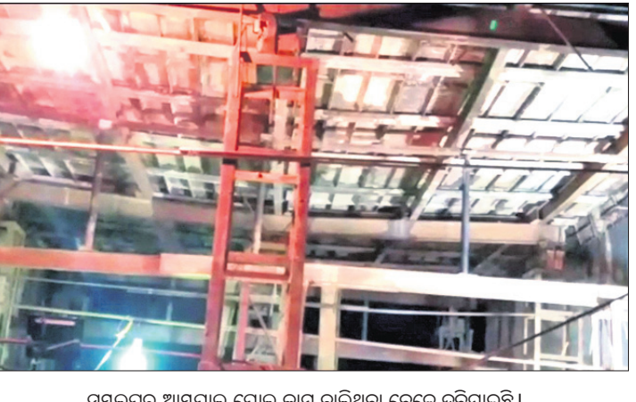
ସମଲେଇ ଆୟପାଳ ପୋଲ କାମ ଚାଲୁଥିବା ବେଳେ ଦରିଗଲାଇଛି।

ସମଲେଇ ଜିଲ୍ଲା ସୁମୁଗୁରା କଳ କନ୍ସଟ୍ରକ୍ସ ପକ୍ଷାଧିକ ଆୟପାଳ କୋରରେ ନିର୍ମାଣାଧୀନ ପୋଲ ସୋମବାର ସନ୍ଧ୍ୟାରେ ଦରିଗଲାଇଛି। ଫଳରେ ପୋଲ କାମରେ ନିୟୋଜିତ ଶ୍ରମିକ ବର୍ତ୍ତି ଯାଇଛନ୍ତି। ପୂର୍ବ ବିଭାଗ ପକ୍ଷରୁ ଏହି ପୋଲ କାମ ଚାଲୁଥିଲା। ପୂର୍ବରୁ ନିର୍ମାଣନର କାମକୁ ନେଇ ଧରିତ୍ରୀରେ ନଭେମ୍ବର ୨ରେ ଖବର ପ୍ରକାଶ ପାଇଥିଲା। ହେଲେ ବିଭାଗ ପକ୍ଷରୁ କୌଣସି ପଦକ୍ଷେପ ନିଆଯାଇ ନ ଥିଲା। ଘଟଣା ପରେ ଆଖପାଖ ଗ୍ରାମବାସୀ ଯାଇ କାମ ବନ୍ଦ କରିଦେଇଛନ୍ତି। ସେମାନେ କହିଛନ୍ତି, ପୂର୍ବରୁ ନିର୍ମାଣନର କାମ ନେଇ ଅଭିଯୋଗ ହୋଇଥିଲା। ହେଲେ ସ୍ଥାନୀୟ କନିଷ୍ଠ ଯନ୍ତ୍ରୀ ଏହାକୁ ଗୁରୁତ୍ଵ ଦେବା ପରିବର୍ତ୍ତେ ଆମକୁ ଧନକଟକ ଦେଉଥିଲେ। ଠିକାଦାର ମଧ୍ୟ ଦୁର୍ବ୍ୟବହାର କରିବା ସହ ଭୟ ସୃଷ୍ଟି କରୁଥିଲେ। ଏବେ ପୋଲର ଛାତ ପକାଯାଉଥିବା ସମୟରେ