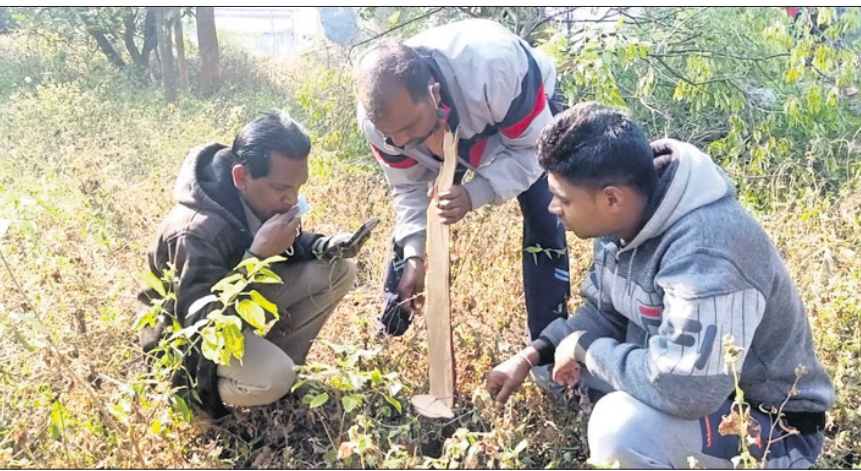
ବନ ବିଭାଗ ଅଧିକାରୀମାନେ ତଦନ୍ତ କରୁଛନ୍ତି।

ଉତ୍ତରକୋଟ,୧୪।୧୨(ସ.ପ୍ର.) ନବରଙ୍ଗପୁର ଜିଲ୍ଲା ଉତ୍ତରକୋଟ ପୌରାଞ୍ଚଳ ଅଧୀନ ଗୋଡ଼ିଗୁଡ଼ା(୨ନଂ. ଓଡ଼)ଅଞ୍ଚଳରୁ ରବିବାର ରାତିରେ ପ୍ରାୟ ୮ରୁ ଉର୍ଦ୍ଧ୍ୱ ଚନ୍ଦନଗଛ ଚୋରି ହୋଇଥିବା ଅଭିଯୋଗ ହୋଇଛି। ପୂର୍ବନା ଅନୁଯାୟୀ, ସୌନ୍ଦର୍ଯ୍ୟ ବୃଦ୍ଧି ପାଇଁ ସାହିର ଯୁବଗୋଷ୍ଠୀଙ୍କ ପ୍ରଚେଷ୍ଟାରେ ଚନ୍ଦନ ସମେତ ବିଭିନ୍ନ ଚାଷାଚାରଣ କରାଯାଇଥିଲା। ତେବେ ରବିବାର ରାତିରେ ଦୁର୍ଭିକ୍ଷମାନେ ଅଞ୍ଚଳକୁ ପ୍ରାୟ ୮ରୁ ଉର୍ଦ୍ଧ୍ୱ ଚନ୍ଦନ ଗଛ କାଟି ନେଇଯାଇଥିବା ଜଣାପଡ଼ିଛି। ମଧ୍ୟରାତ୍ରିରେ ଦୁର୍ଭିକ୍ଷମାନେ ସାହିରେ ପଶିଥିବା ସାହିବାସିନ୍ଦା ଜାଣିବାକୁ ପାଇଥିଲେ। କିନ୍ତୁ ସେମାନଙ୍କ ଘର ବାହାରେ ଦୁର୍ଭିକ୍ଷମାନେ ତାଲାପକାଇ ଗଛ କାଟିଥିଲେ। ତେଣୁ ସାହିବାସିନ୍ଦା ବାହାରକୁ ବାହାରିପାରି ନ ଥିଲେ। ତେବେ ସାହିବାସିନ୍ଦା ହୋହାଲ୍ଲା କରିବାକୁ ଆଉ କେତୋଟି ଗଛ ଅଧା