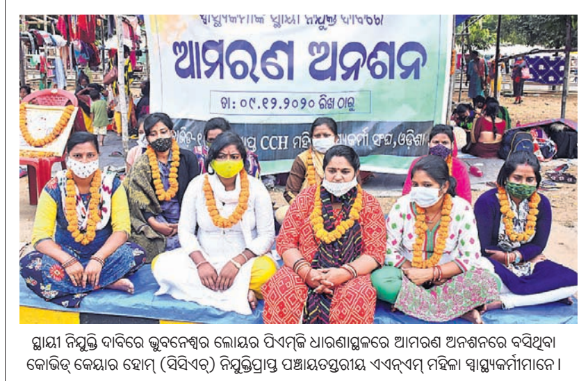
ସ୍ତ୍ରୀମାନଙ୍କୁ ଦାକ୍ଷିଣ୍ୟ ଉପରେ ଧରଣପୁରୀ ଧରଣପୁରୀ ସମାଜସେବକାଳରେ ଆମରଣ ଅନୁଷ୍ଠାନରେ ବସିଥିବା କୋରଲ୍ଲା କୋରଲ୍ଲା ହୋମ୍ (ସି.ଏସ୍) ନିଯୁକ୍ତିପ୍ରାପ୍ତ ପ୍ରଶାସକଗଣଙ୍କୁ ଏବଂଏମ୍ ମହିଳା ସାମ୍ମୁହାଣୀମାନେ।