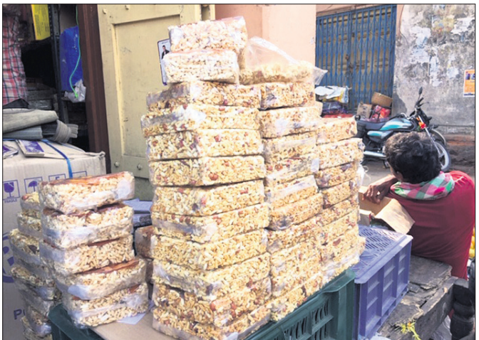
ବିକ୍ରୟ ପାଇ ରହିଥିବା ମୁଆଁ ।