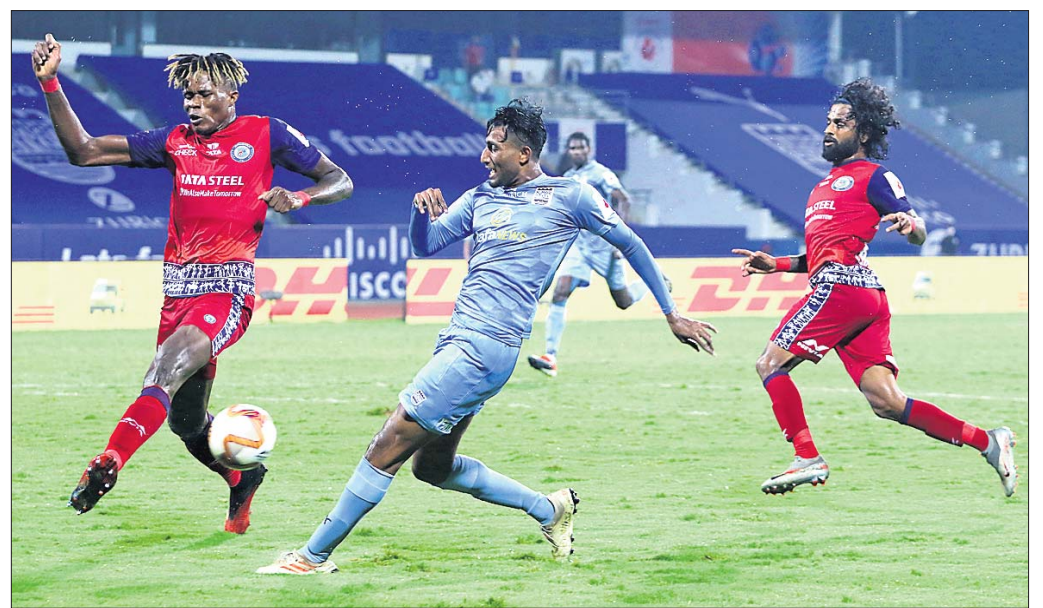
ସୋମବାର ଜାମସେଦପୁର ଓ ମୁମ୍ବାଇ ଯିବି ଏପ୍ରି ମଧ୍ୟରେ ଅନୁଷ୍ଠିତ ମ୍ୟାଚ୍ ।