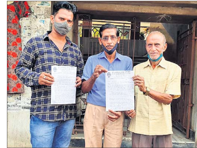
ସିଂହଦ୍ଵାର ଆନାରେ ଏତଲା ଦେବାକୁ ଆସିଥିବା ଶ୍ରୀଜଗନ୍ନାଥ ଭକ୍ତ ପରିଷଦର କର୍ମଚାରୀ।

ଗ୍ରାମସିନି ଦକ୍ଷିଣ ଦ୍ଵାର ପାଦୁକାକର ନିକଟରେ ଚପଲ ପିନ୍ଧି ବେଶ୍ ଉପରେ ବସି ୨ଜଣ ପୋଲିସ୍ କର୍ମଚାରୀ ଅବତ୍ତା ସେବନ କରୁଥିବାର ଦୃଶ୍ୟ ସାମାଜିକ ଗଣମାଧ୍ୟମରେ ଭାଇରାଲ ହେଉଛି। 'ଧରିତ୍ରୀ'ରେ ଏହି ଖବର ପ୍ରକାଶିତ ହେବା ପରେ ଫଟୋ ସାମାଜିକ ଗଣମାଧ୍ୟମରେ ଘୁରି ଚାଲିଥିଲା। ସୋମବାର ଶ୍ରୀଜଗନ୍ନାଥ ଭକ୍ତ ପରିଷଦ ଏ ନେଇ ସିଂହଦ୍ଵାର ଆନାରେ ଏତଲା ପୋଲିସ୍ କର୍ମଚାରୀଙ୍କୁ ଏଭଳି କାର୍ଯ୍ୟକଳାପକୁ ନିନ୍ଦା କରିଥିବା ବେଳେ ଆଇନଗତ କାର୍ଯ୍ୟାନୁଷ୍ଠାନ ବାଦି କରିଛନ୍ତି। ଅଭିଯୋଗକାରୀମାନେ