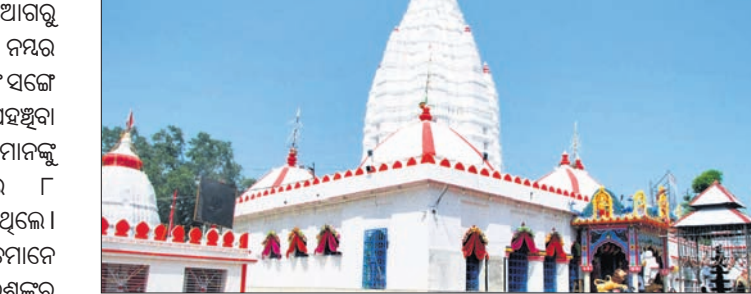
ସମଲେଇ ସମଲେଇ ମନ୍ଦିର।

କାର ମାଲିକ ଏନେଇ ଗାଡ଼ିକୁ ଛିପିଆରଏସ୍‌ରେ ପଢ଼ା କରିବା ସହ ପୋଲିସର ସହାୟତା ନେଇଥିଲେ। ବୌଦ୍ଧ ଆରକ୍ଷୀ ଅଧୀକାରୀଙ୍କ ତତ୍ପରତାରେ ଏକ ଟିମ୍ କରି ଗାଡ଼ିକୁ ପୁରୁଣାକଟକ ଥାନା ଅଧିକାରୀଙ୍କୁ ଜଣାଇ ଦେଇଛନ୍ତି। ଏନେଇ ପୁରୁଣାକଟକ ଥାନାରେ ଏକ ମାମଲା (ନଂ. ୧୫୦/୨୦) ରୁଜୁ ହୋଇଛି।