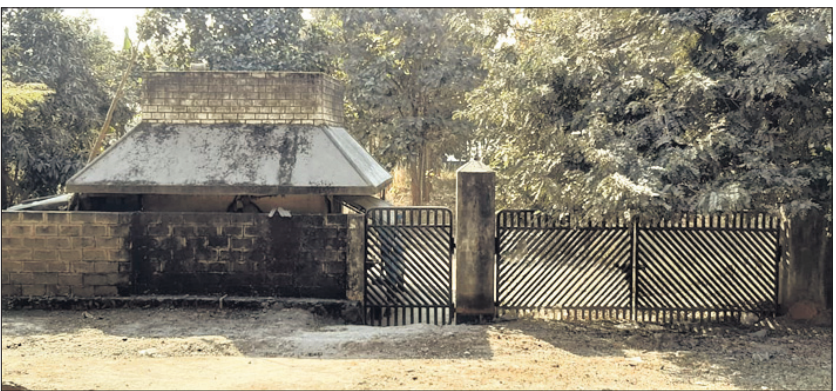
ବନ୍ଦ ପଡ଼ିଥିବା କପାକଳ।

ନବରଞ୍ଜପୁର ଜିଲ୍ଲା ଦିନେ କପାଗଣ ପାଇଁ ପରିଚିତ ଥିଲା। ୧୯୮୫ରୁ ୧୯୮୯ ପର୍ଯ୍ୟନ୍ତ ଗଣ୍ଡା ଅଧିକ ପରିମାଣରେ କପା ଗଣ୍ଡା କରୁଥିଲେ। ସେତେବେଳେ କପା କିଲୋ ପ୍ରତି ୭ ଟଙ୍କା ରହିଥିଲା। ଧଳାସୁନାଭାବେ ପରିଚିତ କପାଗଣକୁ ଭଲ ଲାଭ ମିଳୁଥିବାରୁ ୧୯୯୦ ବେଳକୁ ଜିଲ୍ଲାରେ ଅଧିକ ଗଣ୍ଡା କପାଗଣ ପ୍ରତି ଆଗ୍ରହ ପ୍ରକାଶ କରିଥିଲେ। ପରବର୍ତ୍ତୀ ସମୟରେ ଉମରକୋଟ୍‌ରେ ଏକ କପାକଳ ମଧ୍ୟ ଖୋଲିଥିଲା। ହେଲେ ଗଣ୍ଡାକୁ ଉପଯୁକ୍ତ ମୂଲ୍ୟ ନ ମିଳିବାରୁ ସେମାନେ କପାରୁ ମୁହଁ ଫେରାଇନେଲେ। ଯଦ୍ଵାରା କପାକଳ ମଧ୍ୟ ବନ୍ଦ ହୋଇଗଲା।