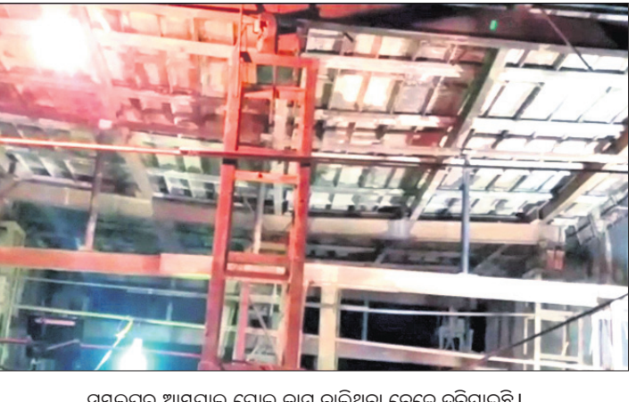
ସମଲେଇ ଆୟପାଳ ପୋଲ କାମ ଚାଲିଥିବା ବେଳେ ଦରିଗଲ ହୋଇଛି।

ସମଲେଇ ଜିଲ୍ଲା ସୁଧୁପୁରା କଳ କନ୍ସଟ୍ରକ୍ସ ପଞ୍ଚାୟତ ଆୟପାଳ କୋରରେ ନିର୍ମାଣାଧୀନ ପୋଲ ସୋମବାର ସନ୍ଧ୍ୟାରେ ଦରିଗଲ ହୋଇଛି। ଫଳରେ ପୋଲ କାମରେ ନିୟୋଜିତ ଶ୍ରମିକ ବର୍ତ୍ତି ଯାଇଛନ୍ତି। ପୂର୍ବ ବିଭାଗ ପକ୍ଷରୁ ଏହି ପୋଲ କାମ ଚାଲୁଥିଲା। ପୂର୍ବରୁ ନିର୍ମାଣର କାମକୁ ନେଇ ଧରିତ୍ରୀରେ ନଭେମ୍ବର ୨ରେ ଖବର ପ୍ରକାଶ ପାଇଥିଲା। ହେଲେ ବିଭାଗ ପକ୍ଷରୁ କୌଣସି ପଦକ୍ଷେପ ନିଆଯାଇ ନ ଥିଲା। ଘଟଣା ପରେ ଆଖପାଖ ଗ୍ରାମବାସୀ ଯାଇ କାମ ବନ୍ଦ କରିଦେଇଛନ୍ତି। ସେମାନେ କହିଛନ୍ତି, ପୂର୍ବରୁ ନିର୍ମାଣର କାମ ନେଇ ଅଭିଯୋଗ ହୋଇଥିଲା। ହେଲେ ସ୍ଥାନୀୟ କନିଷ୍ଠ ଯନ୍ତ୍ରୀ ଏହାକୁ ଗୁରୁତ୍ଵ ଦେବା ପରିବର୍ତ୍ତେ ଆମକୁ ଧନକର୍ମକ ଦେଉଥିଲେ। ଠିକାଦାର ମଧ୍ୟ ଦୁର୍ବ୍ୟବହାର କରିବା ସହ ଭୟ ସୃଷ୍ଟି କରୁଥିଲେ। ଏବେ ପୋଲର ଛାତ ପକାଯାଉଥିବା ସମୟରେ