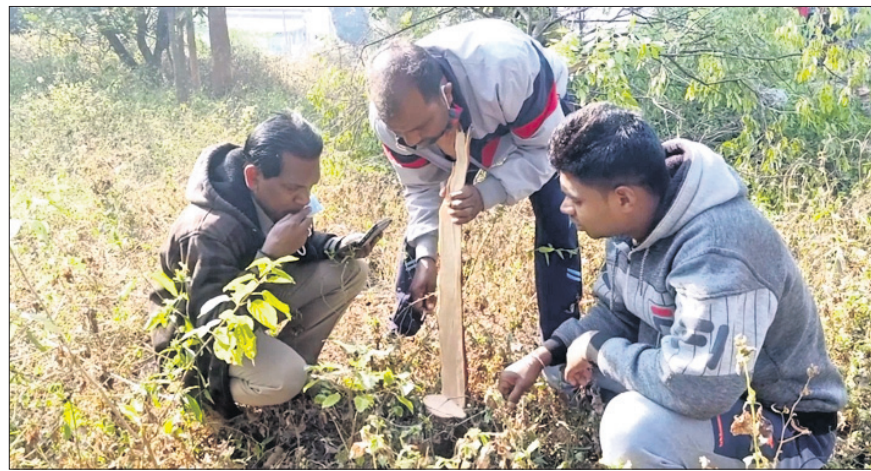
ବନ ବିଭାଗ ଅଧିକାରୀମାନେ ଚଢ଼ନ୍ତ କରୁଛନ୍ତି।

ଉତ୍ତରକୋଟ, ୧୪।୧୨(ସ.ପ୍ର.) ନବରଙ୍ଗପୁର ଜିଲ୍ଲା ଉତ୍ତରକୋଟ ପୌରାଞ୍ଚଳ ଅଧୀନ ଗୋଡ଼ିଗୁଡ଼ା (୨ନଂ. ଓଡ଼) ଅଞ୍ଚଳରୁ ରବିବାର ରାତିରେ ପ୍ରାୟ ୮ ଭୂ ଉର୍ଦ୍ଧ୍ୱ ଚନ୍ଦନଗଛ ଚୋରି ହୋଇଥିବା ଅଭିଯୋଗ ହୋଇଛି। ପୂର୍ବରୁ ଅନୁଯାୟୀ, ସୌନ୍ଦର୍ଯ୍ୟ ବୃଦ୍ଧି ପାଇଁ ସାହିର ଯୁବଗୋଷ୍ଠୀଙ୍କ ପ୍ରଚେଷ୍ଟାରେ ଚନ୍ଦନ ସମେତ ବିଭିନ୍ନ ଚାଷାଚାରଣ କରାଯାଇଥିଲା। ତେବେ ରବିବାର ରାତିରେ ଦୁର୍ଭିକ୍ଷମାନେ ଅଞ୍ଚଳକୁ ପ୍ରାୟ ୮ ଭୂ ଉର୍ଦ୍ଧ୍ୱ ଚନ୍ଦନ ଗଛ କାଟି ନେଇଯାଇଥିବା ଜଣାପଡ଼ିଛି। ମଧ୍ୟରାତ୍ରିରେ ଦୁର୍ଭିକ୍ଷମାନେ ସାହିରେ ପଶିଥିବା ସାହିବାସିନ୍ଦା ଜାଣିବାକୁ ପାଇଥିଲେ। କିନ୍ତୁ ସେମାନଙ୍କ ଘର ବାହାରେ ଦୁର୍ଭିକ୍ଷମାନେ ତାଲାପକାଇ ଗଛ କାଟିଥିଲେ। ତେଣୁ ସାହିବାସିନ୍ଦା ବାହାରକୁ ବାହାରିପାରି ନ ଥିଲେ। ତେବେ ସାହିବାସିନ୍ଦା ହୋହାଲ୍ଲା କରିବାକୁ ଆଉ କେତୋଟି ଗଛ ଅଧା